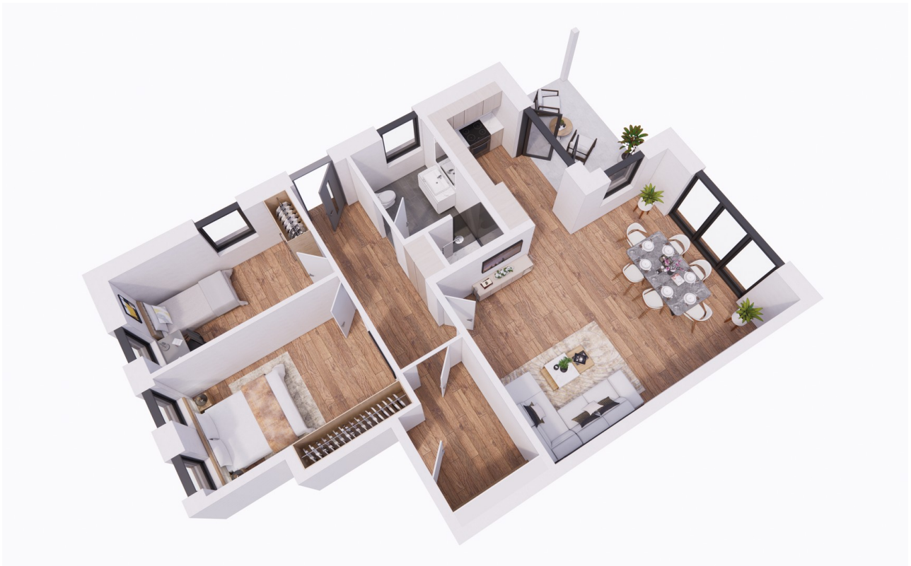
3D Grundriss Möbliert