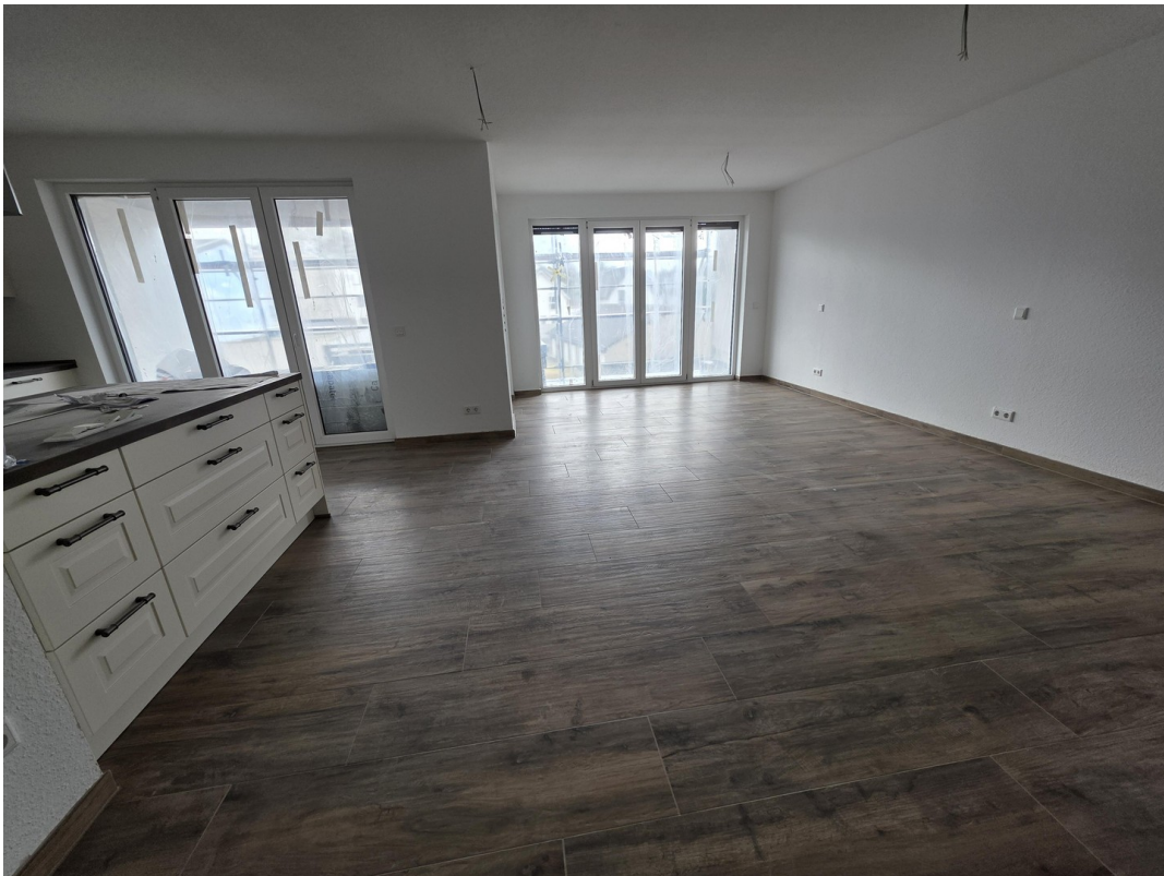
Kochinsel mit Wohn- Essraum