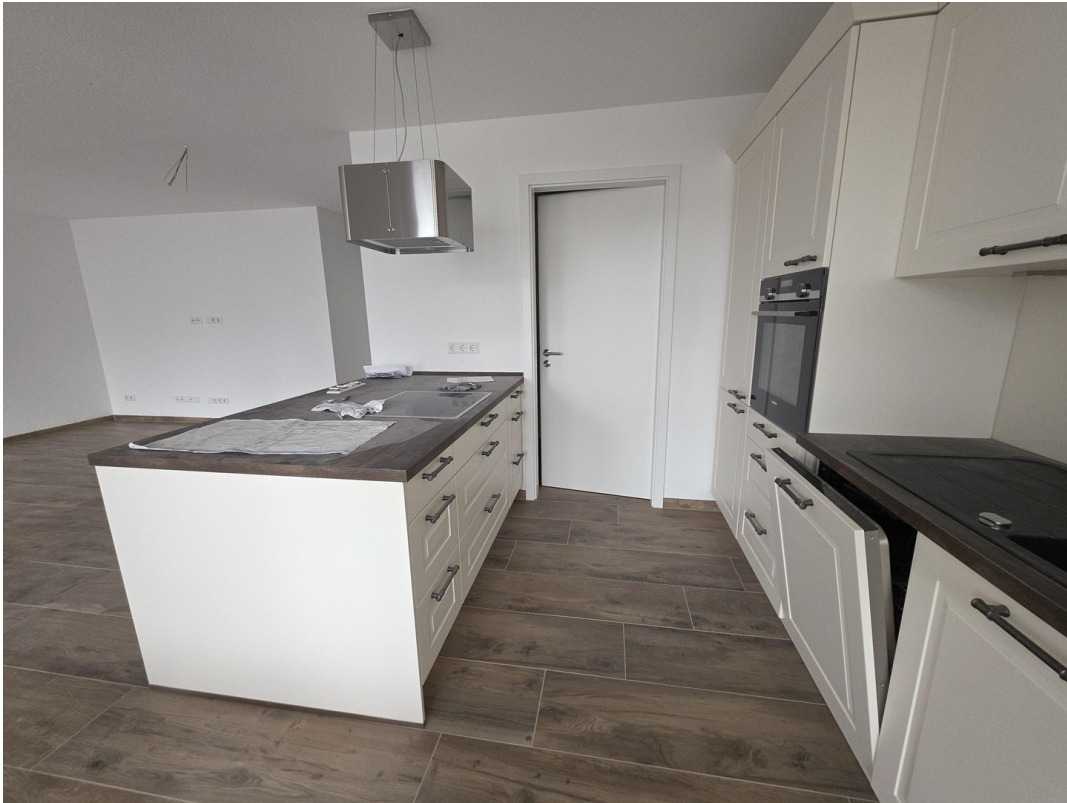
Küche mit Hauswirtschaftsraum