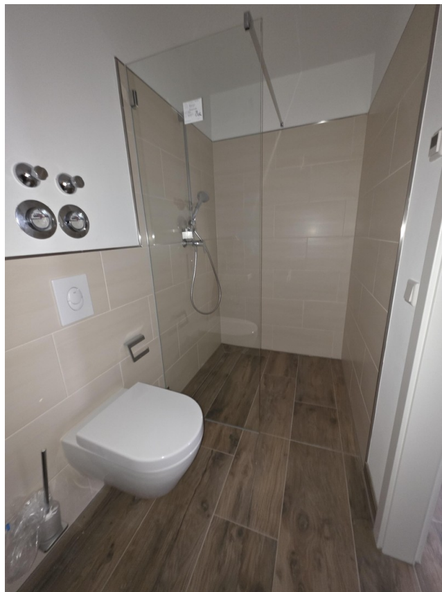
Gäste-WC mit 2. Dusche