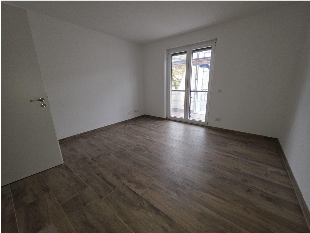
Arbeits-, Kinder-, Gästezimmer