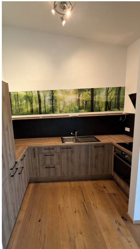
Küche mit E-Geräten