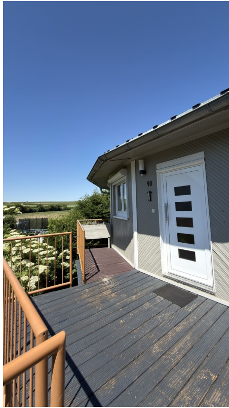
Eingang mit Terrasse