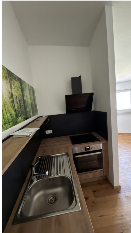
Küche mit E-Geräten