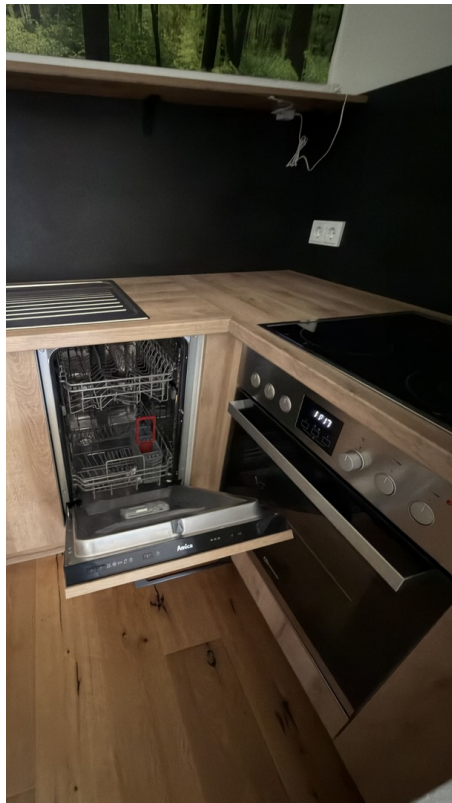
Küche mit E-Geräten