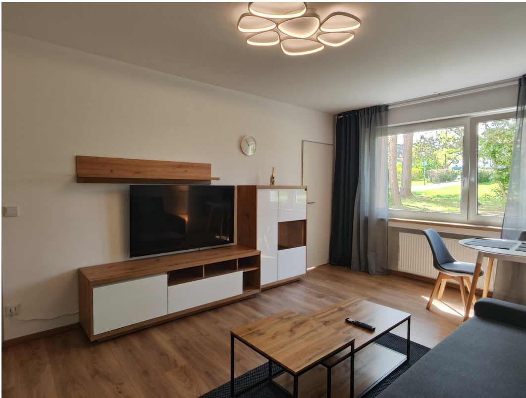
Wohnen / Schlafen