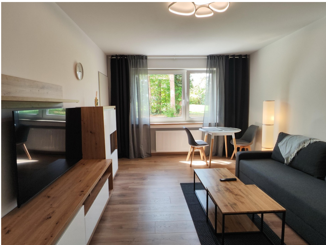
Wohnen / Schlafen