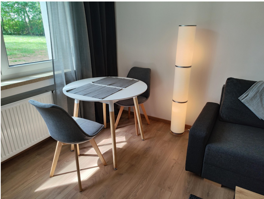
Wohnen / Schlafen