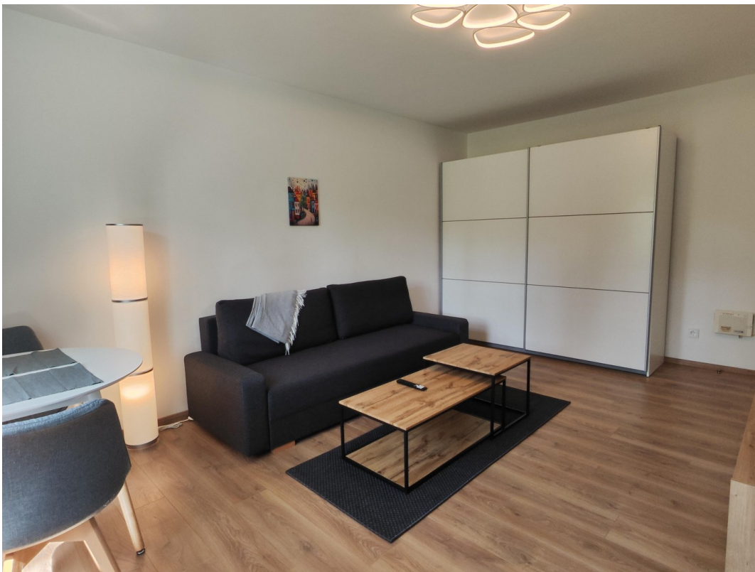
Wohnen / Schlafen