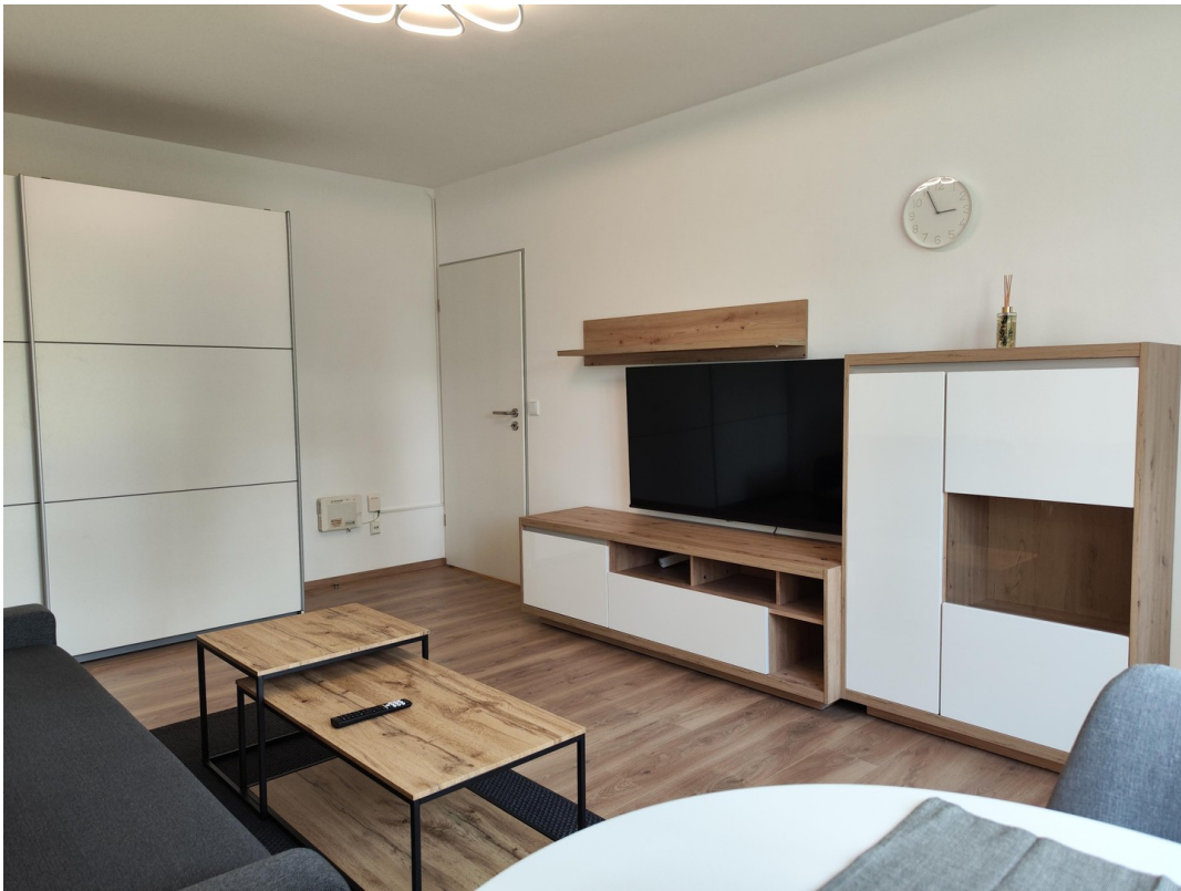
Wohnen / Schlafen