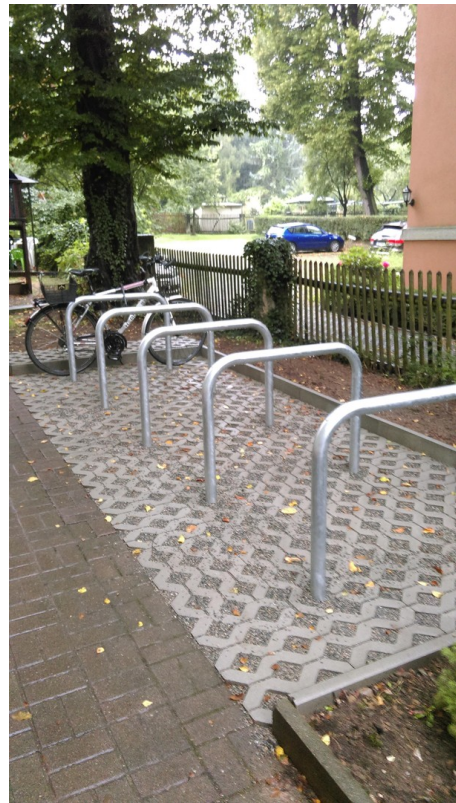
Für Fahrräder bestens geeignet