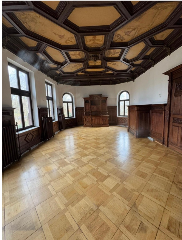
Wohn- & Arbeitszimmer