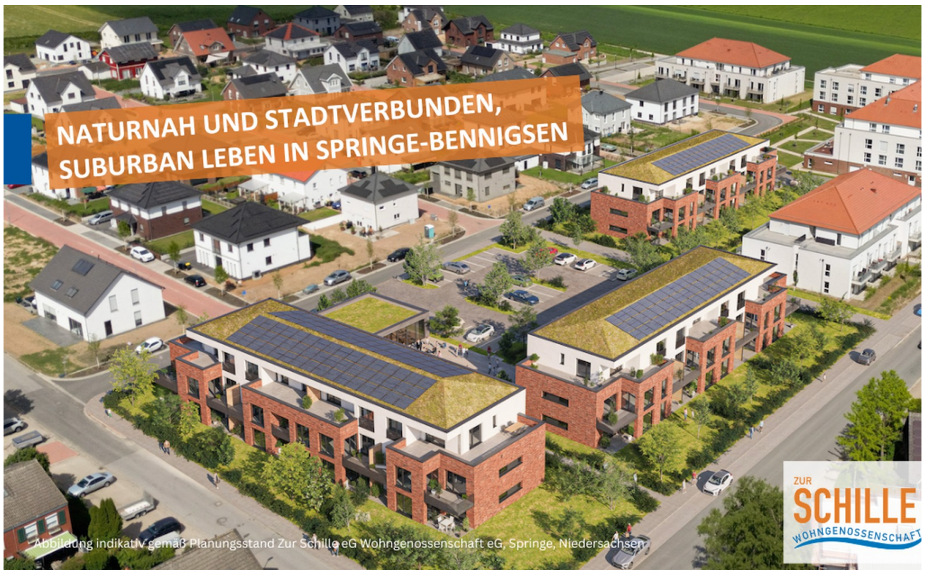
Zur Schille eG – Neubau Häuser