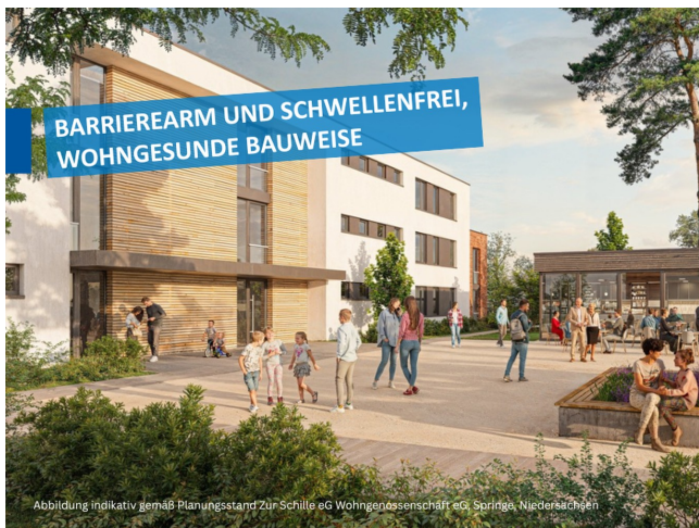
Abbildung indikativ gemäß Planungsstand Zur Schille eG Wohngemeinschaft eG, Springe, Niedersachsen