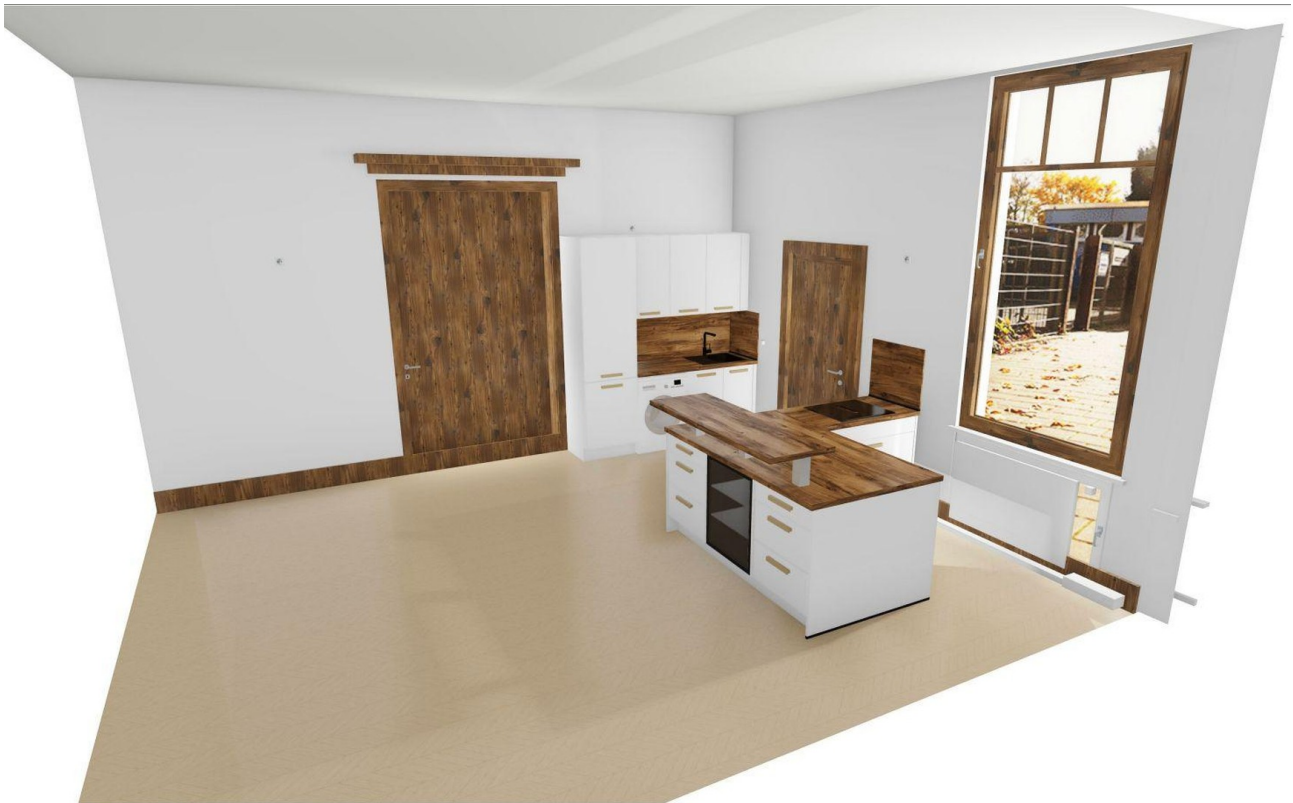
Neue Küche / Modell