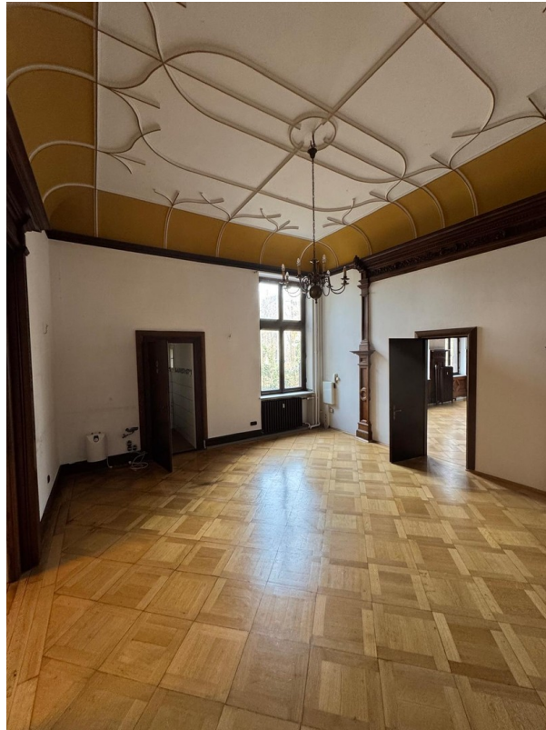
Raum neue Küche