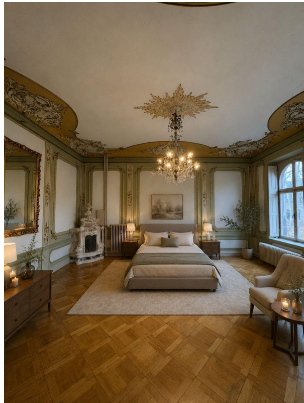
Kleiner Raum / KI