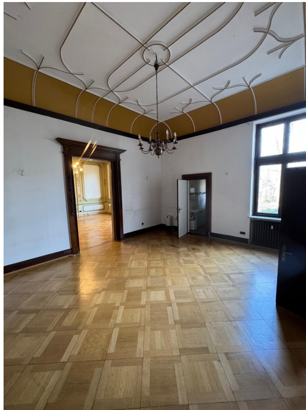
Raum neue Küche