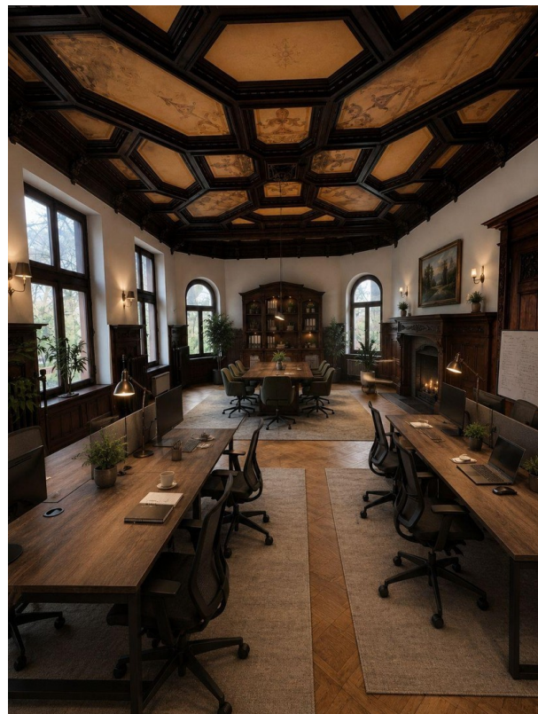
Großer Raum / KI