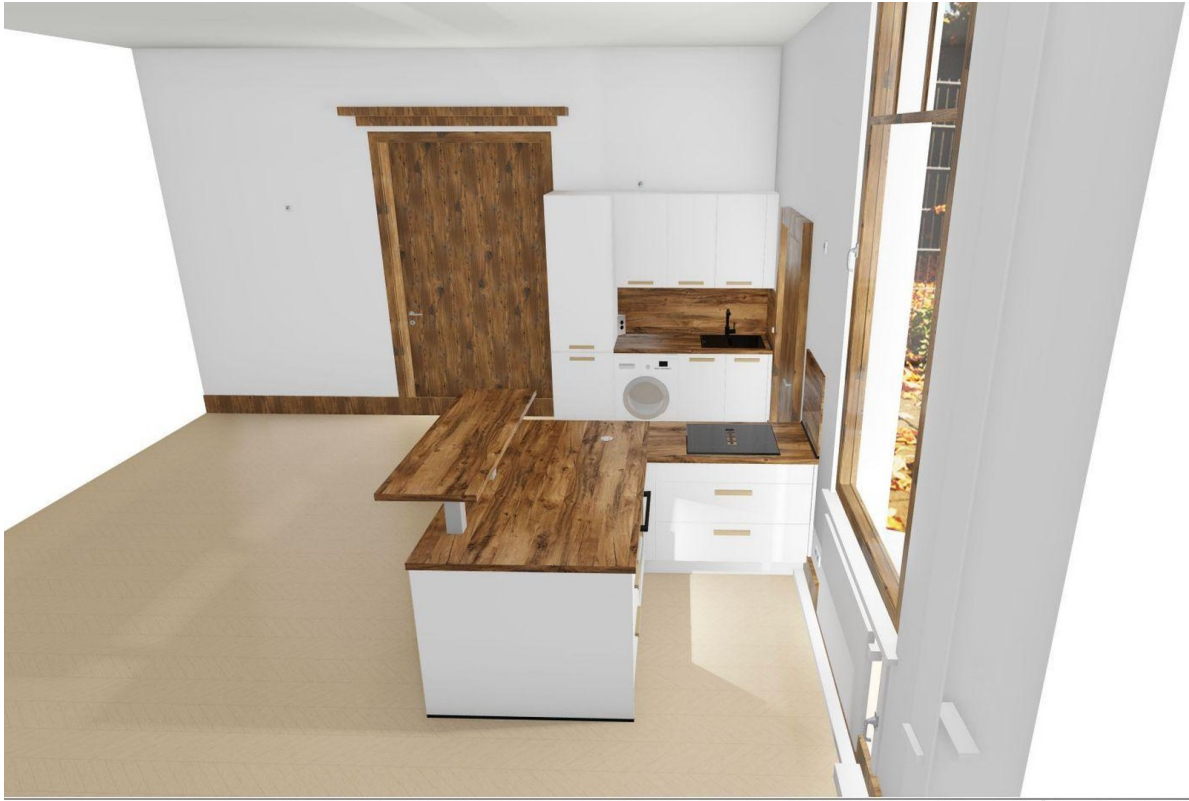
Neue Küche / Modell