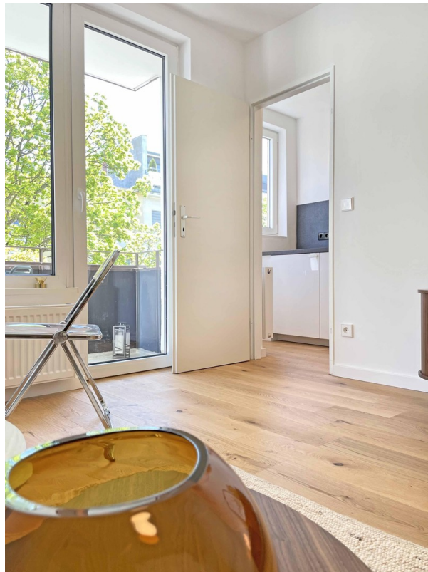
Wohnen und Küche