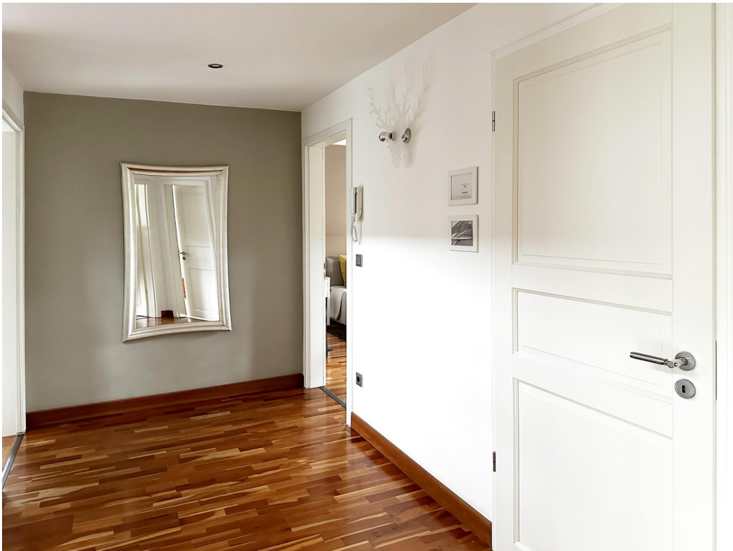
Flur im 1. OG