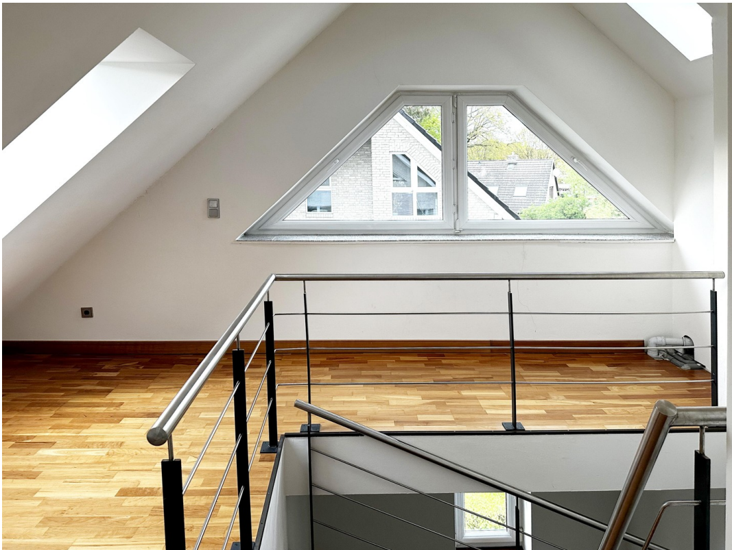
Galerie im 2. OG