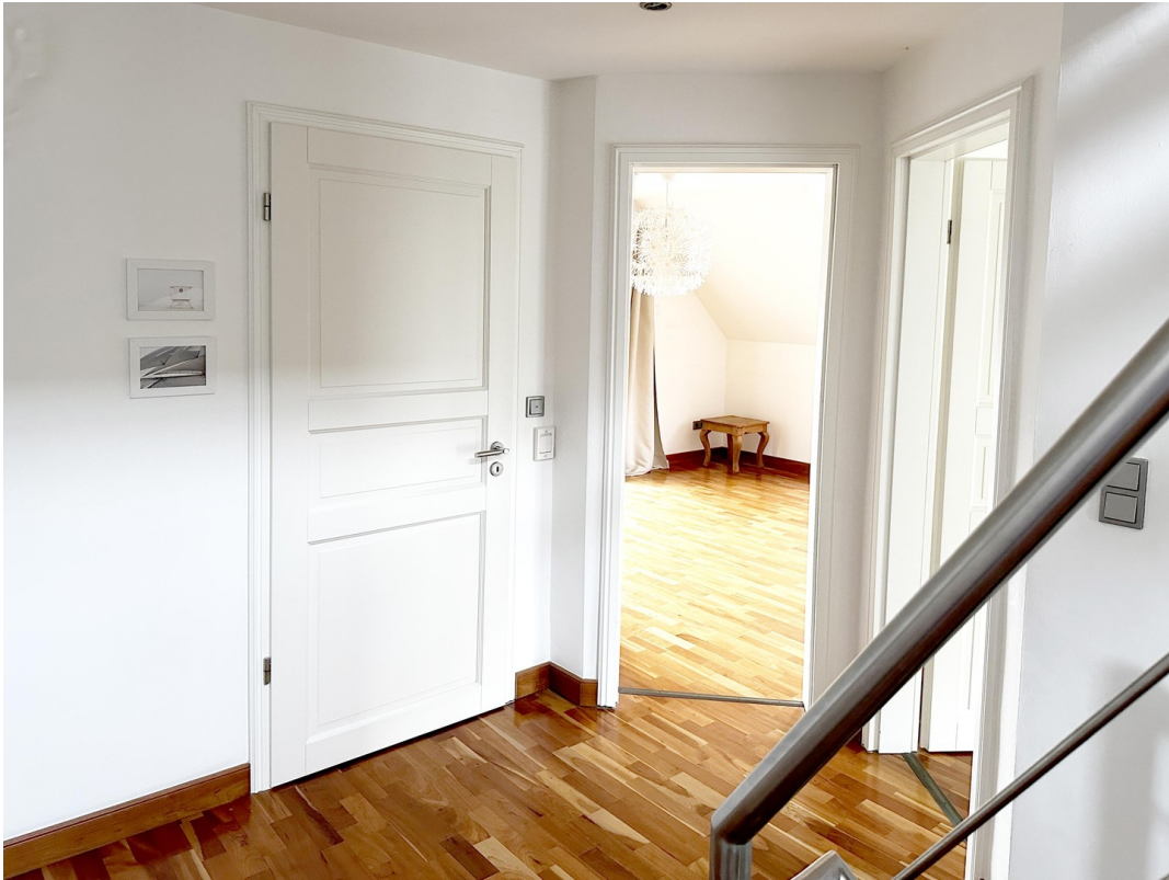
Flur im 1. OG