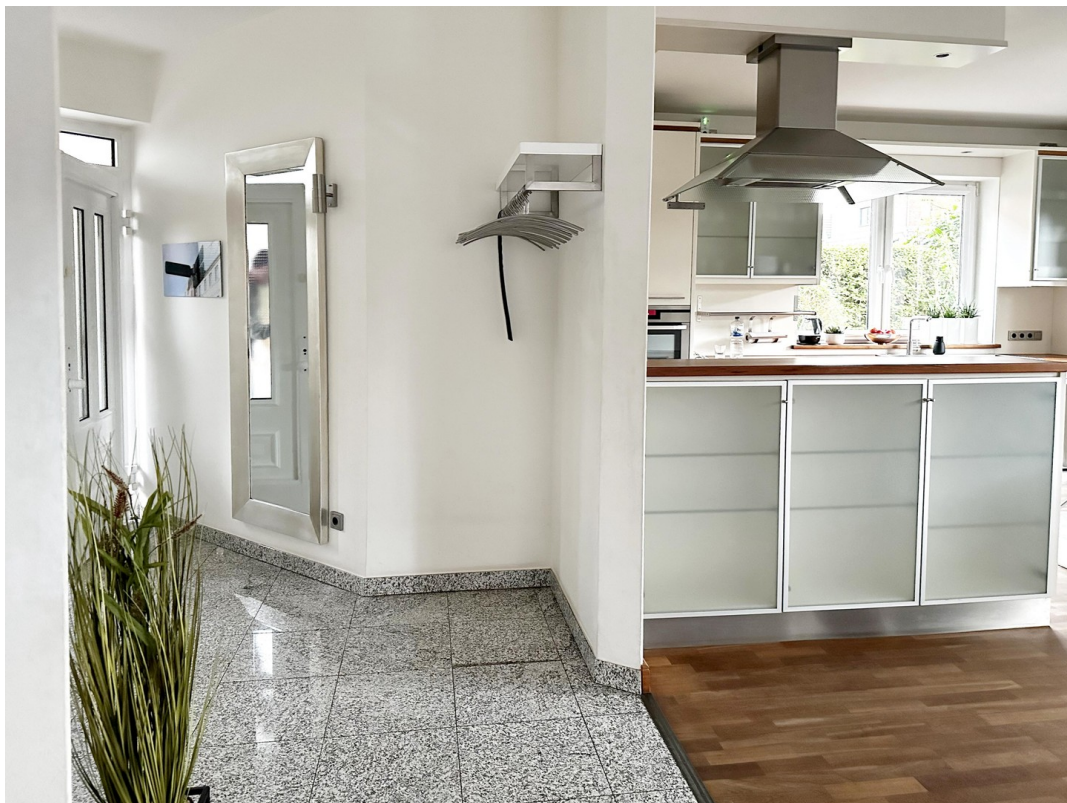
Flur mit Garderobe