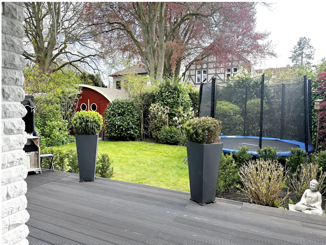
Terrasse mit Gartenblick