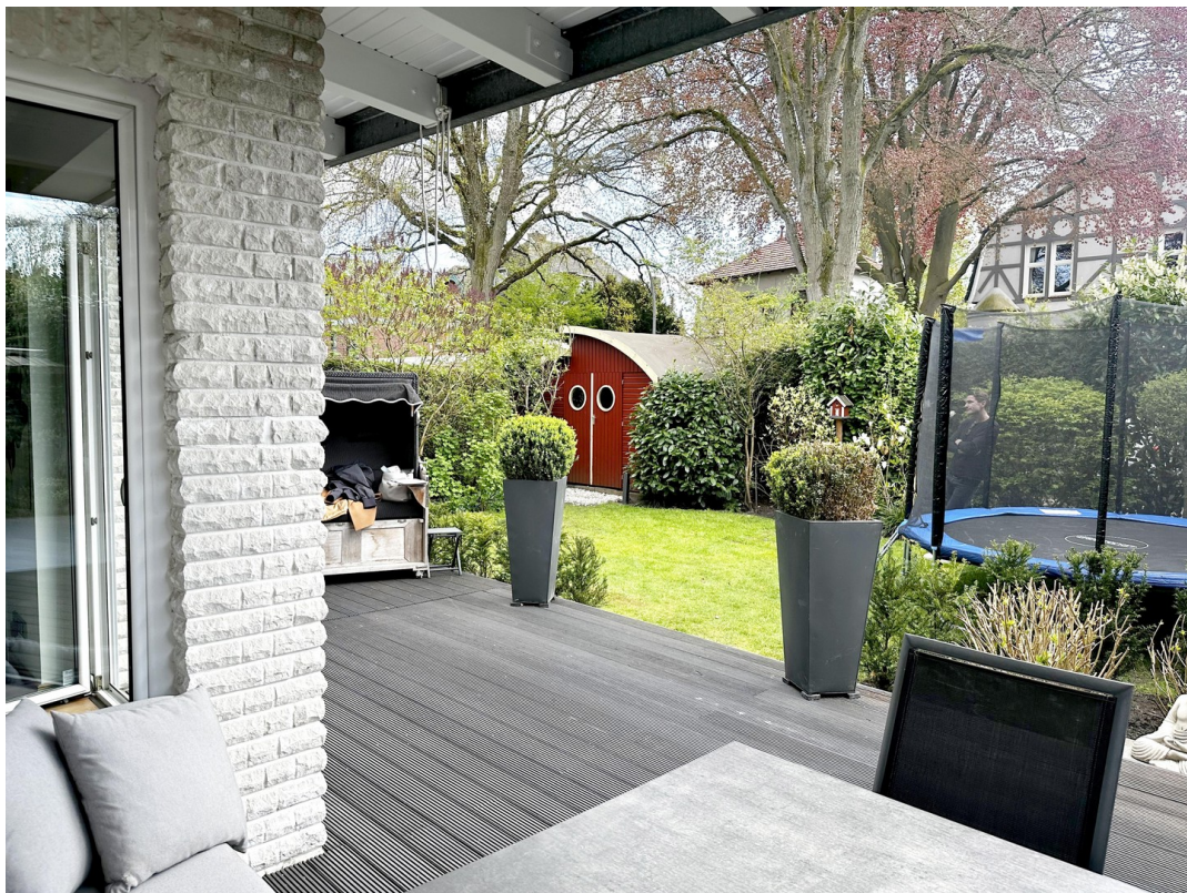
Terrasse mit Gartenblick