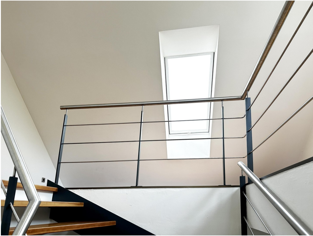
Galerie im 2. OG