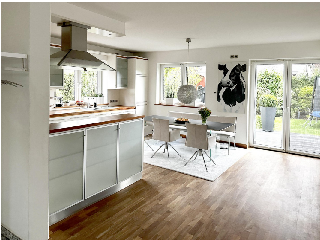
Zugang zum Garten