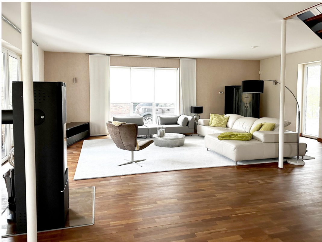
großes Wohnzimmer mit Terrasse