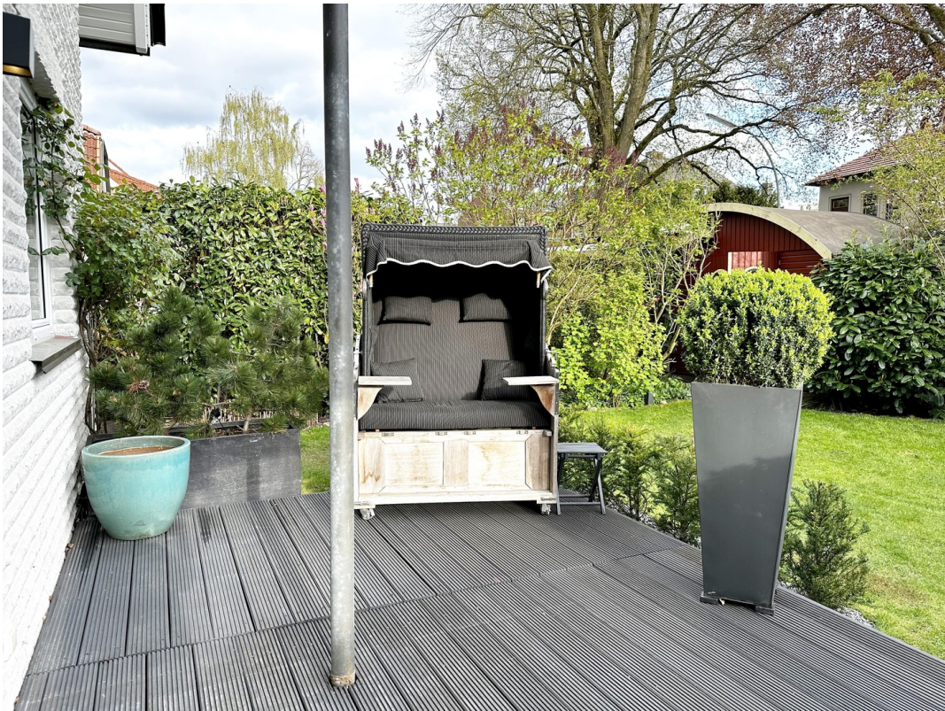
Terrasse vor der Küche