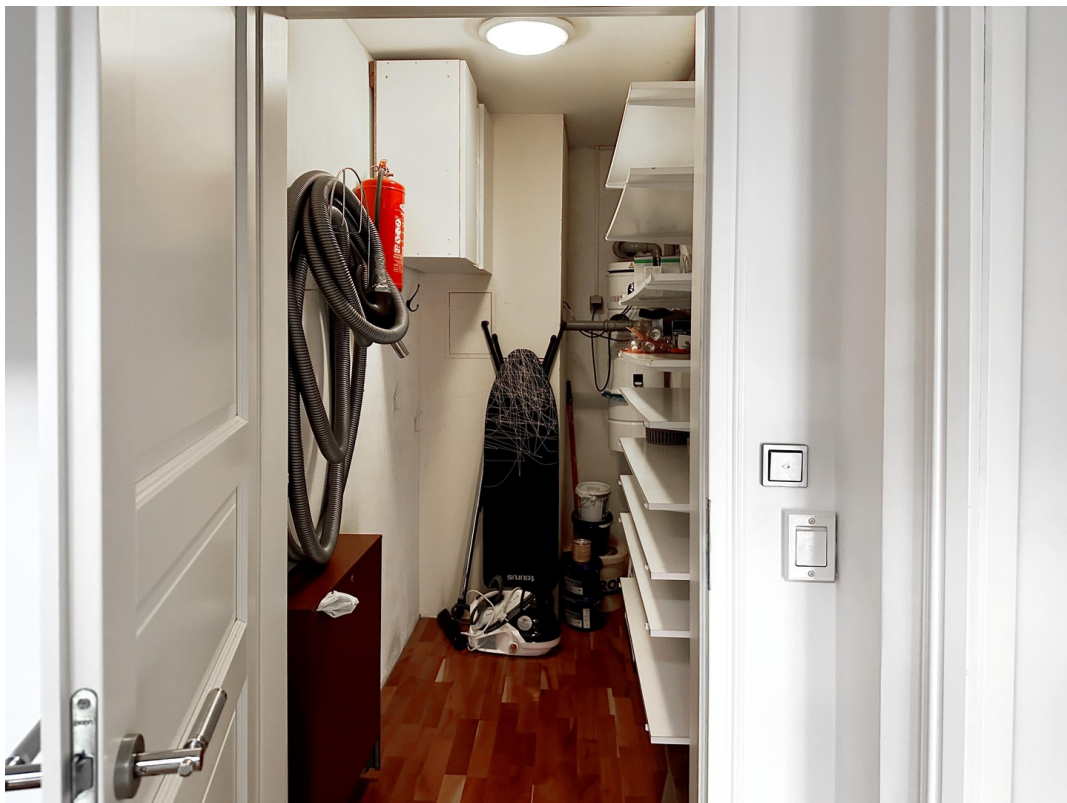
Abstellraum 1. OG