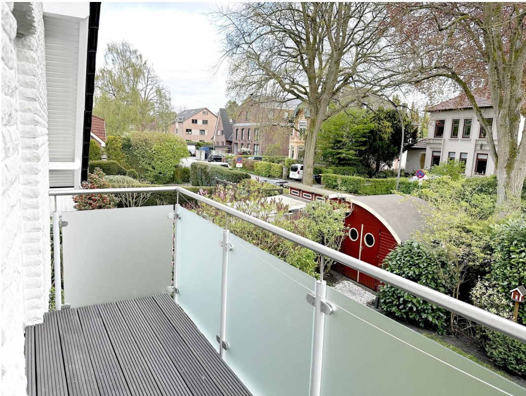
Balkon im 1. OG