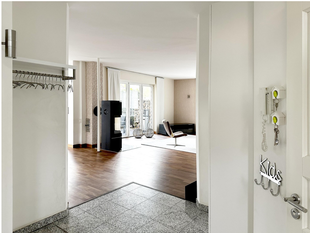
Wohn- Essbereich mit Kamin