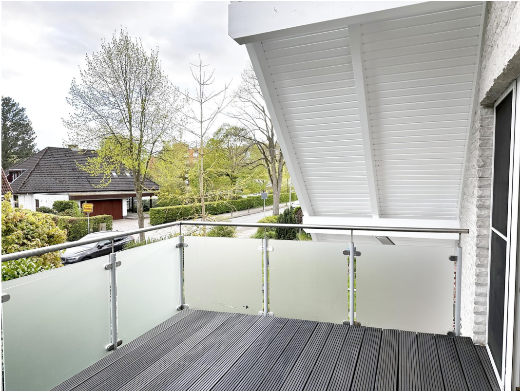
Balkon im 1. OG