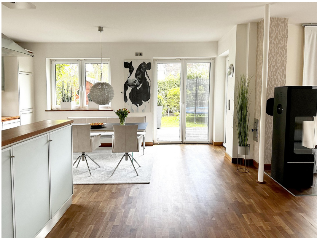
Zugang zum Garten