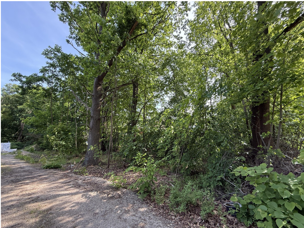
Baugrundstück von der Seite