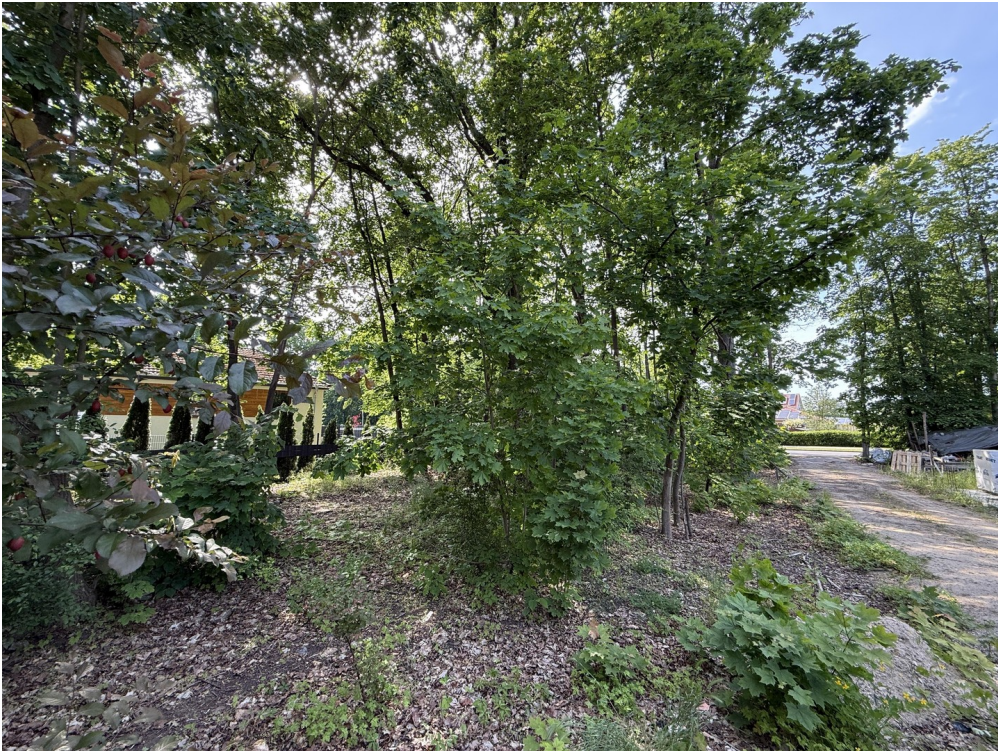
Baugrundstück von Südost