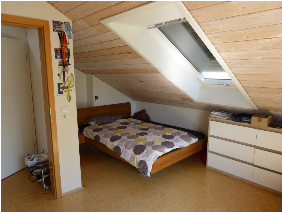
Zimmer 2 DG