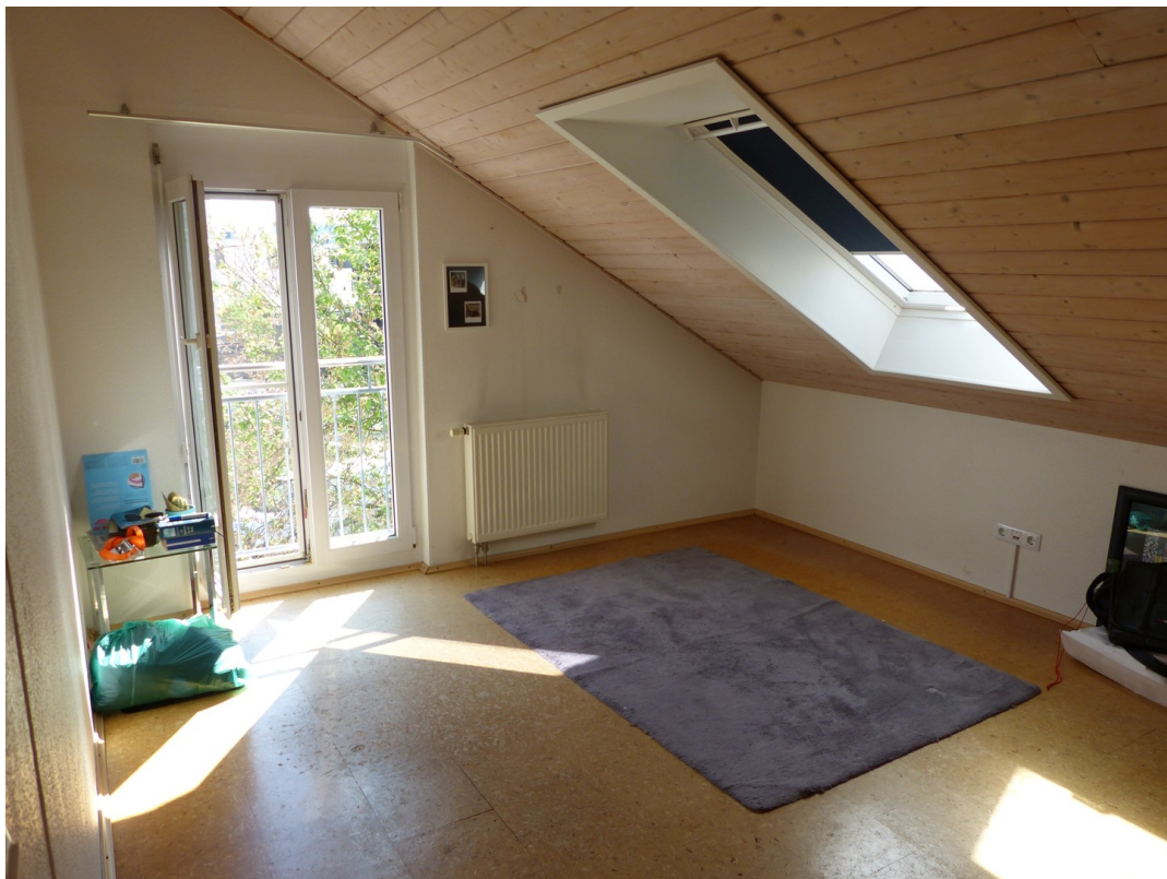
Zimmer 1 DG