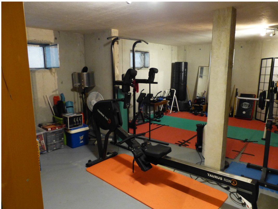
großer Keller (Nutzfläche)