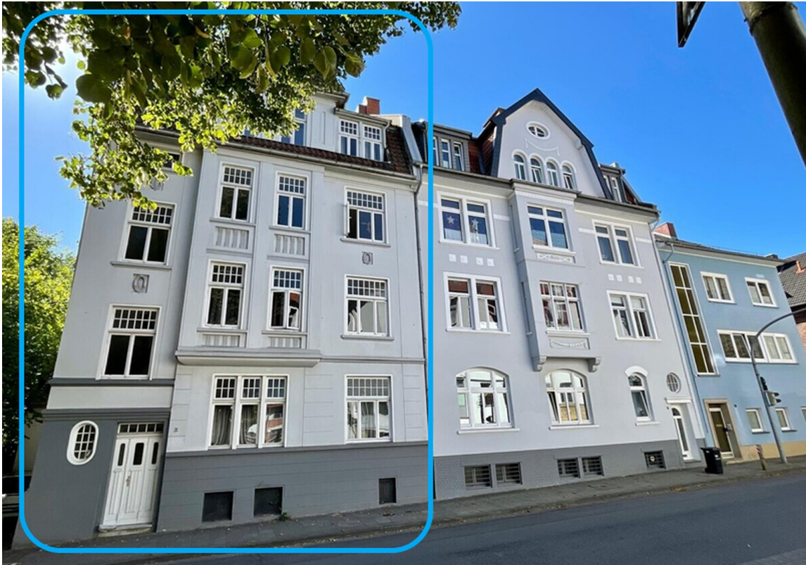
Haus blau eingerahmt