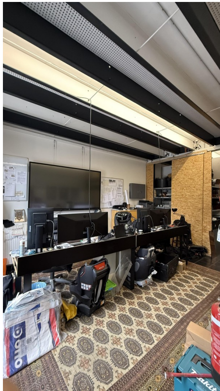
Halle (Wir leer übergeben)