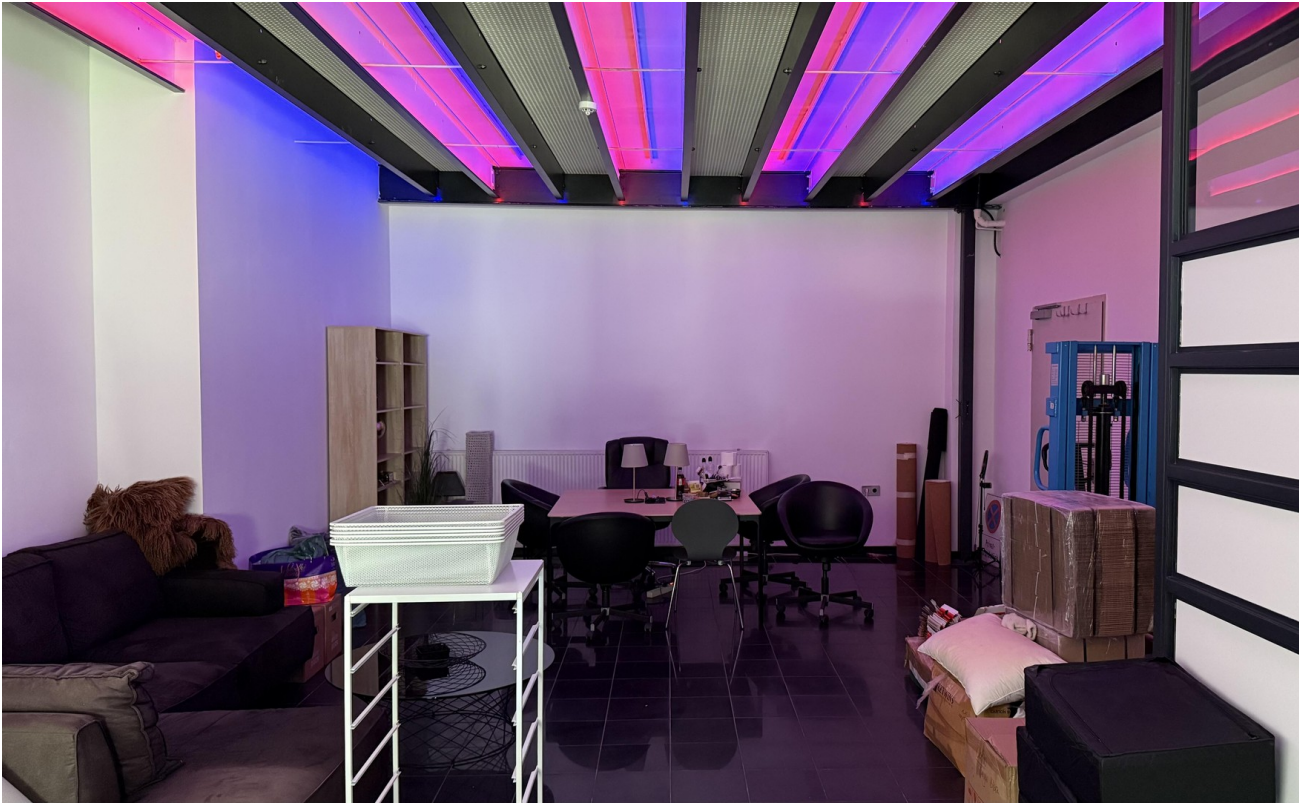
Beleuchtung Halle rot o. blau