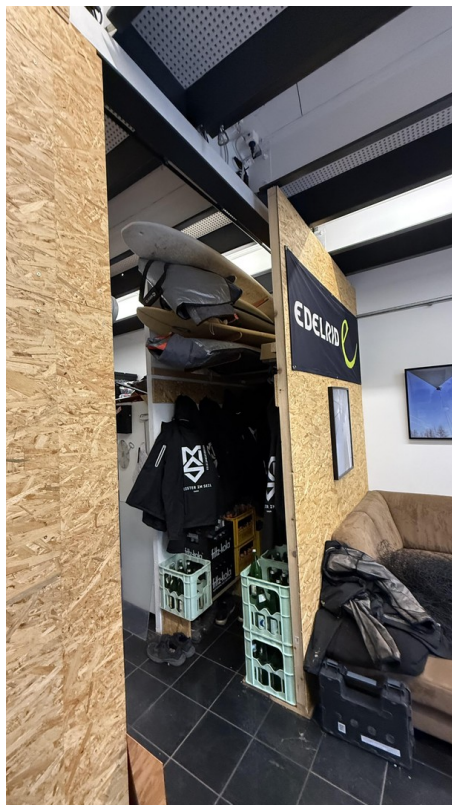
Halle (Wir leer übergeben)