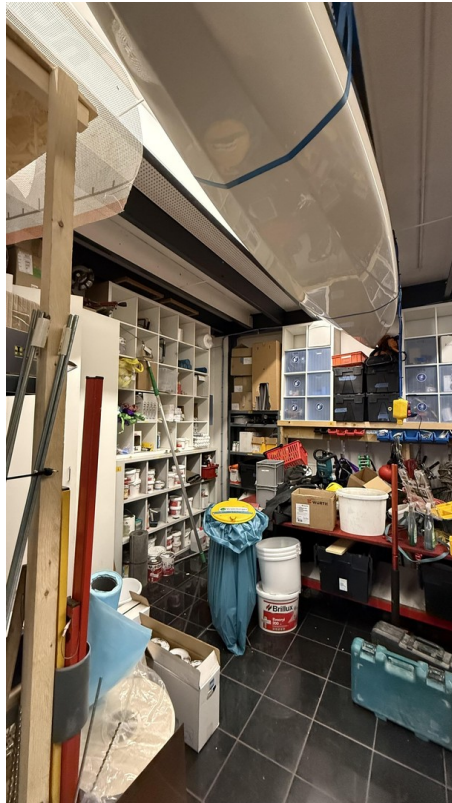
Halle (Wir leer übergeben)