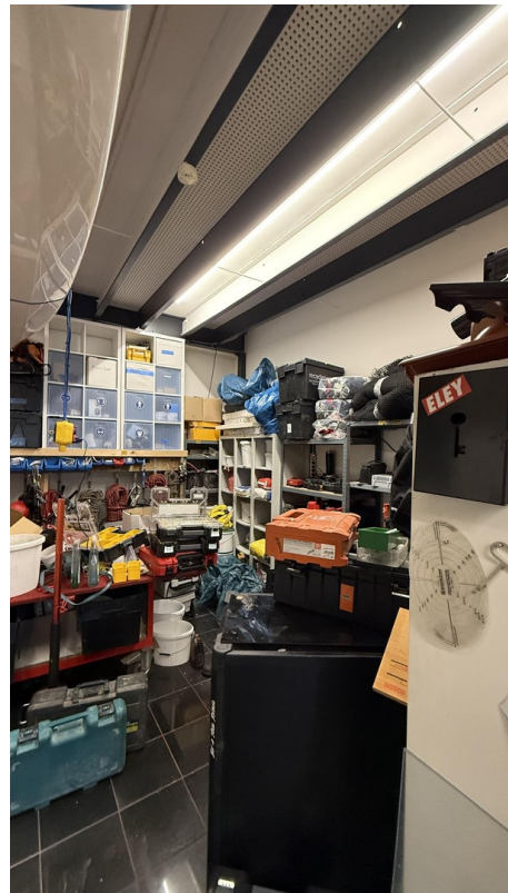
Halle (Wir leer übergeben)