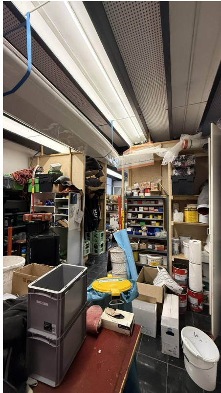
Halle (Wir leer übergeben)