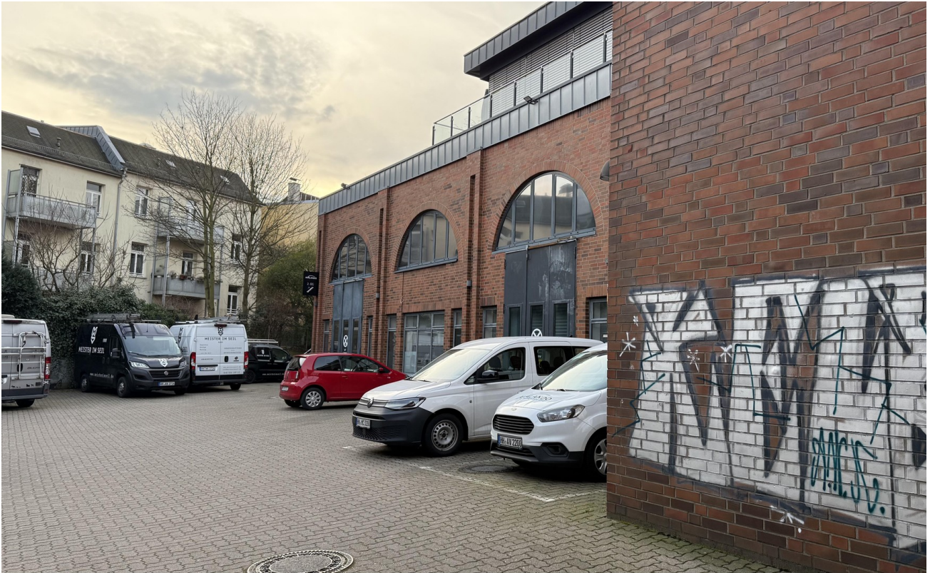
Ansicht Gebäude (Hofeinfahrt)