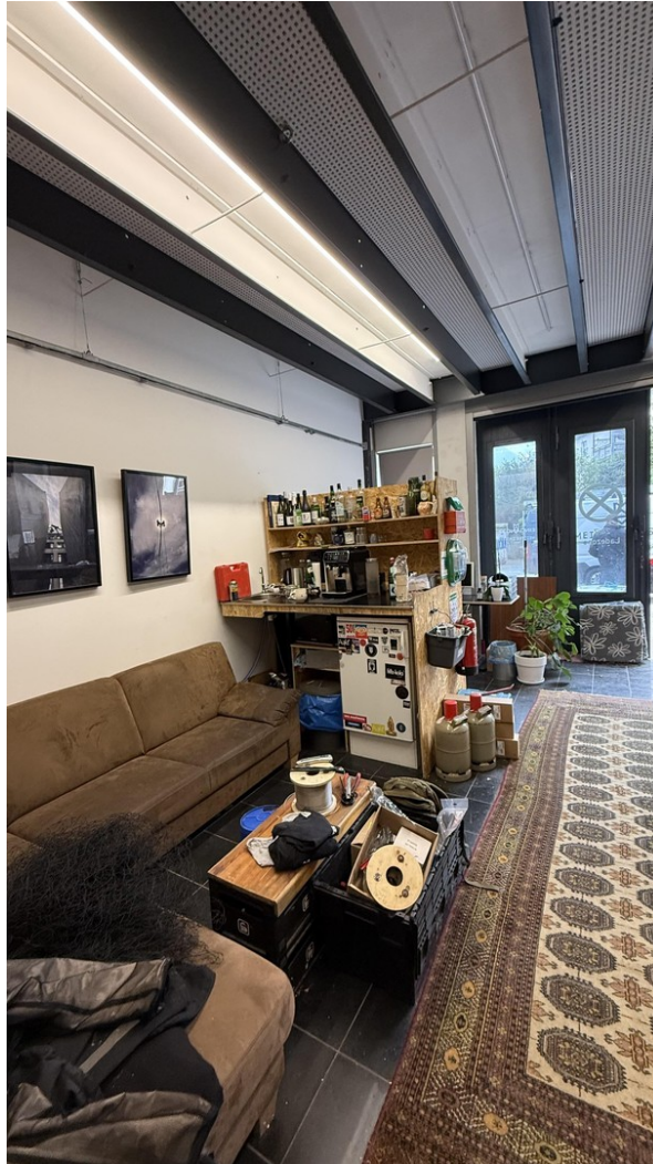
Halle (Wir leer übergeben)