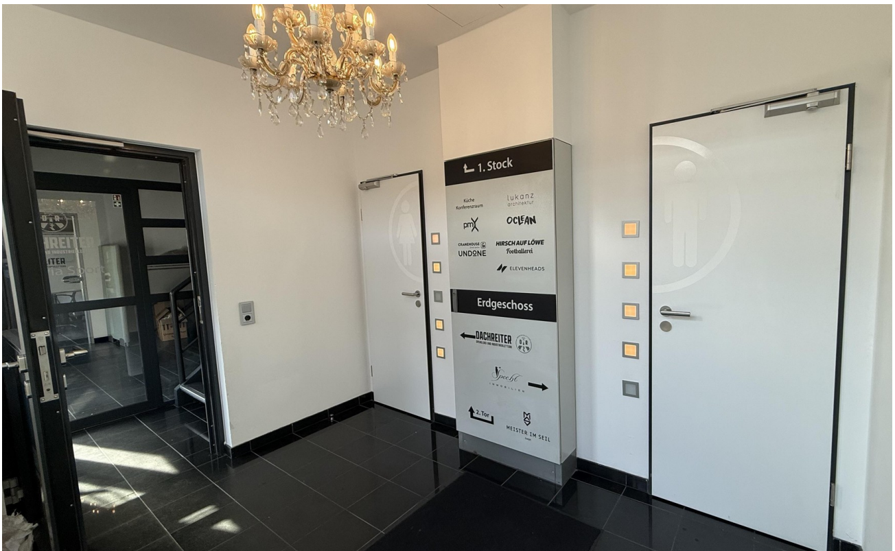
Empfang mit Wegweiser