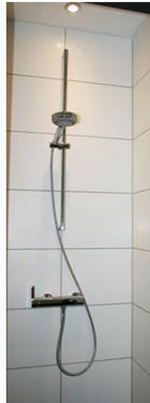
Toilette, Waschbecken, Dusche