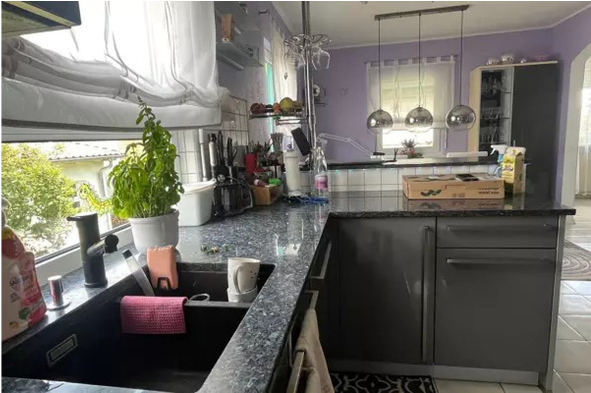
EBK mit Granit-Arbeitsplatte