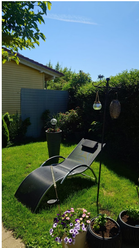
Teil vom Garten