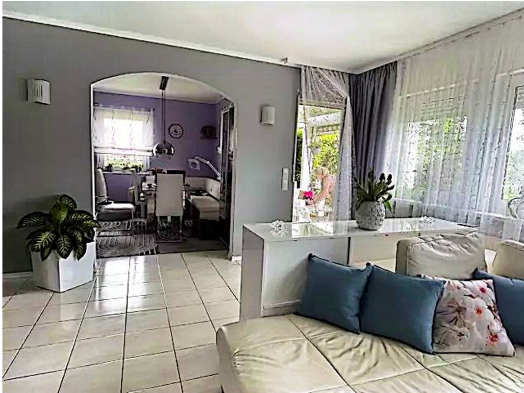
Wohnzimmer mit Durchgang