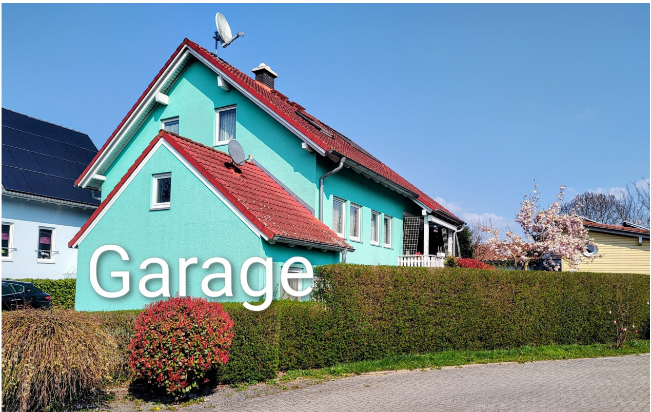
Garage 3,30 x 6 mtr.