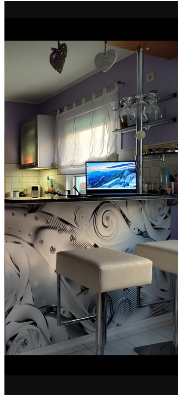
Offene Küche mit Sitztheke