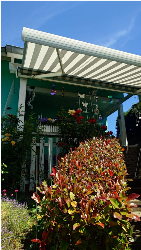
Terrasse mit elektr. Markise