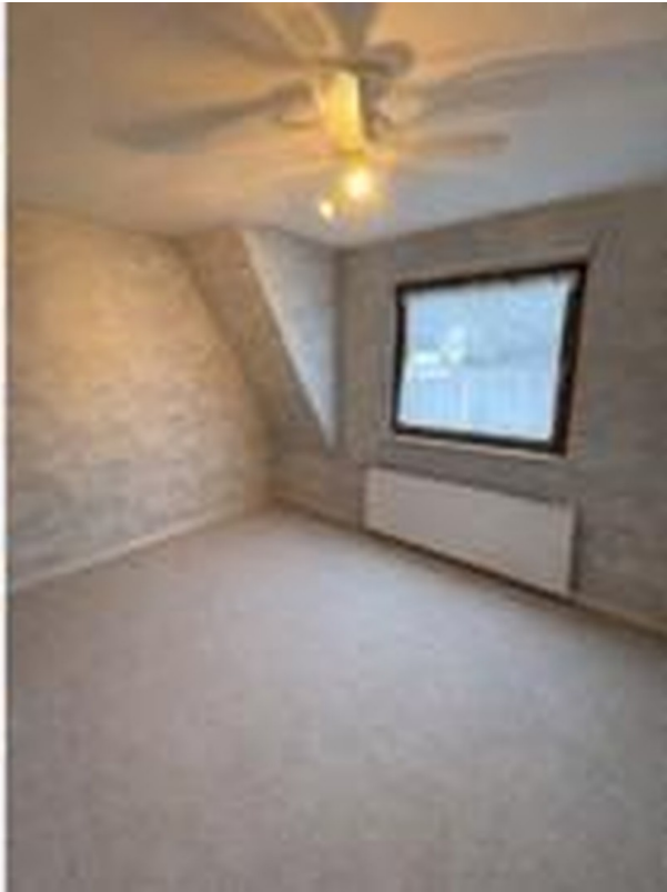
Kinderzimmer 1 und 2