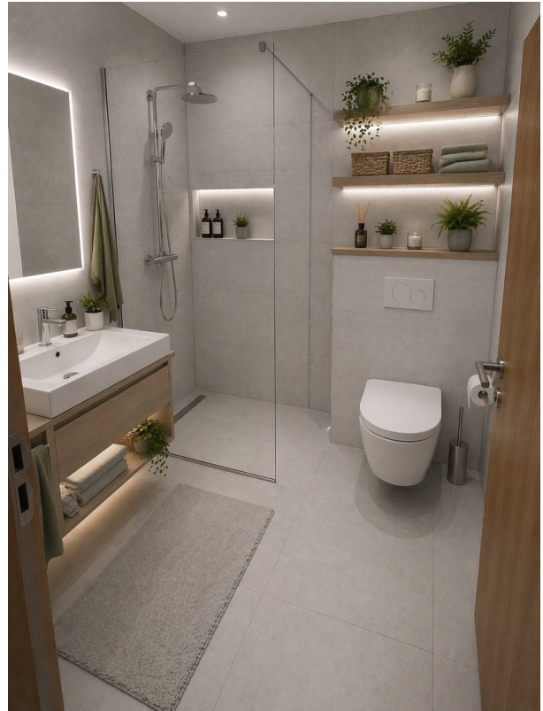
Idee Duschbad Erdgeschoss KI