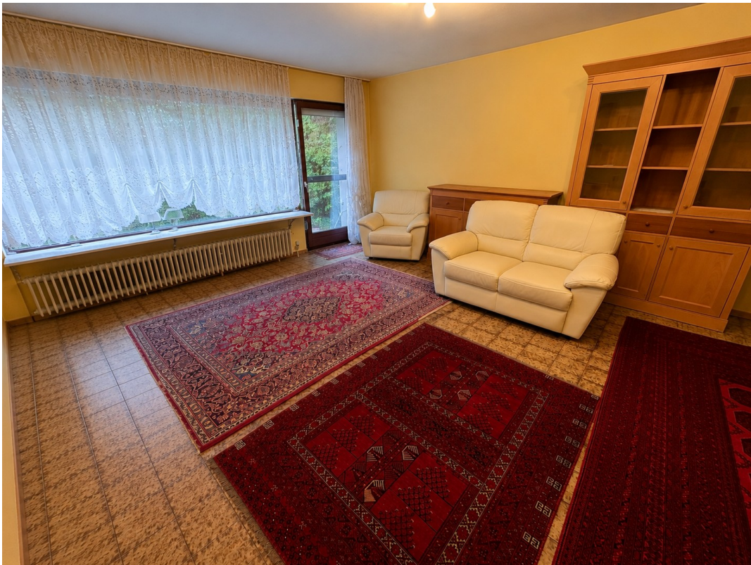
Wohnzimmer mit großem Fenster