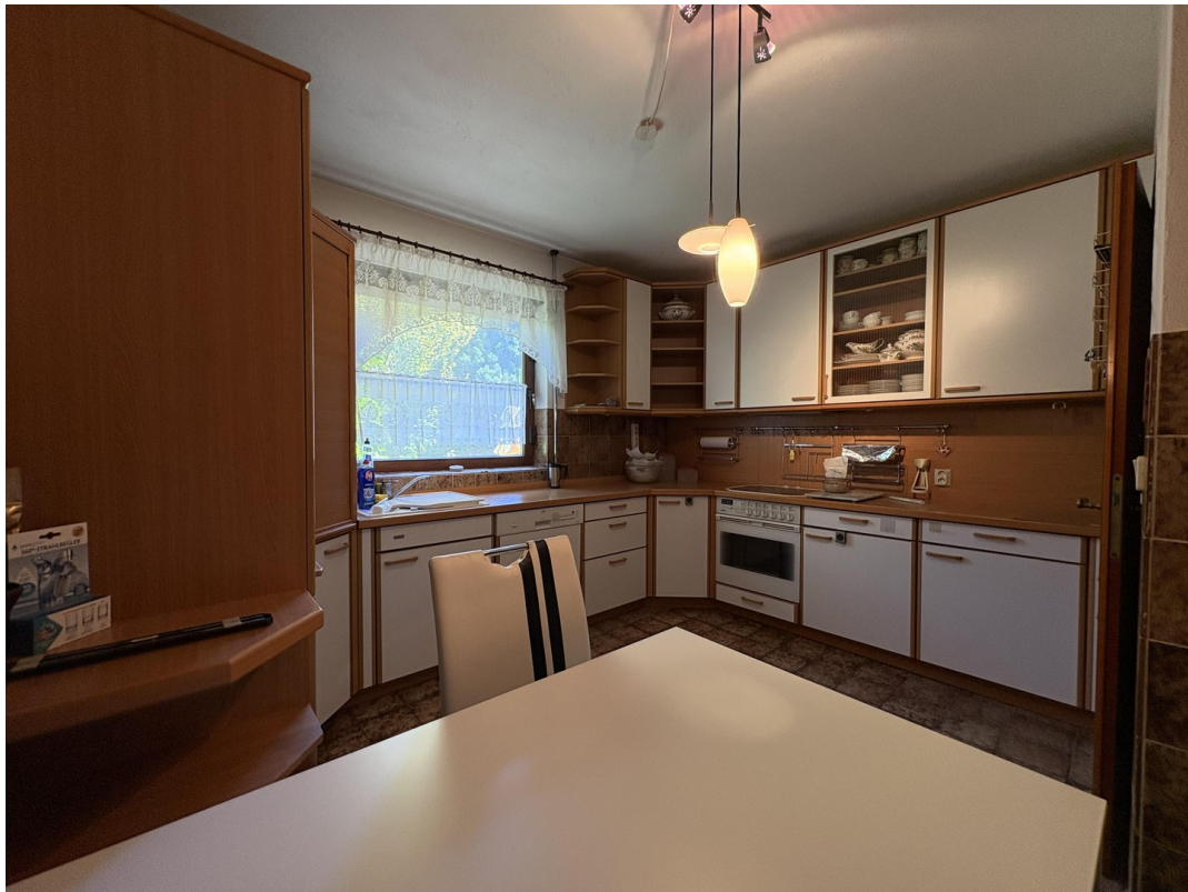
Küche mit Essplatz