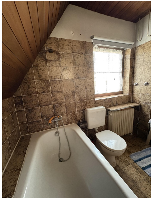
Wannenbad im Obergeschoss