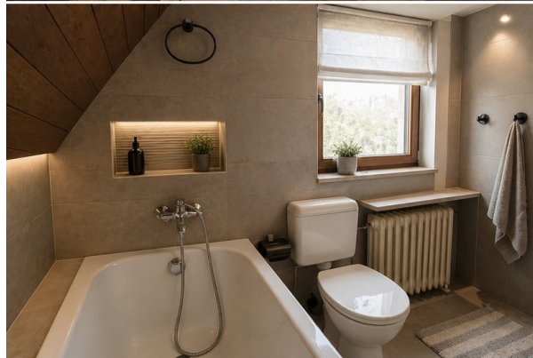
Idee Wannenbad Obergeschoss KI