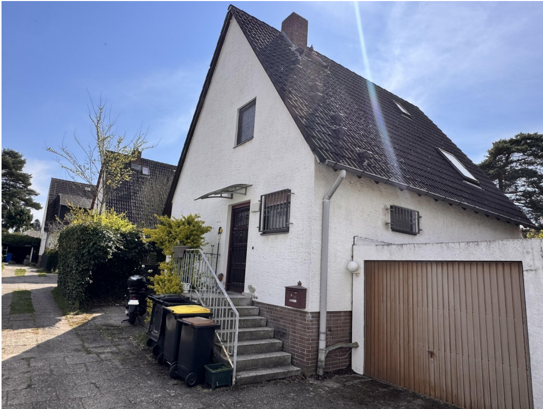
Auffahrt - Garage - Stellplatz