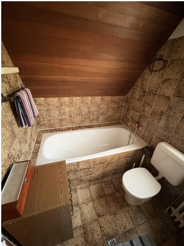
Wannenbad im Obergeschoss