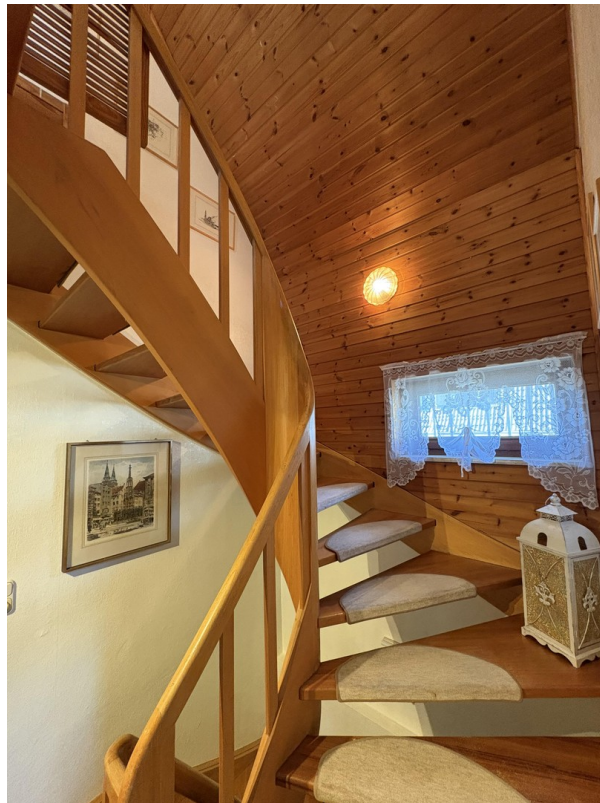
Treppe ins OG und Keller