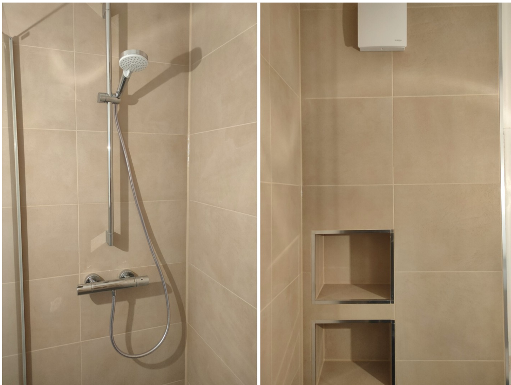
Armaturen im Bad