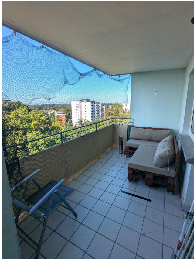
Westbalkon mit Aussicht