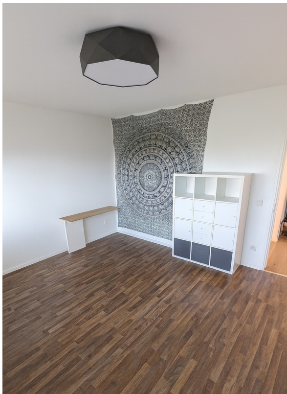
Büro / Kinderzimmer mit Balkon