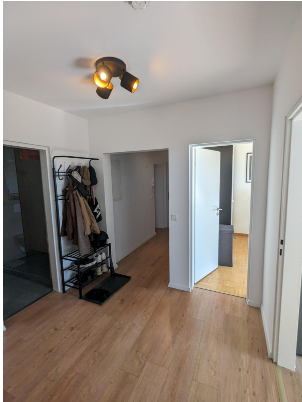
Flur mit Zugang in alle Zimmer