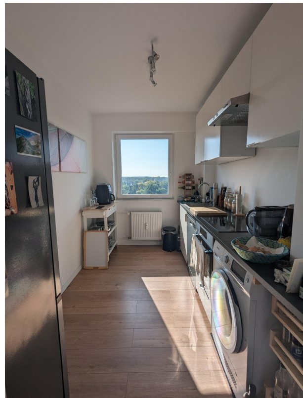
Einbauküche mit Geräten