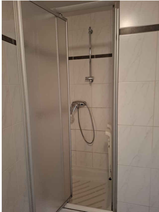
Dusche im Bad