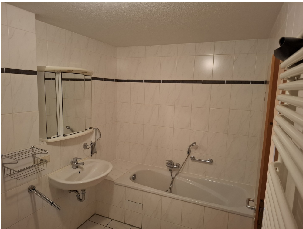
Badezimmer mit Wannenbad