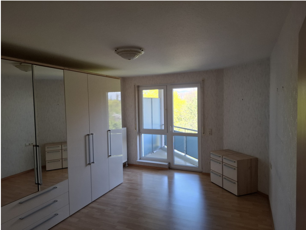
Schlafzimmer 1, Balkon