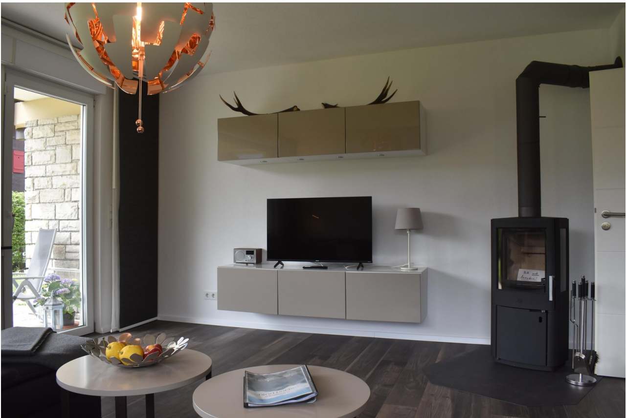
Wohnbereich m. Kaminofen