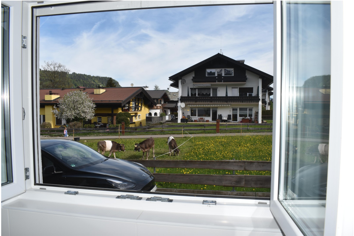
Blick aus dem Bad