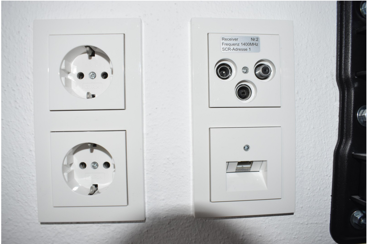
Neue Verkabelung inkl. LAN