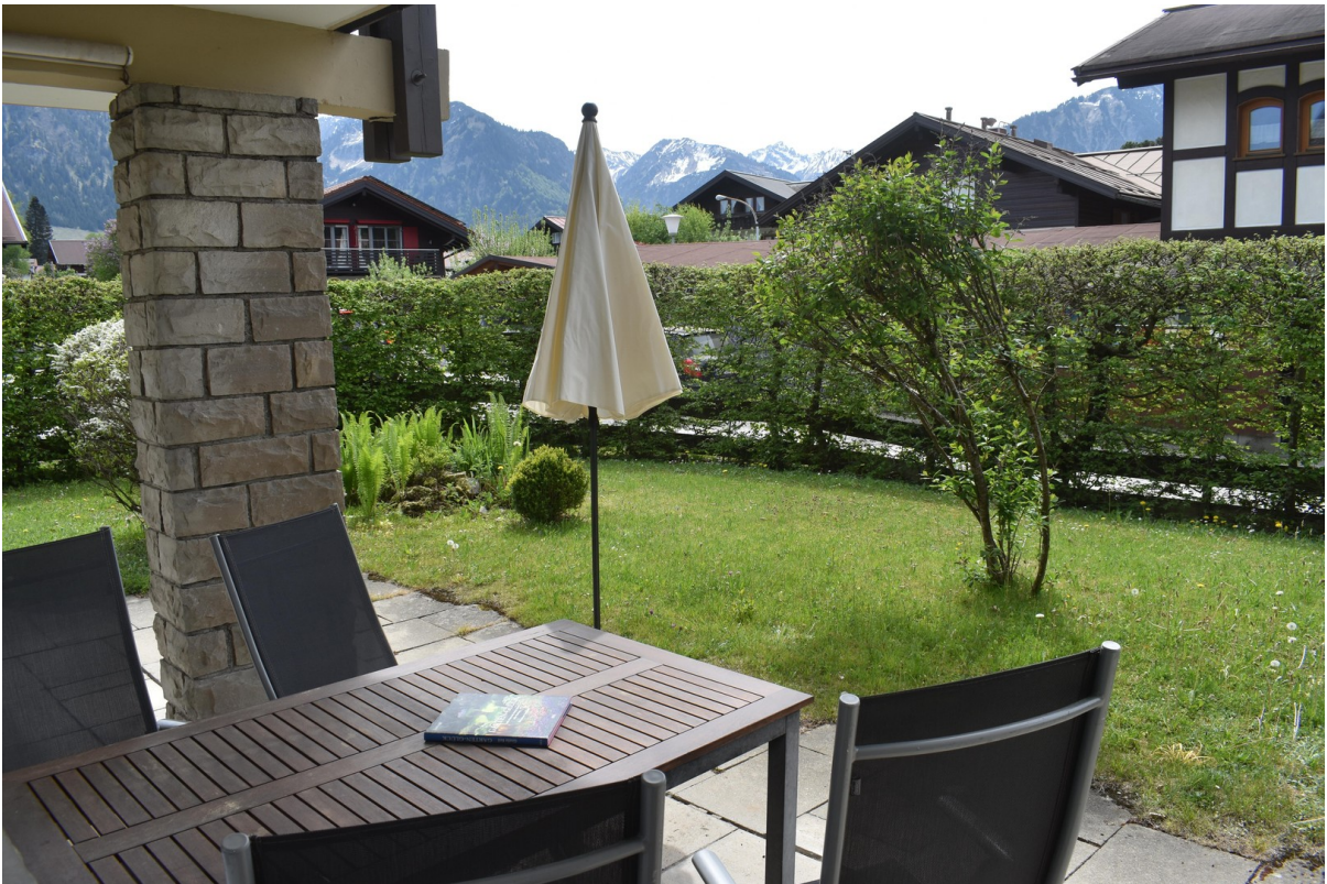
Großzüg. Terrasse m. Bergblick