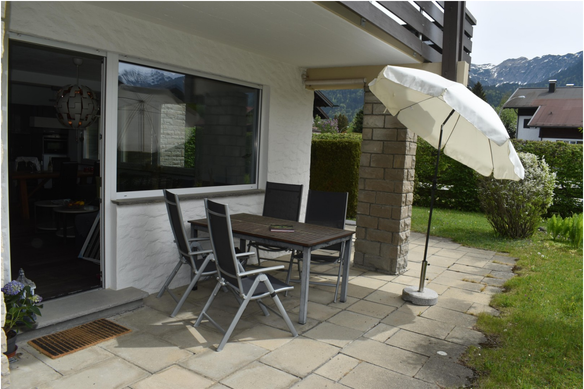
Großzüg. Terrasse m. Bergblick