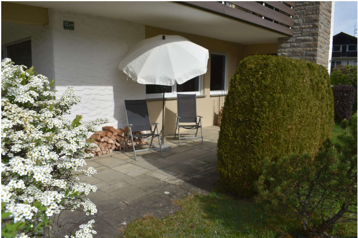
Großzüg. Terrasse m. Bergblick