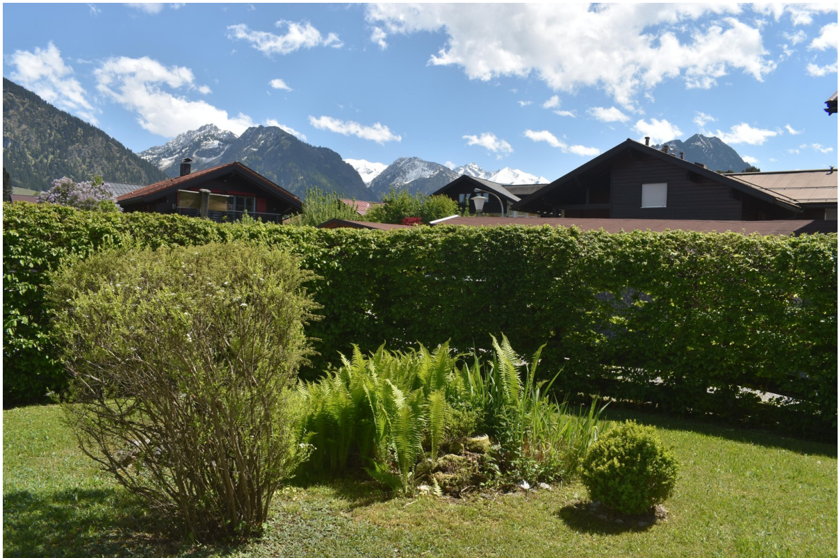
Großzüg. Terrasse m. Bergblick