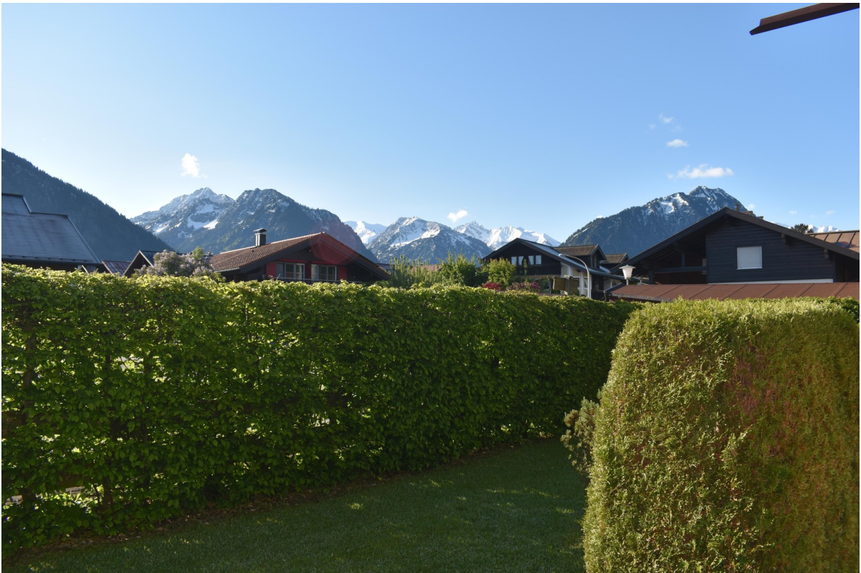
Großzüg. Terrasse m. Bergblick