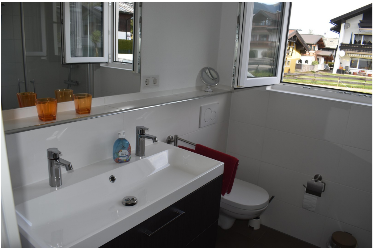
Bad mit Doppelwaschbecken