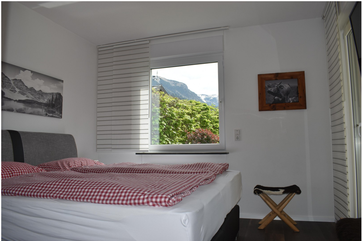
Blick vom Bett auf die Berge