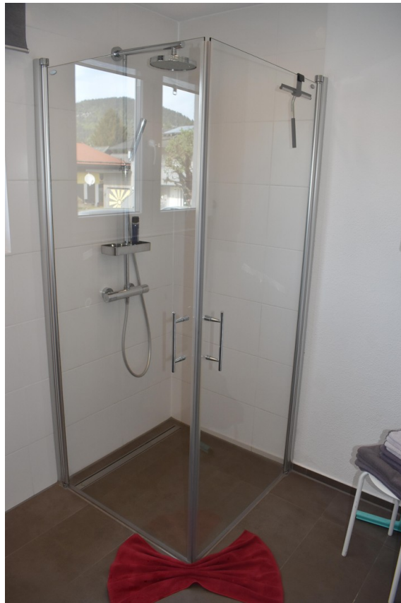
Stufenlose, bodenebene Dusche