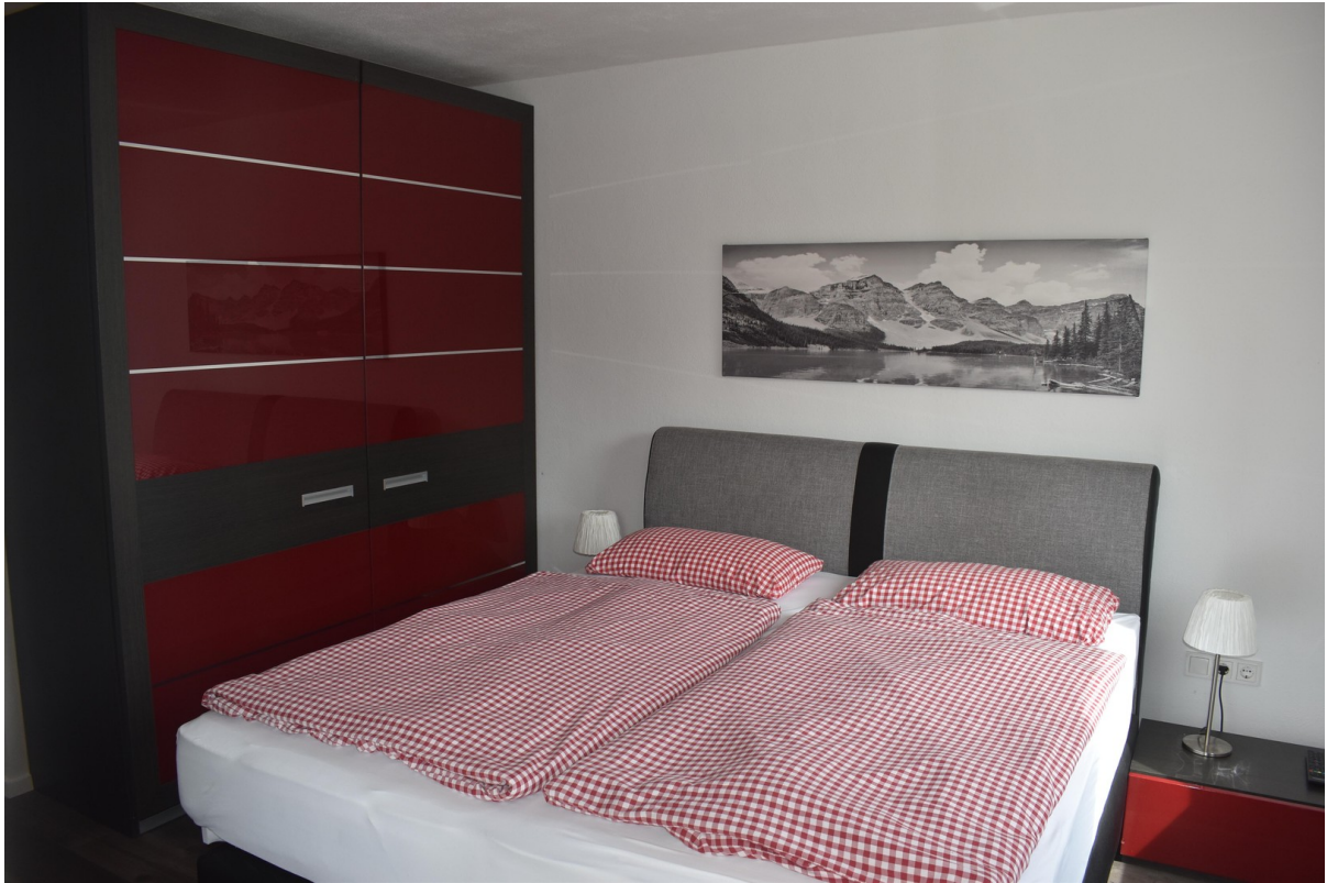
Schlafzimmer m. Schiebetüren.