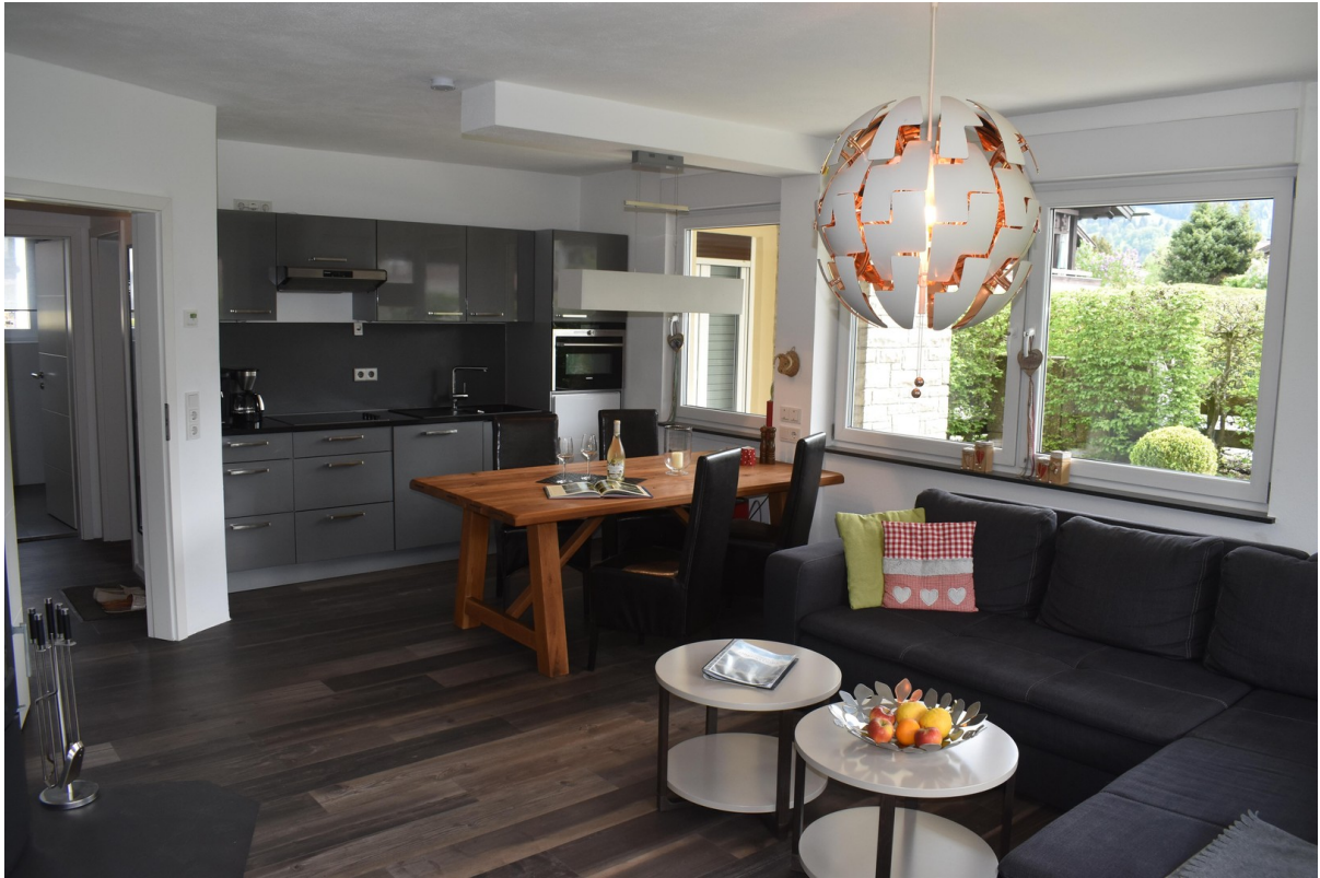
Wohnbereich m. Einbauküche