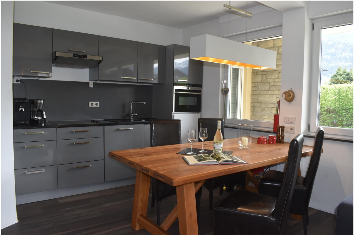
Esstisch mit Einbauküche