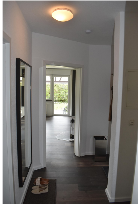
Eingangsbereich mit Blick WZ