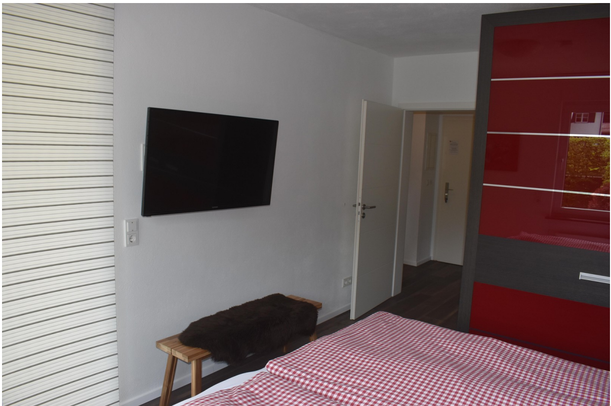
Fernseher im Schlafzimmer