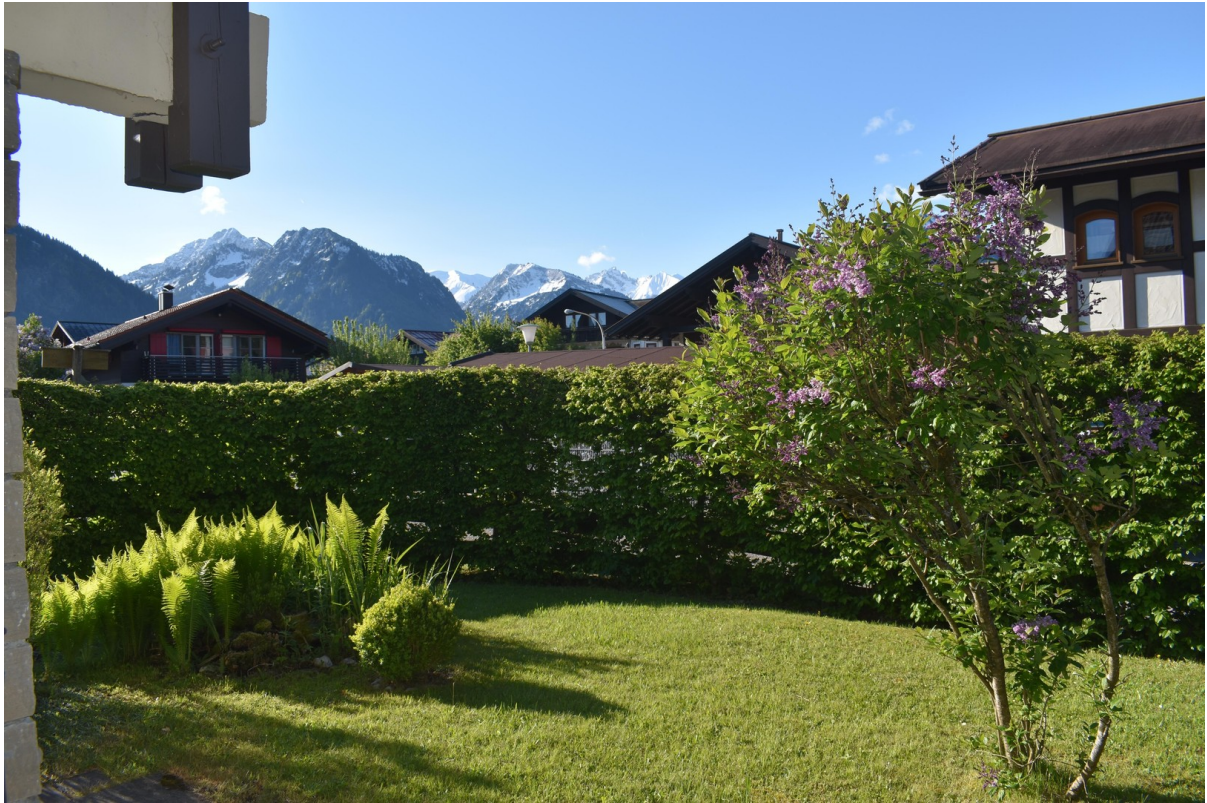
Großzüg. Terrasse m. Bergblick