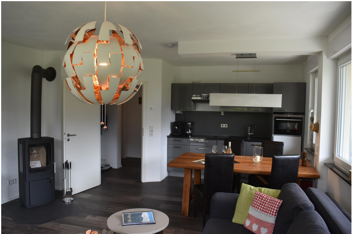
Wohnbereich m. Einbauküche