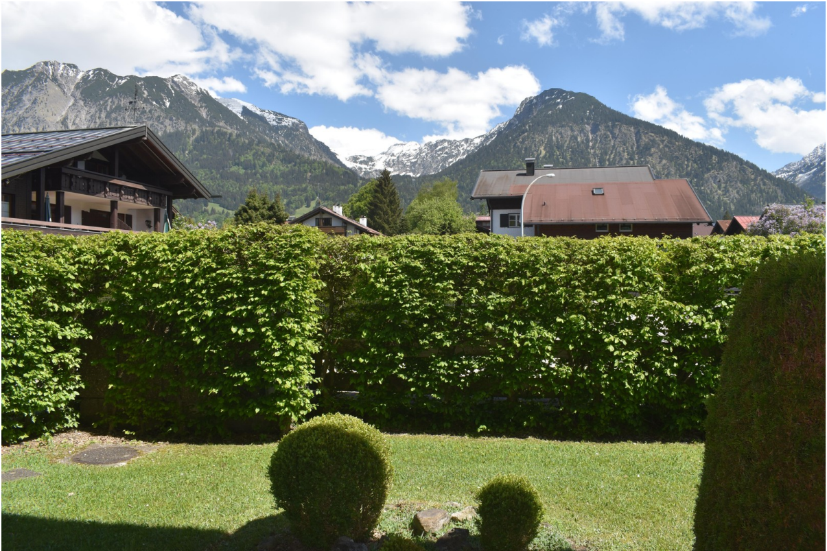
Großzüg. Terrasse m. Bergblick