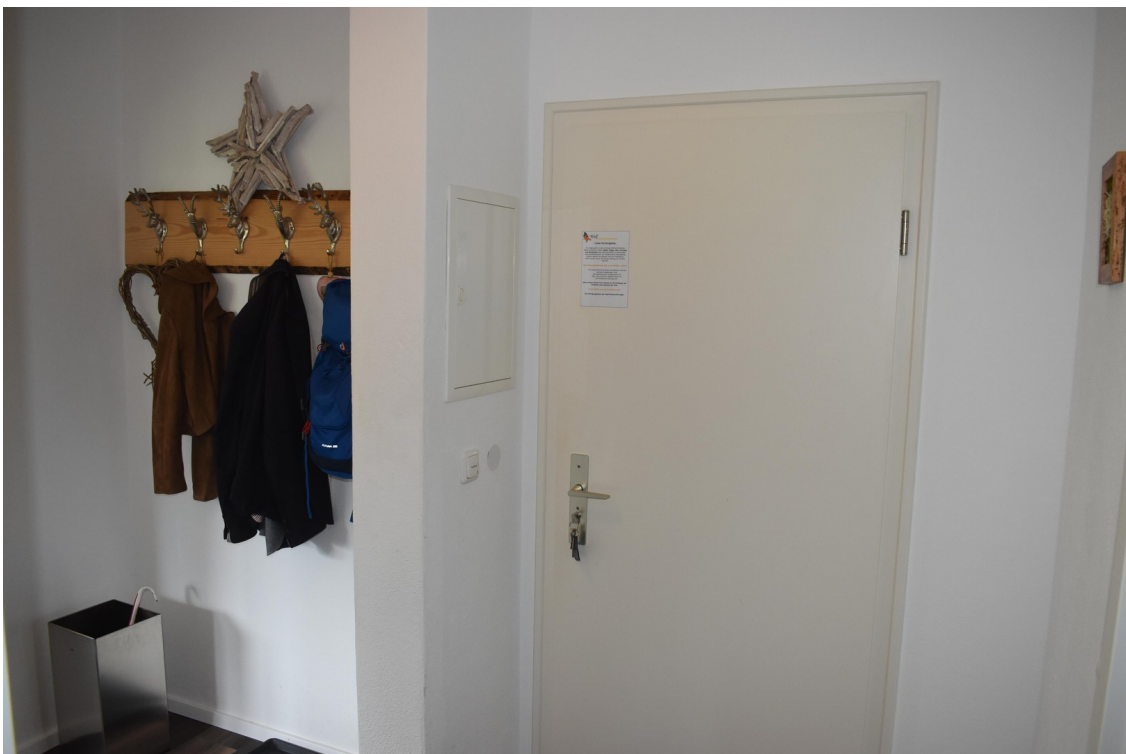
Eingangsbereich mit Garderobe