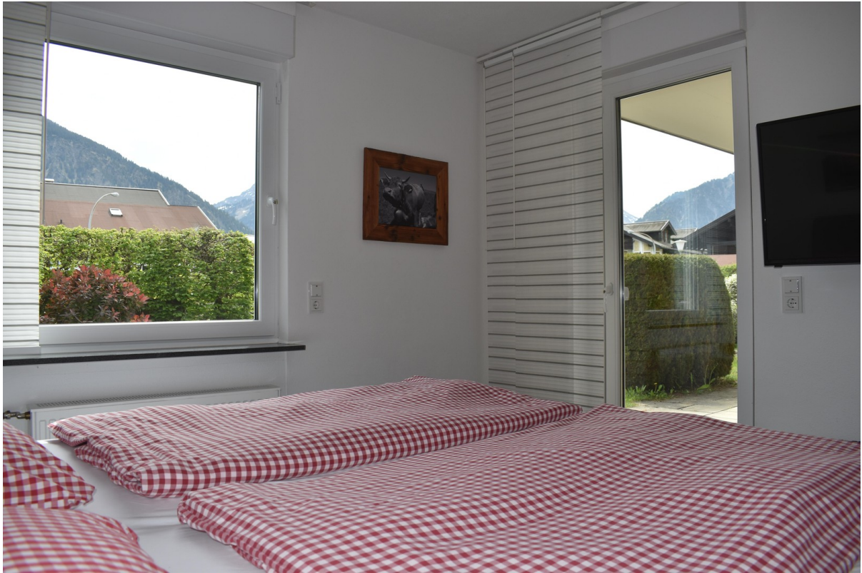
Blick vom Bett auf die Berge