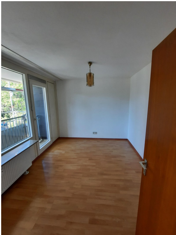
Schlaf- oder Kinderzimmer