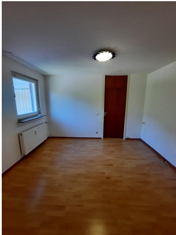
Kinder- oder Schlafzimmer