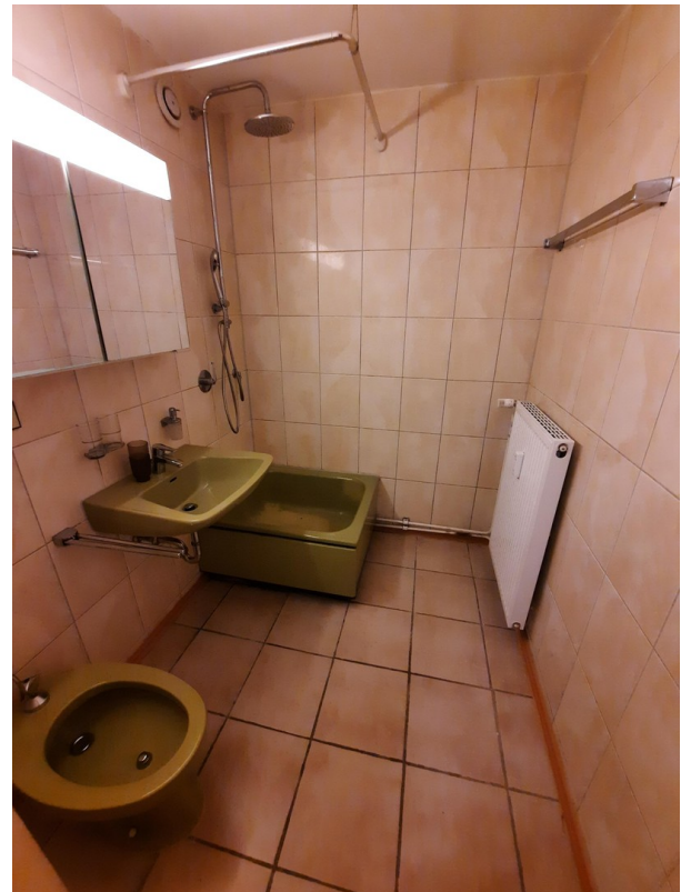
Nassbereich mit Bidet