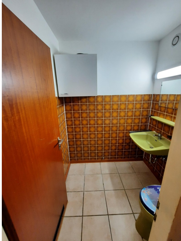
Nassbereich mit Waschma-Platz