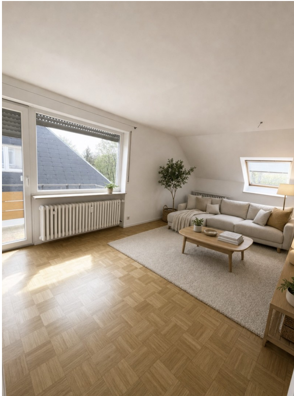
Zugang zu Balkon