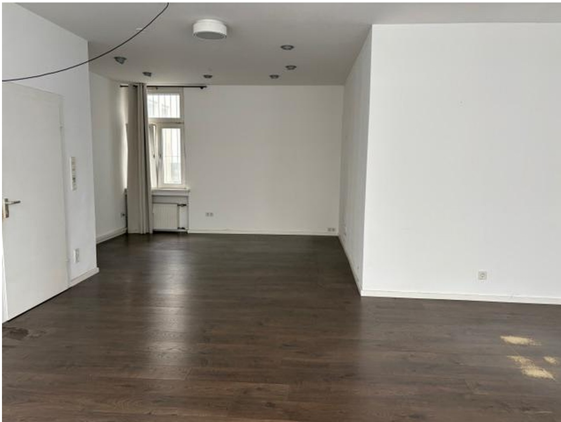
Blick vom Eingang