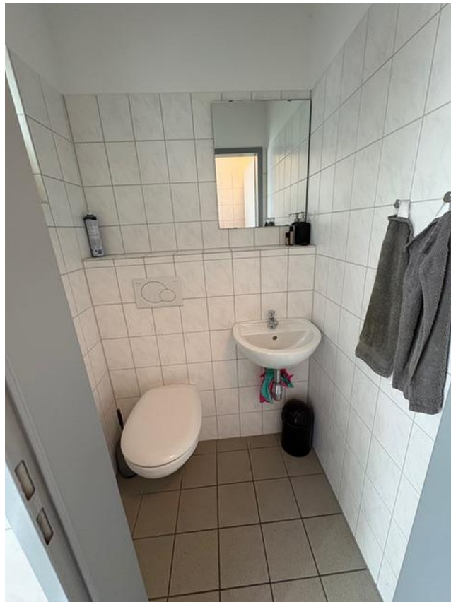
Toilette im Hinterhaus