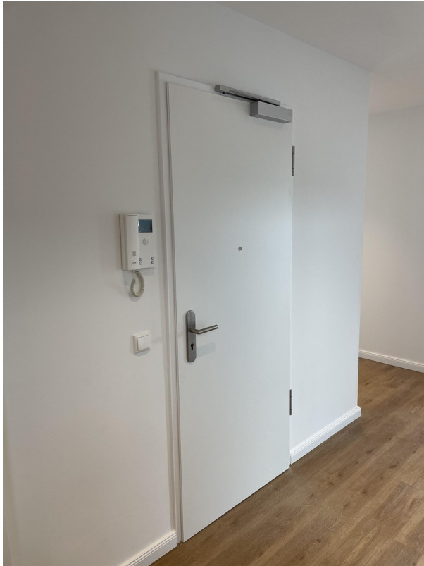
Mietungstür und Videosprechst.