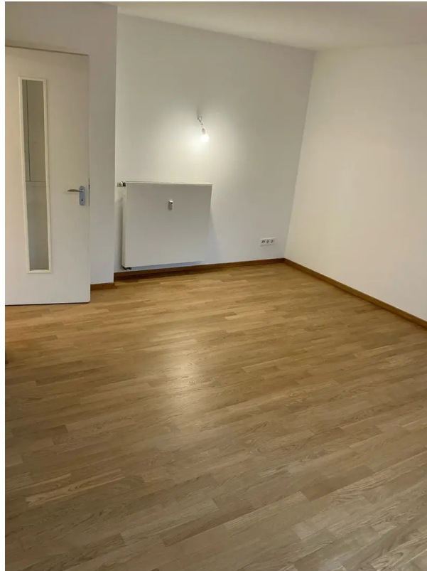
Wohnzimmer Blick vom Balko