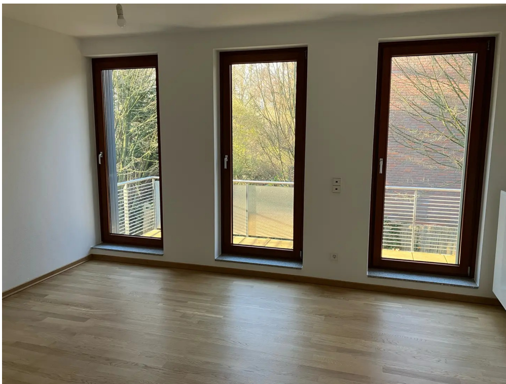
Wohnzimmer Blick zum Balko