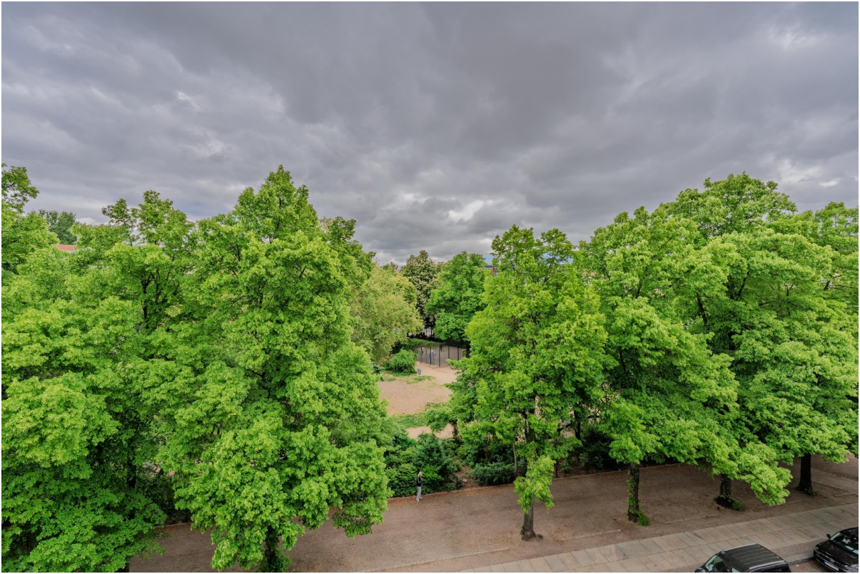
Ausblick aus dem Wintergarten