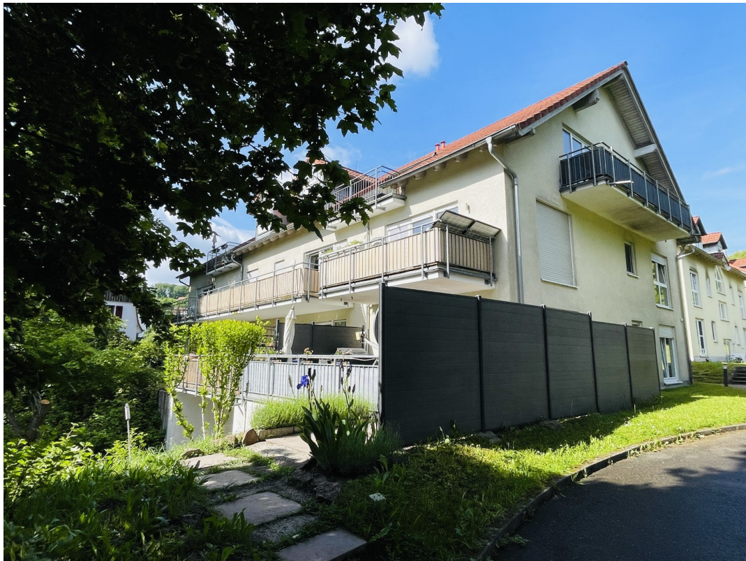
Hier möchte man gerne wohnen