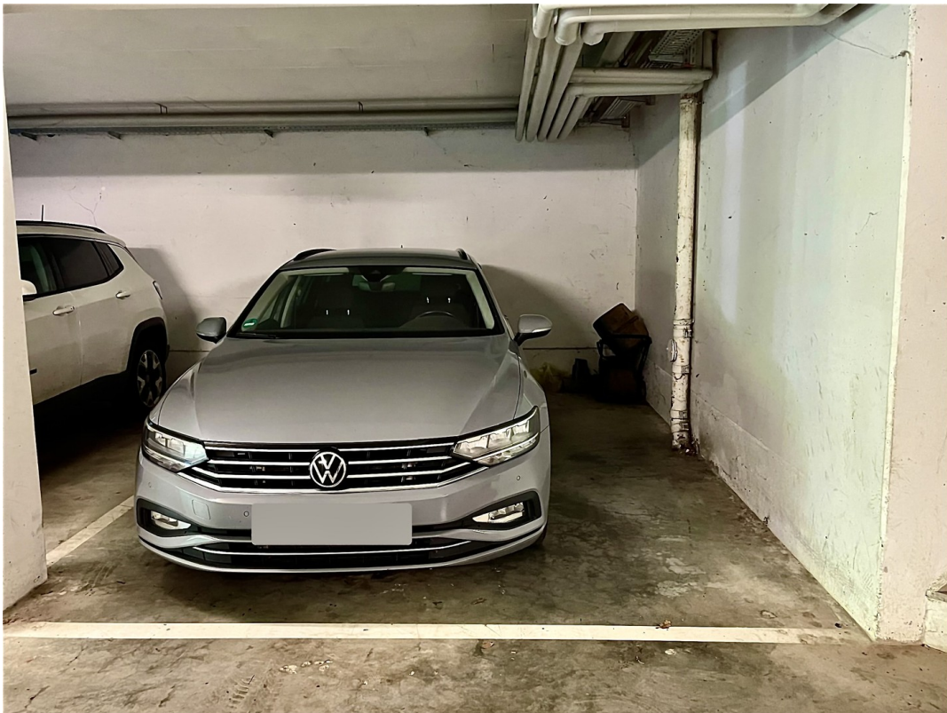
Garagenplatz mit Stauraum