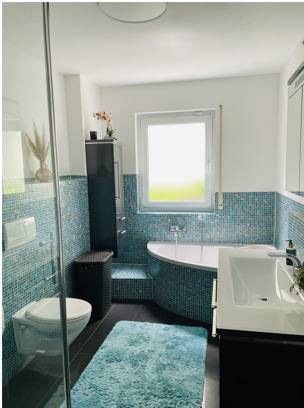
Modernes Bad mit Fenster