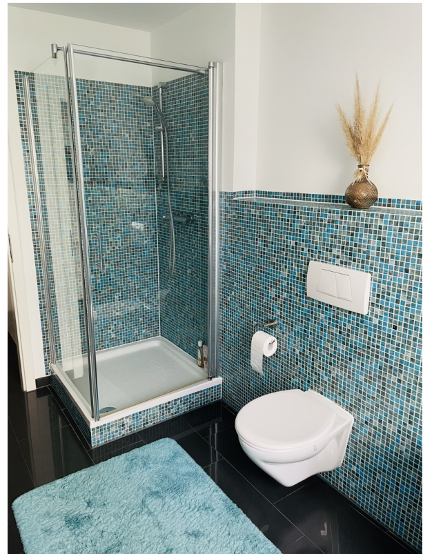
Modernes Bad mit Dusche