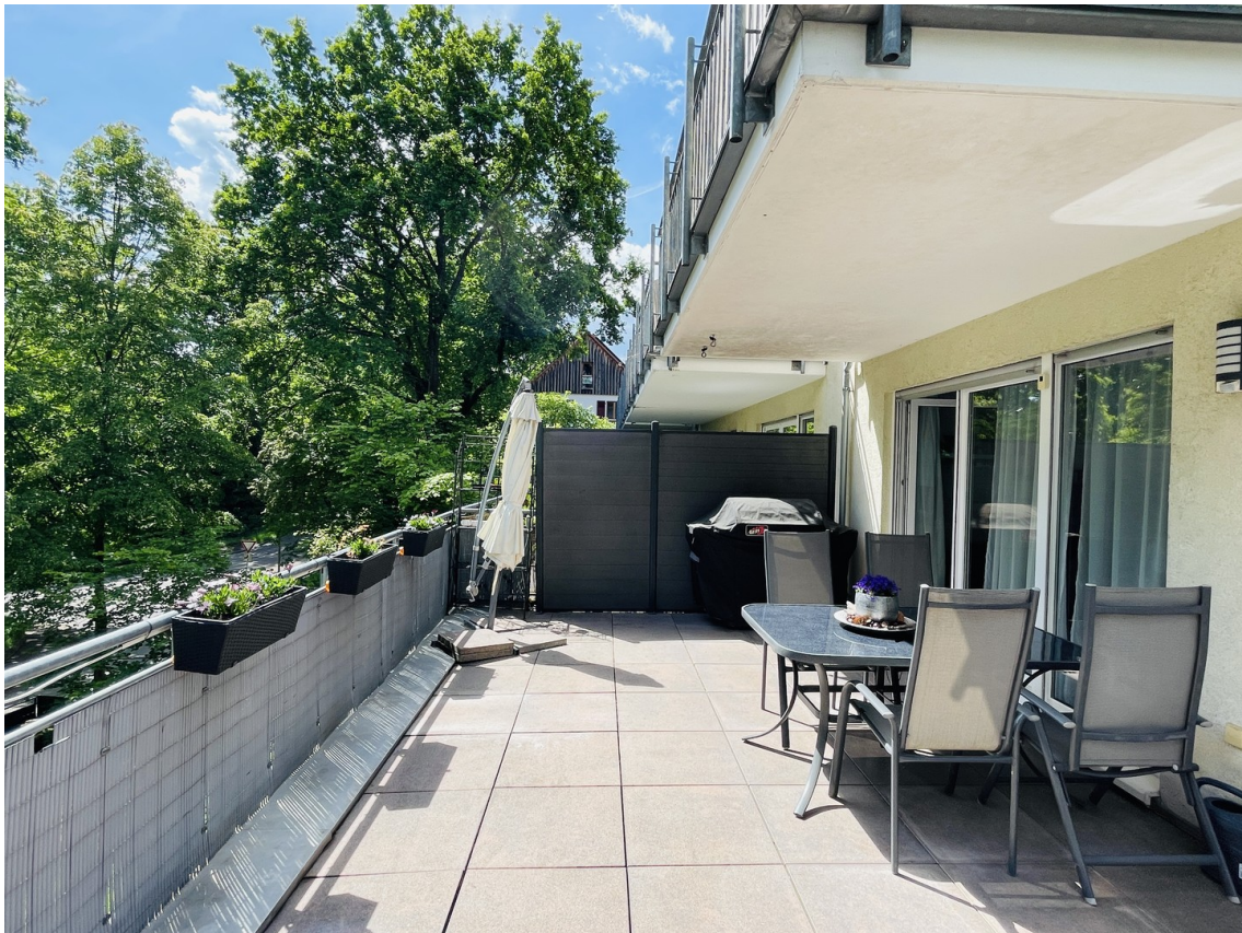
Große, teilüberdachte Terrasse