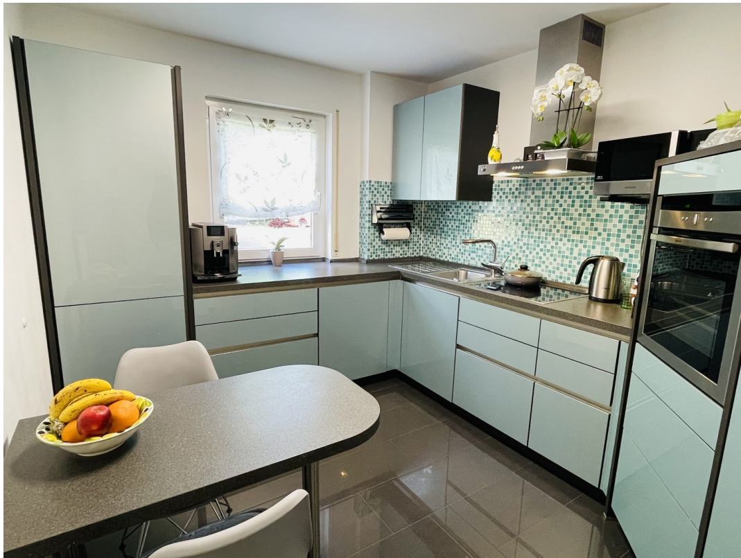
Hier macht Kochen Spaß