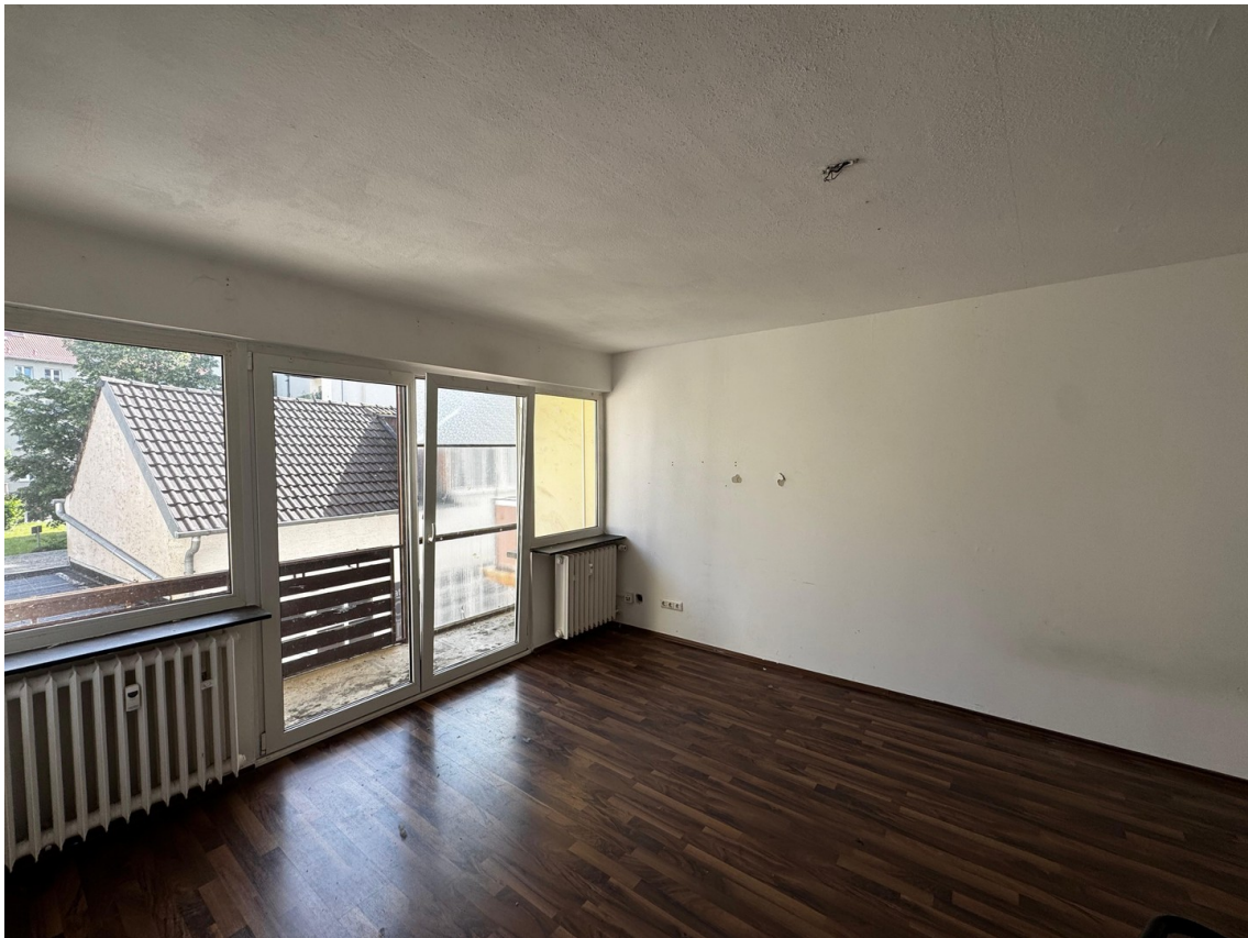
Wohn/ Schlafzimmer 2