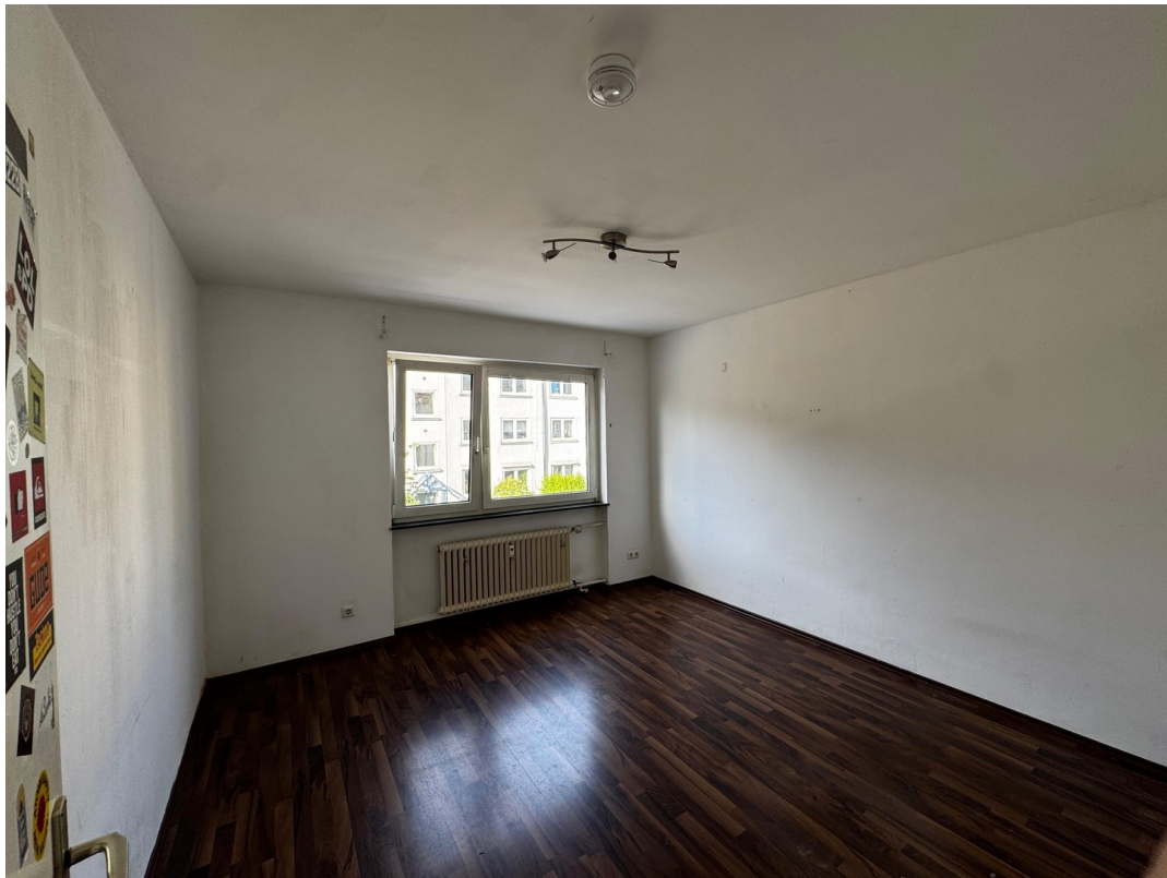
Wohn/ Schlafzimmer 3