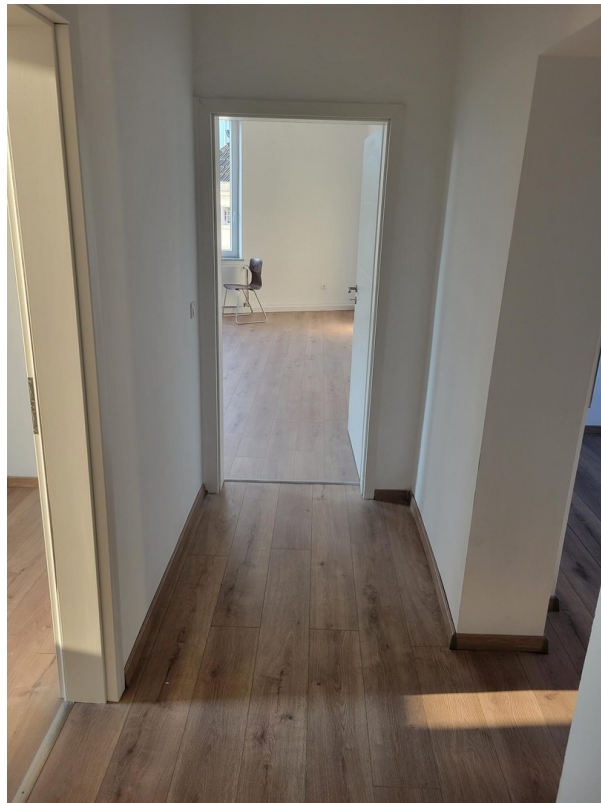
Flur / Eingang