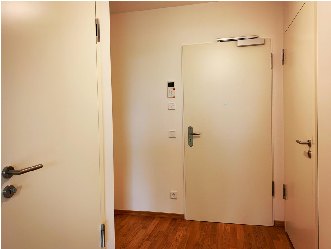
Flur / Tür Abstellkammer