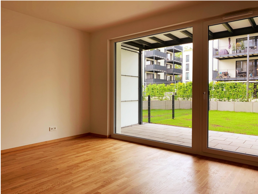
Zimmer mit großer Glasfront