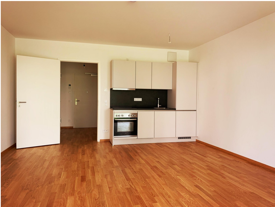
Blick vom Fenster aus