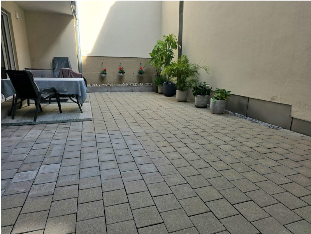
Innenhof zur Alleinnutzung