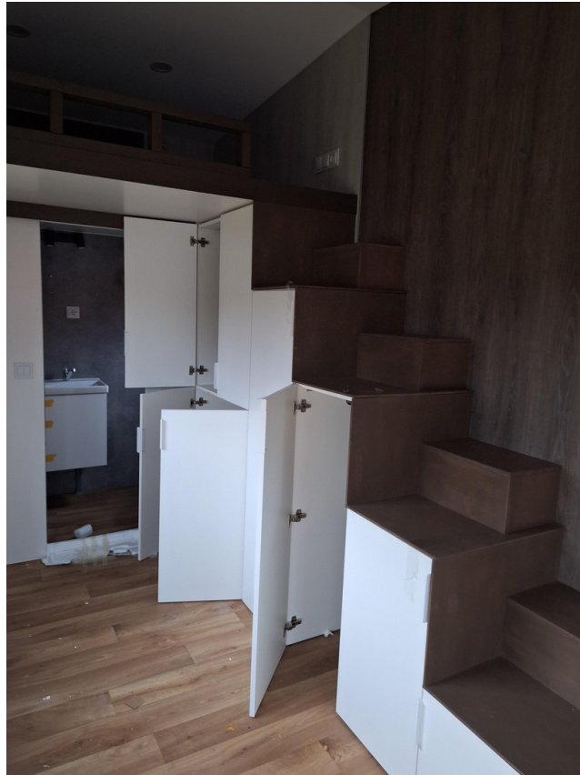
Schränke unter der Treppe