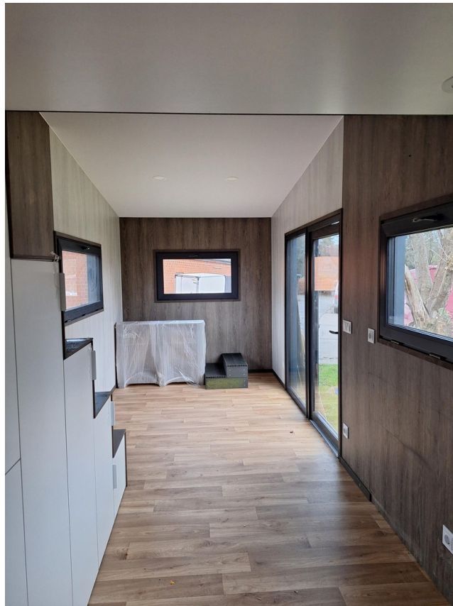
Wohnraum noch ohne Küche