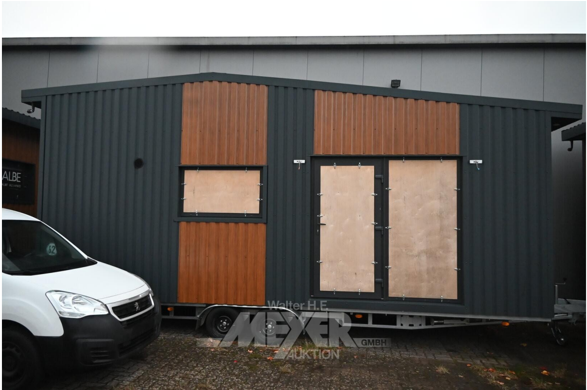
Außenansicht Stufen gibt es