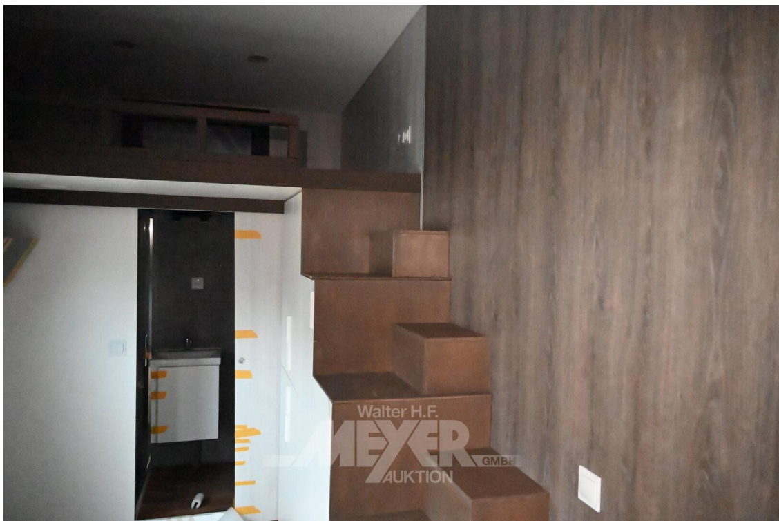
Treppe zum Loft