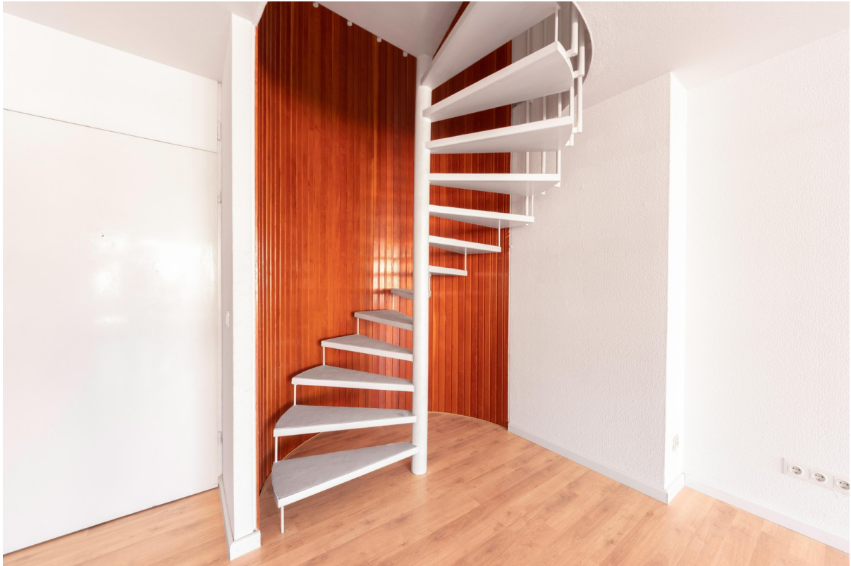
Wendeltreppe ins Obergeschoss