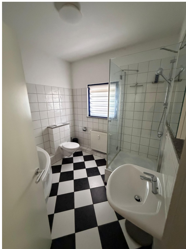
Badezimmer en suite