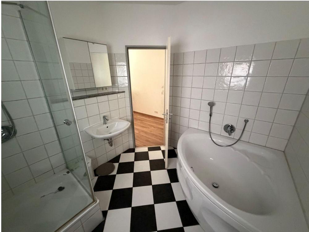
Badezimmer en suite