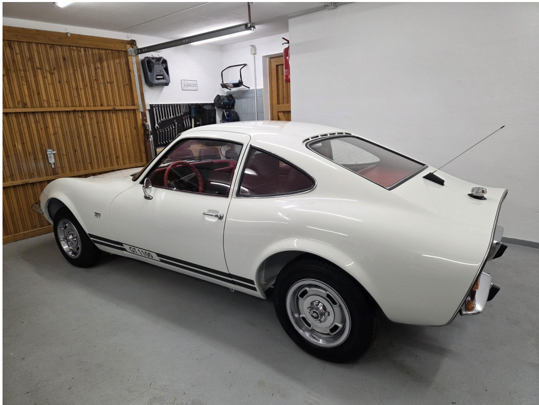
Garage Innen 1