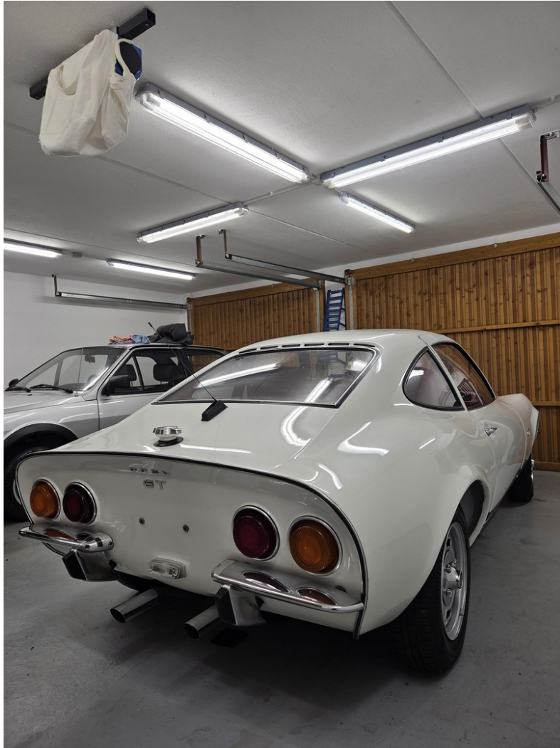
Garage Innen 2