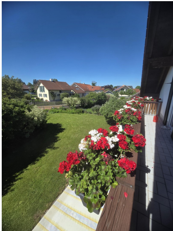
Blick vom Balkon SüdWest