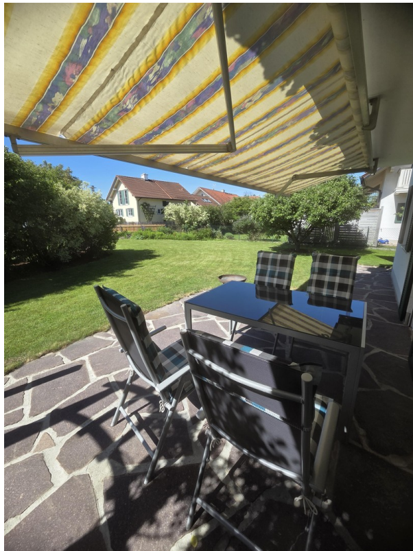
Terasse SüdWest Blick