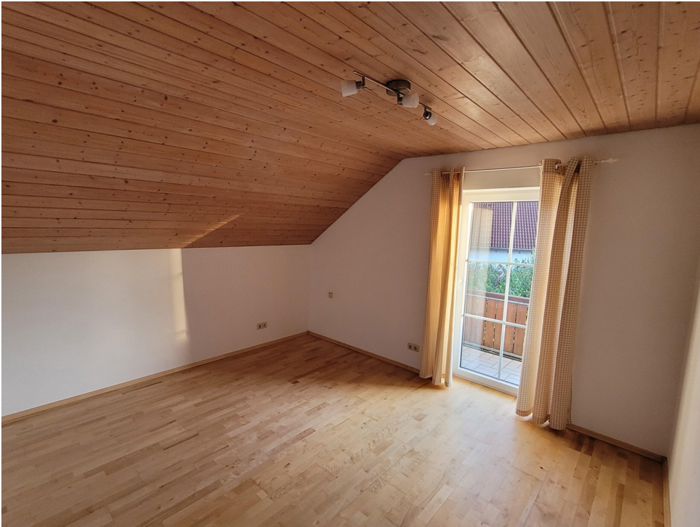
Kinderzimmer 1 Süd