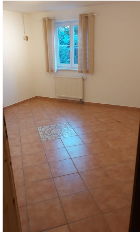
Musikzimmer Keller links