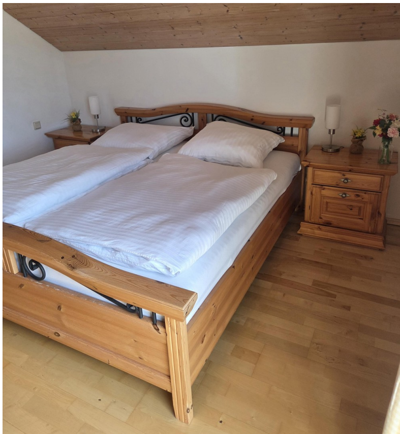
Kinderzimmer 1 Bett