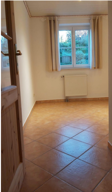
Büro Keller Mitte