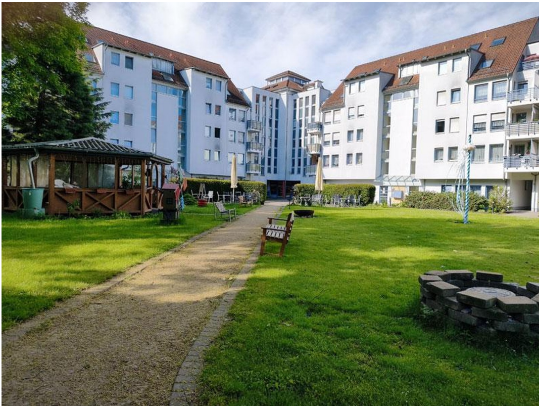
Park der Wohnanlage