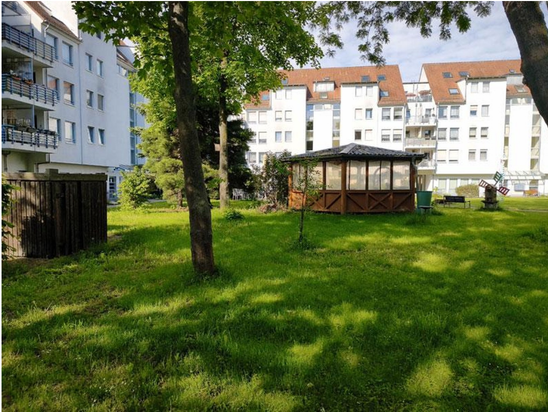
Park der Wohnanlage