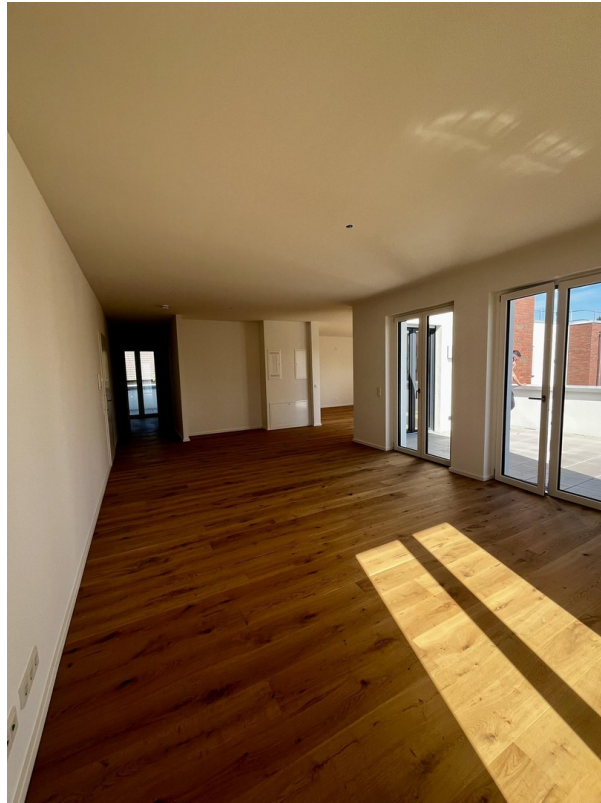
Wohnzimmer & Küche