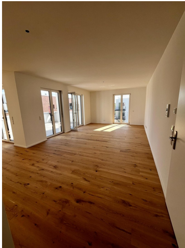
Wohnzimmer & Küche