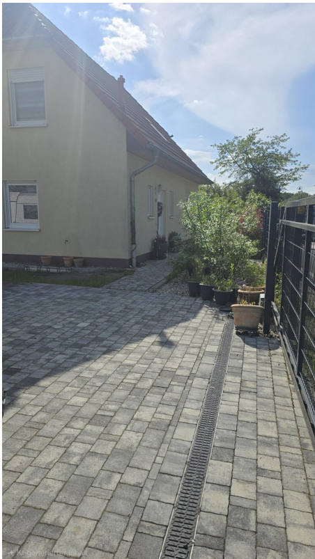
Zuwegung zur Haustür