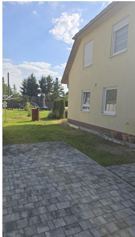
Blick vorn in den Garten