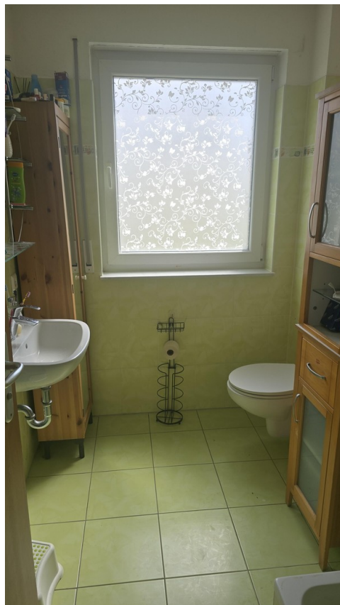
Gäste Duschbad unten