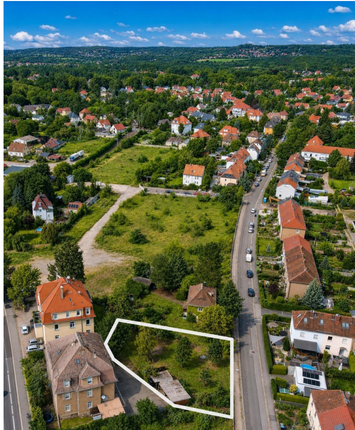
Baugrundstück | Luftbild