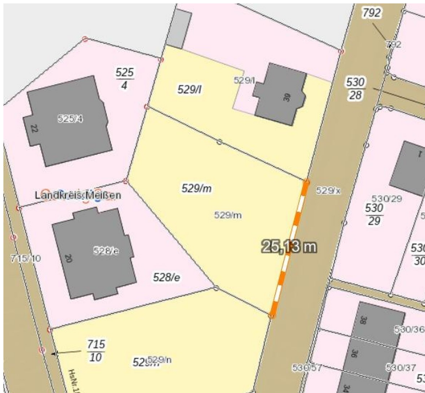
25 m Straßenfront