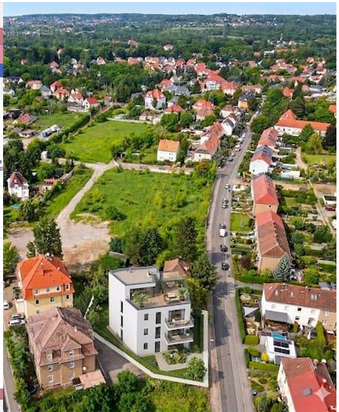
Beispielvisualisierung 3 VG+DG