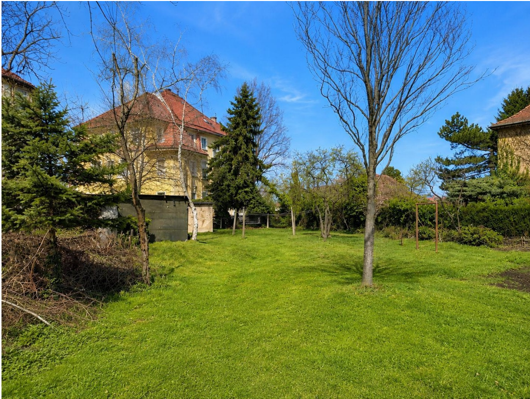
Baugrundstück | Hinterer Teil