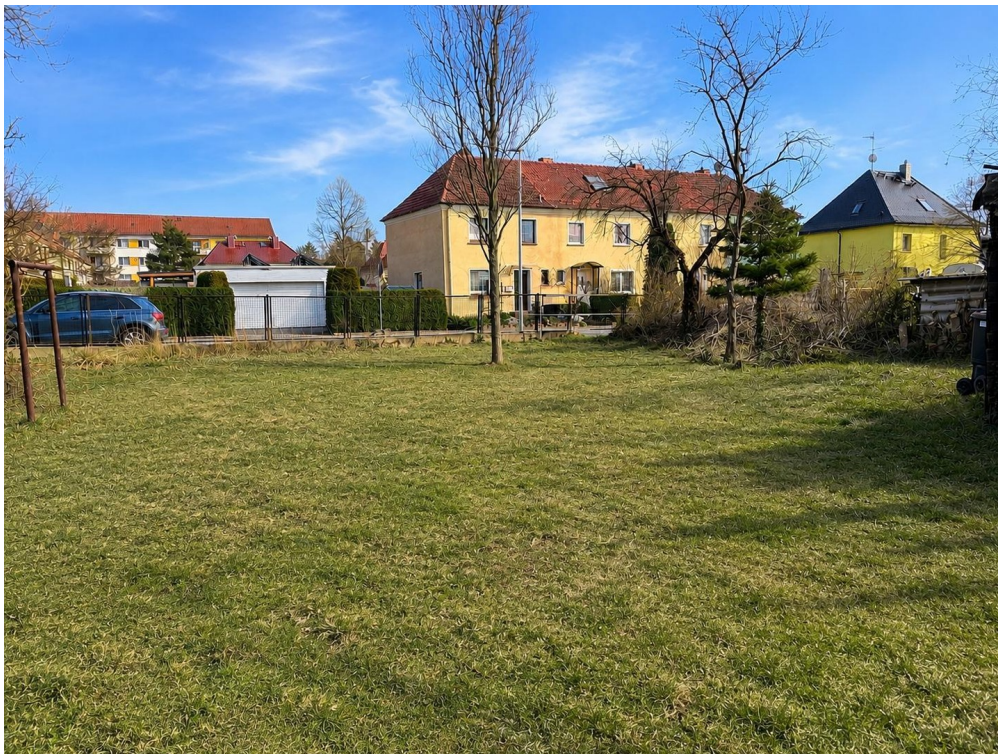
Baugrundstück | Vorderer Teil