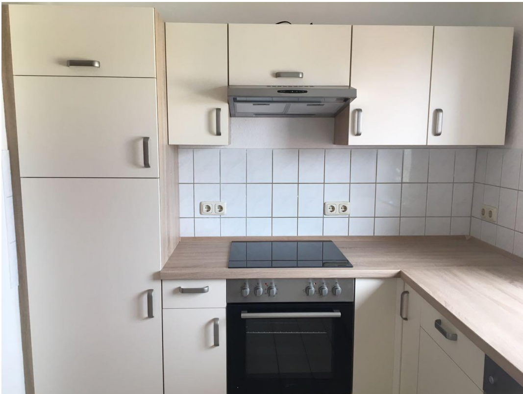
Küche WE DG Rechts