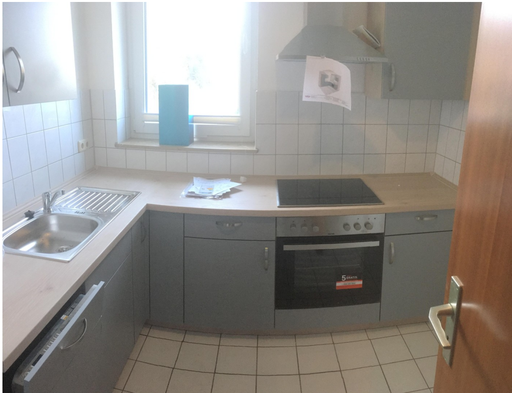
Küche WE EG Mitte