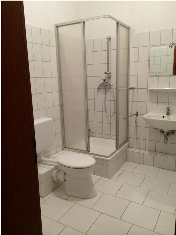
Bad WE EG Mitte