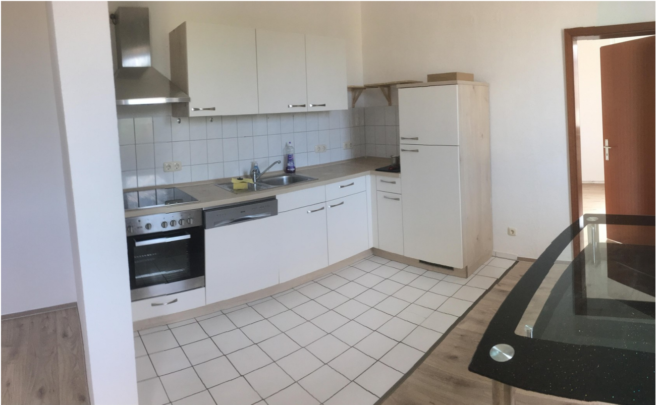
Küche WE 1.OG Hinten