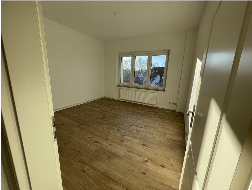
Wohnzimmer WE 1.OG Rechts