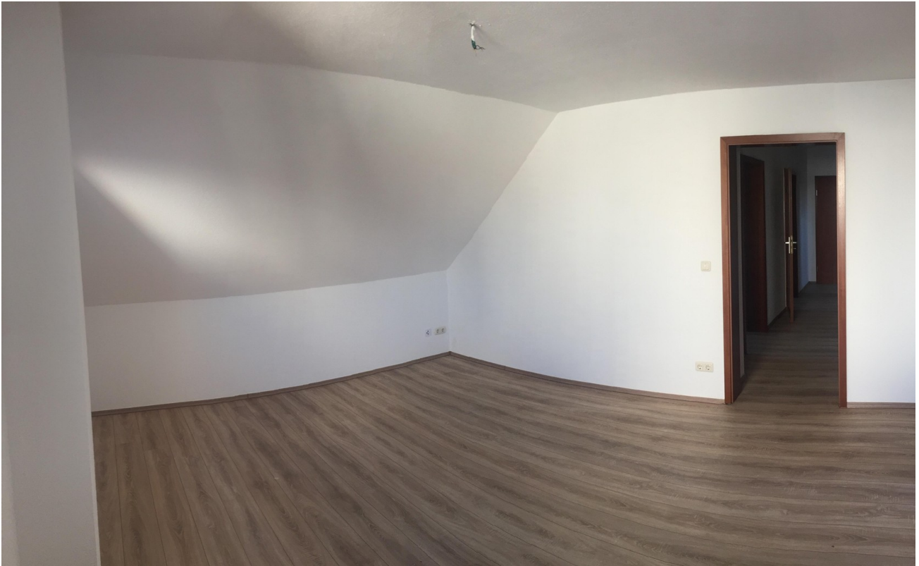
Wohnzimmer WE DG Links