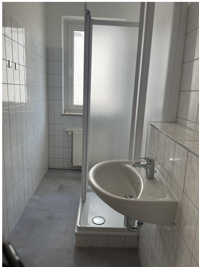
Bad WE 1.OG Vorne