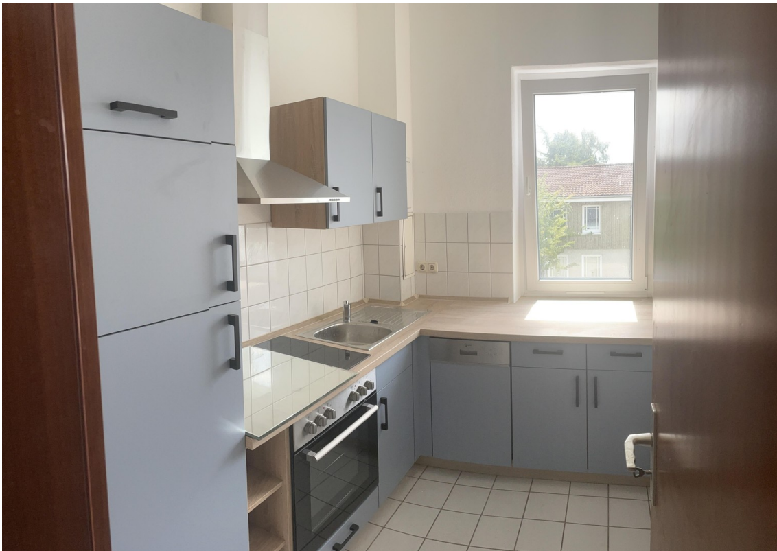
Küche WE 1.OG Vorne