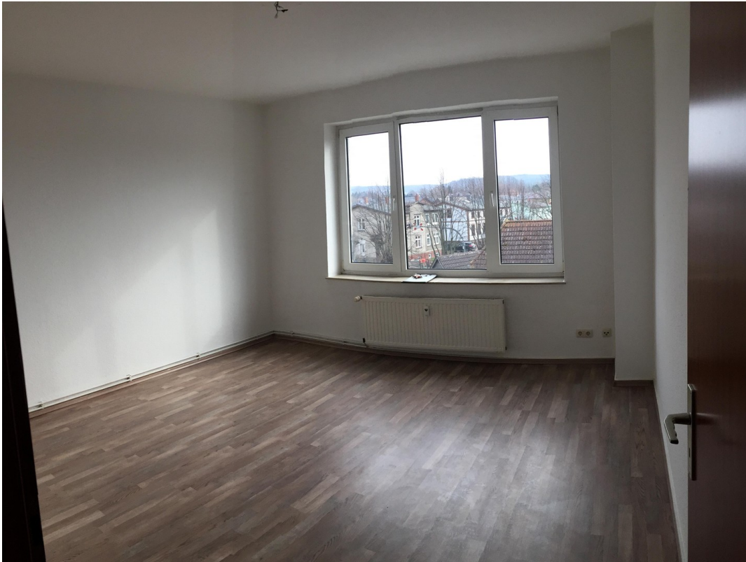
Wohnzimmer WE DG Rechts