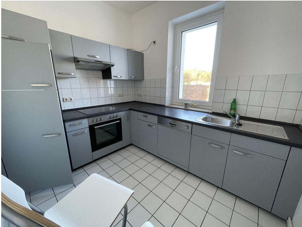
Küche WE 1.OG Rechts