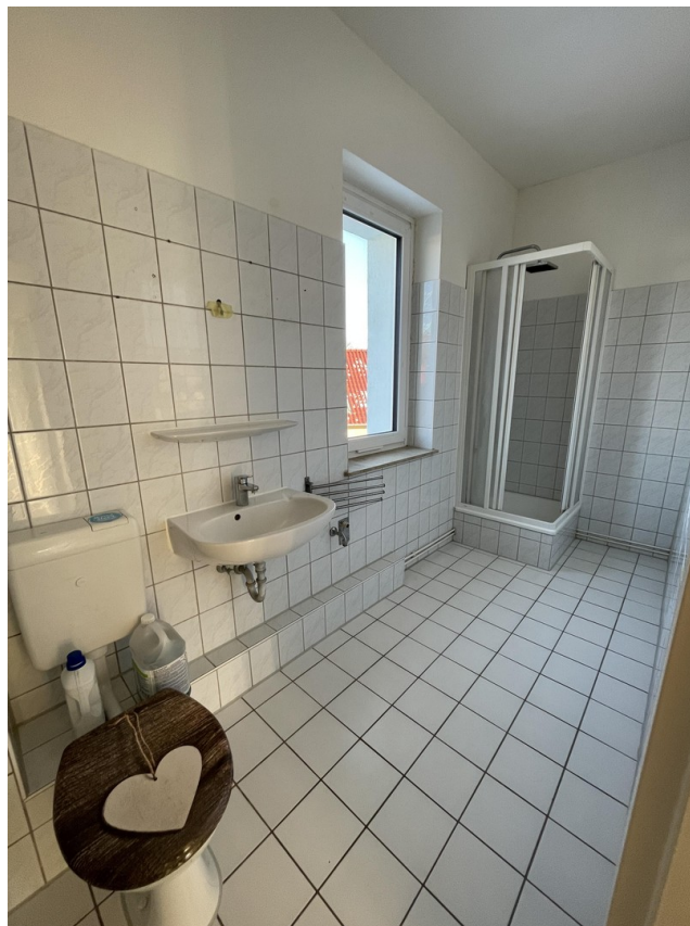
Bad WE 1.OG Rechts