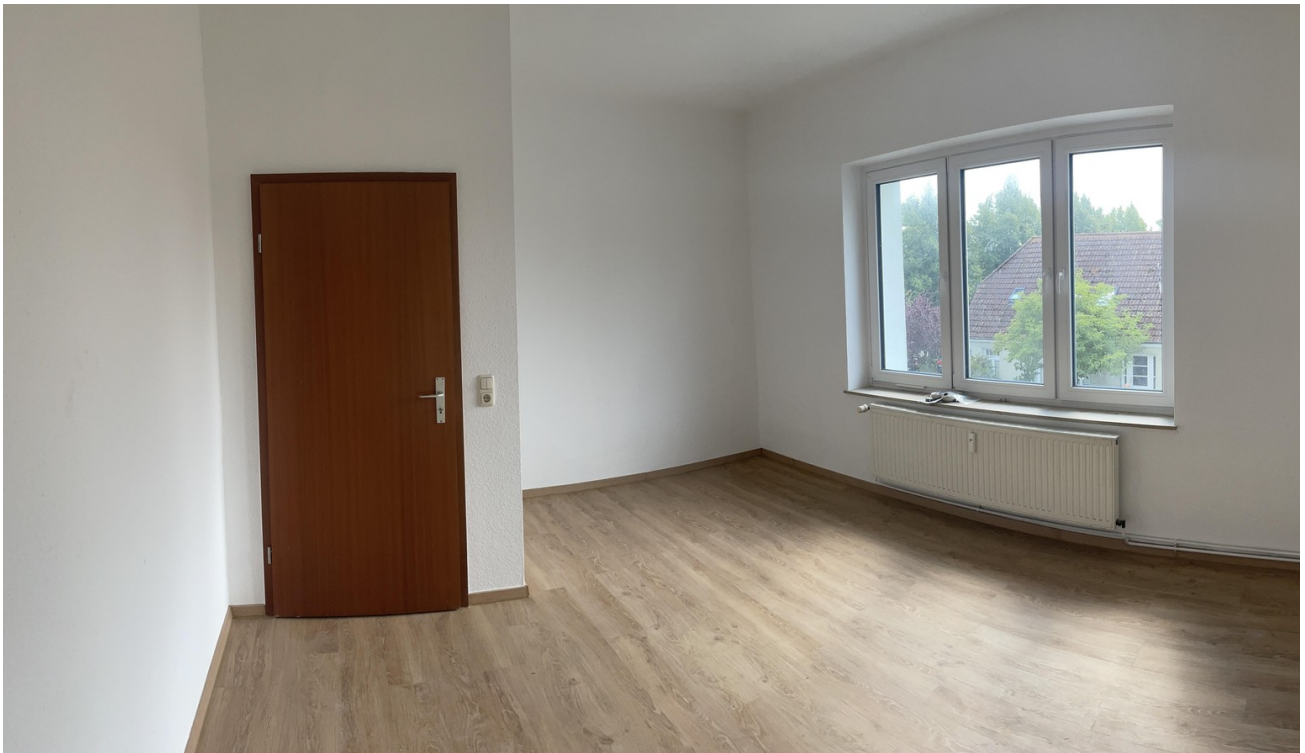
Zimmer WE 1.OG Vorne