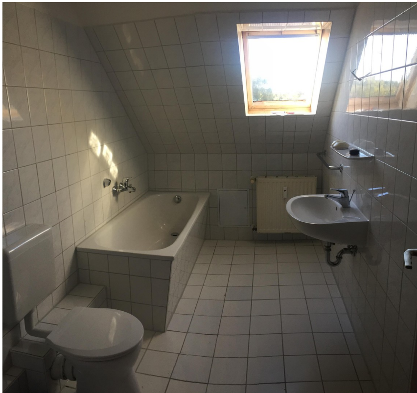
Bad WE DG Links