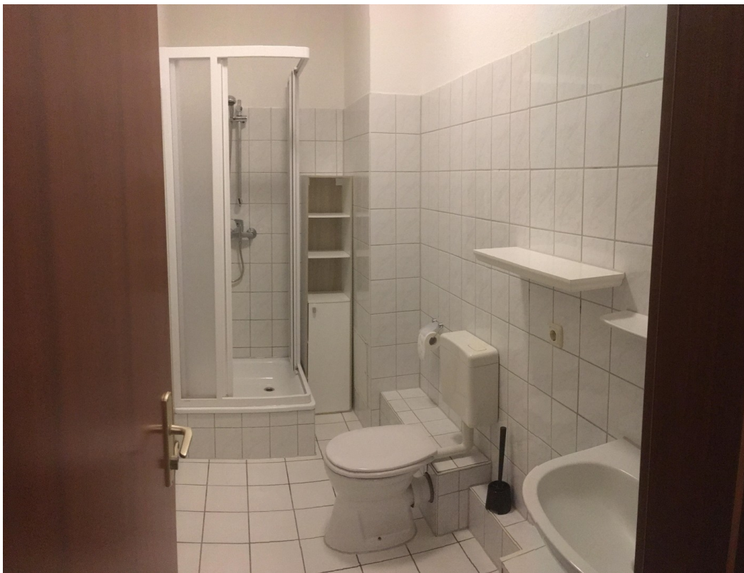
Bad WE 1.OG Hinten