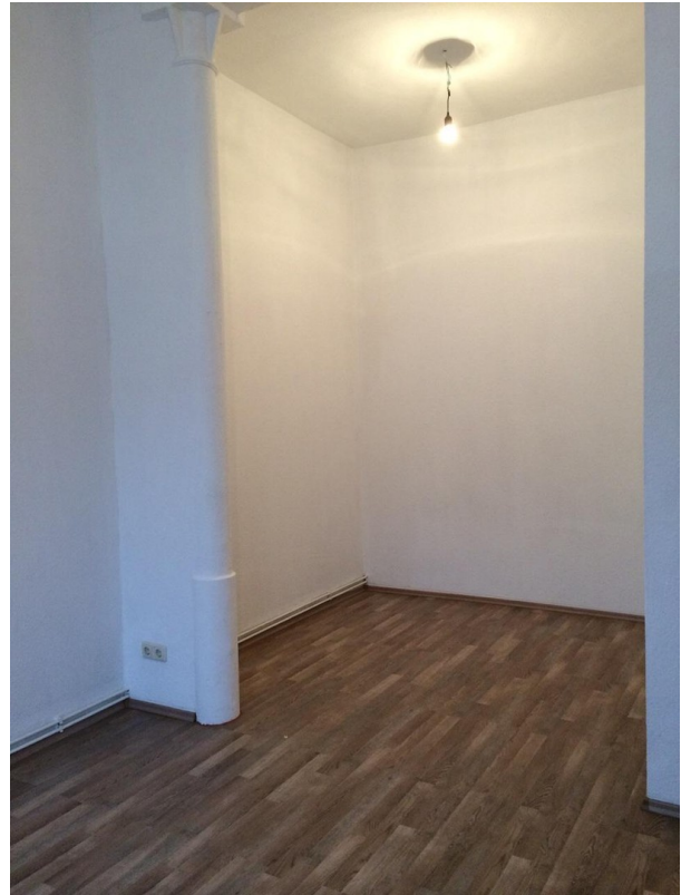
Zimmer WE EG Mitte