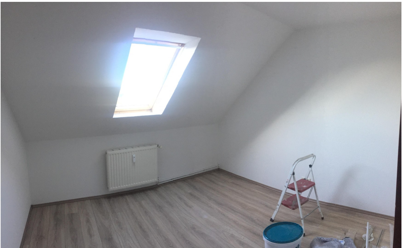
Zimmer WE DG Links