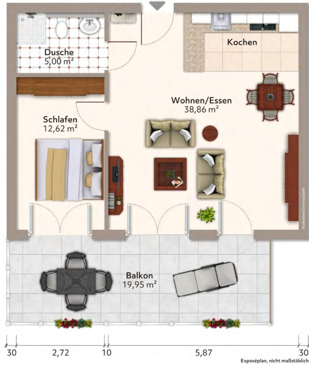
1. Obergeschoss - Wohnung 17