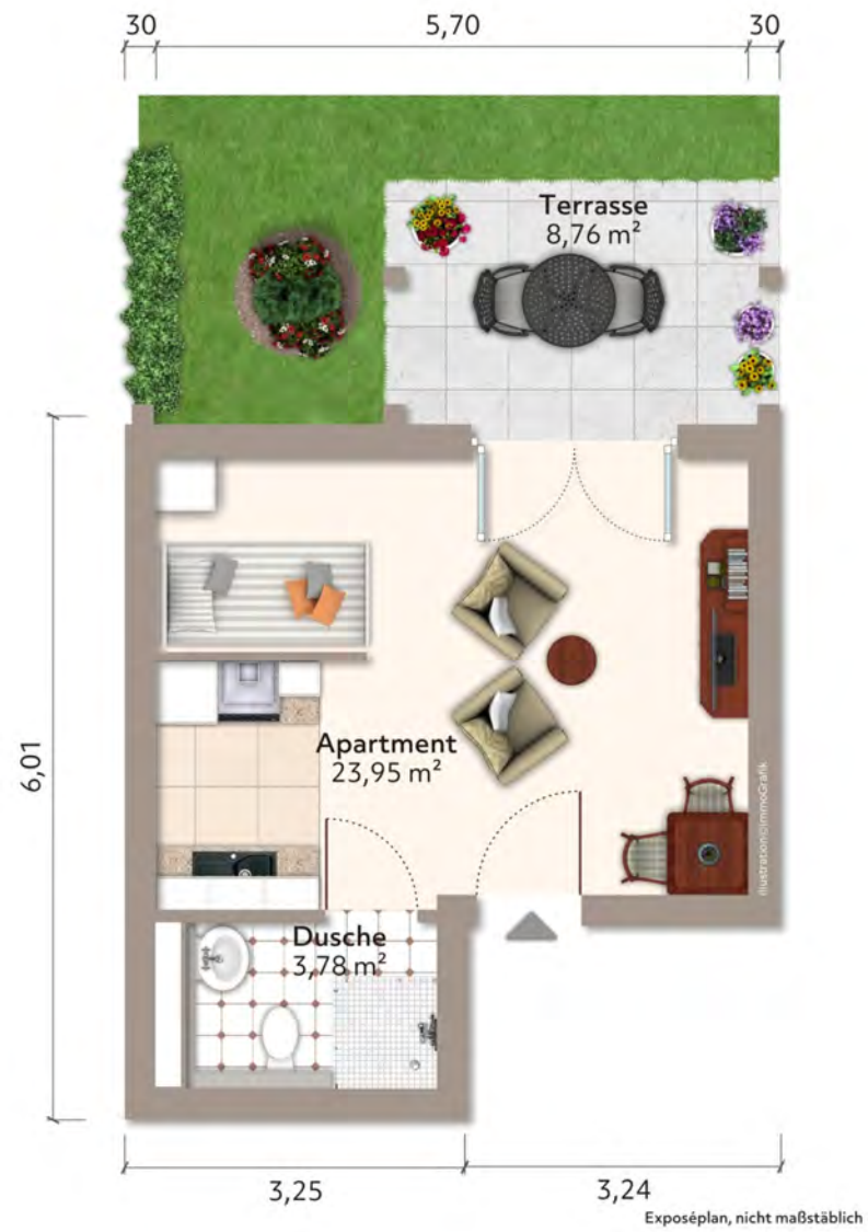
Erdgeschoss - Wohnung 02