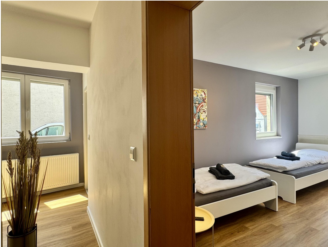
FLUR / ROOM1