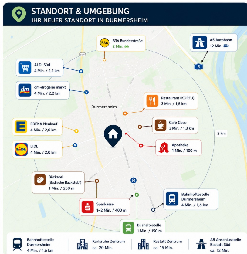
Standort & Umgebung