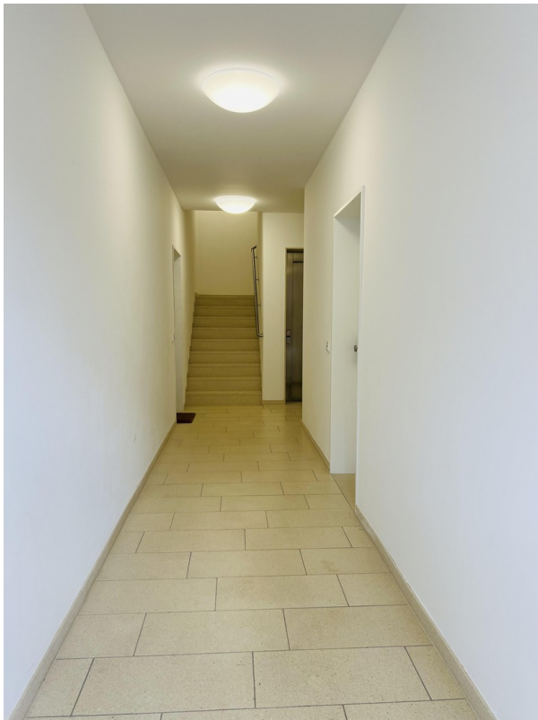
Innenbereich des Wohnblocks