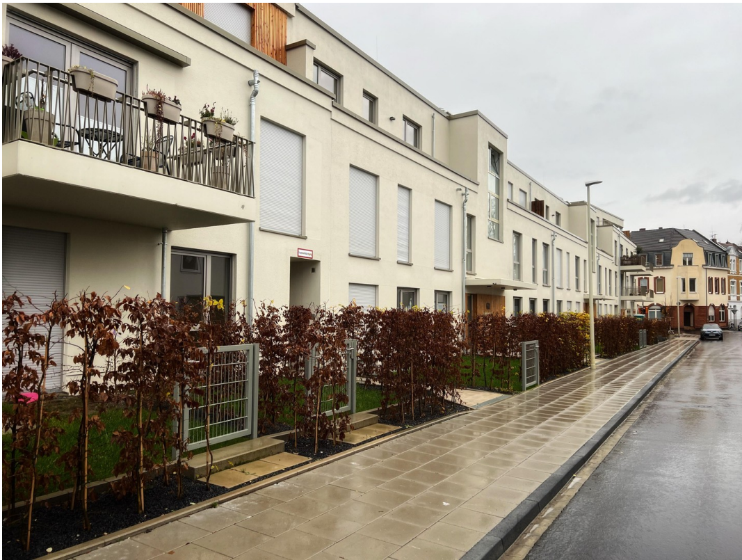
Außenbereich der Wohnung