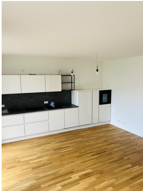
Offene Küche mit Wohnzimmer