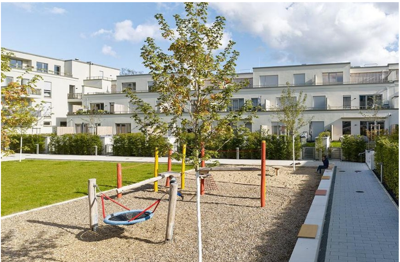
Innenbereich der Wohnung und K