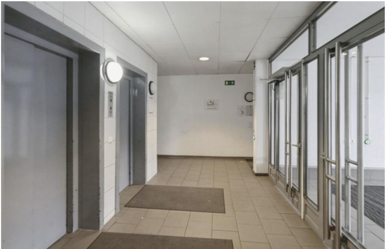
Eingangsbereich mit Aufzügen