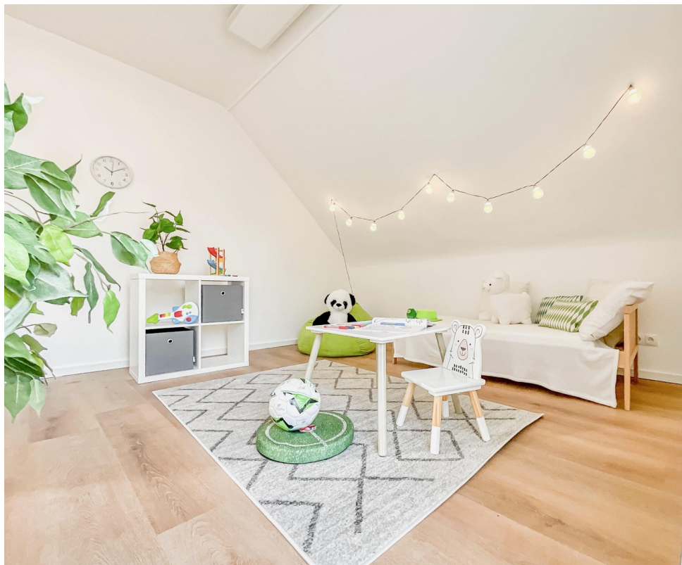
Zimmer 2 OG