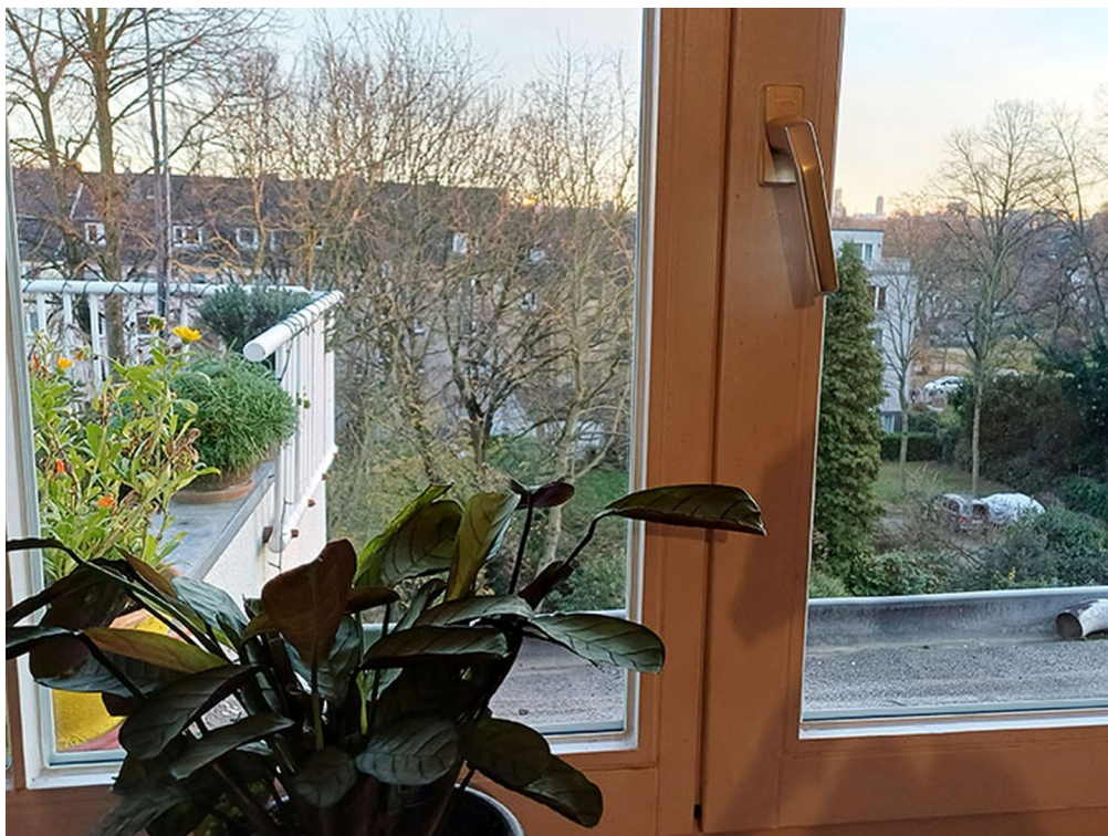
Ausblick Zimmer 3