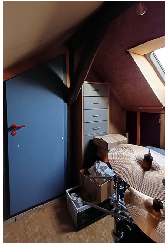
Kammer 2 Galeriegeschoss