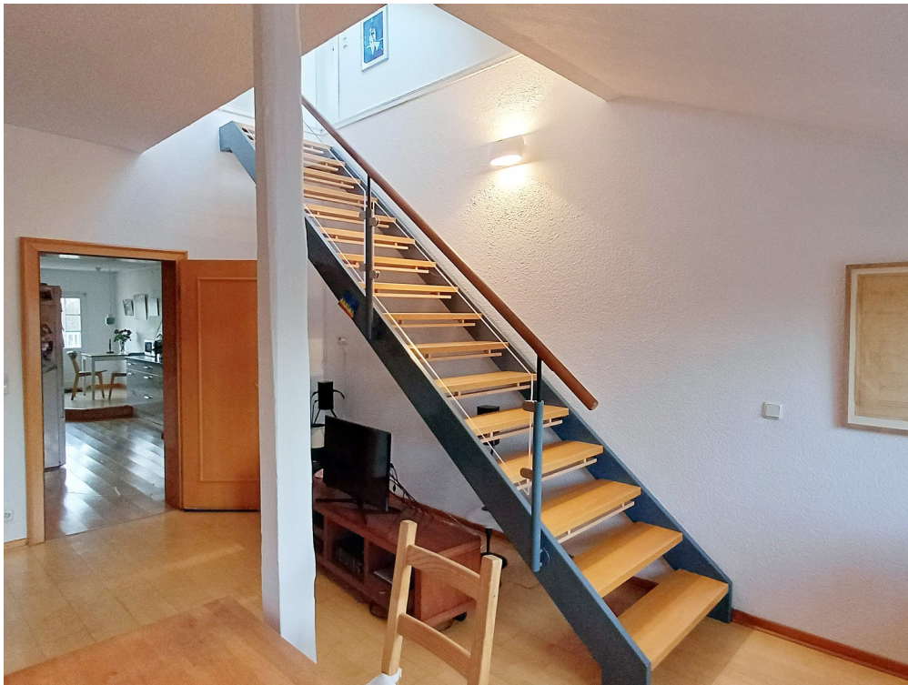
Treppe zum Galeriegeschoss