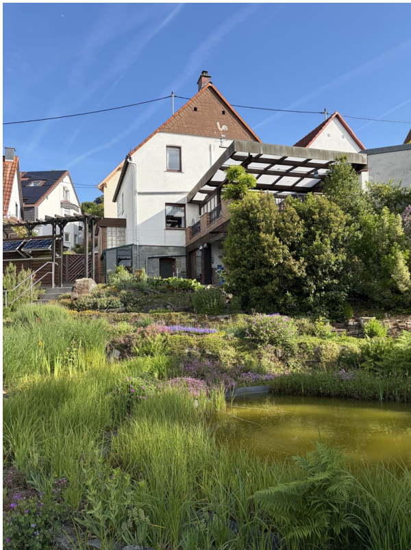
Haus mit Teich