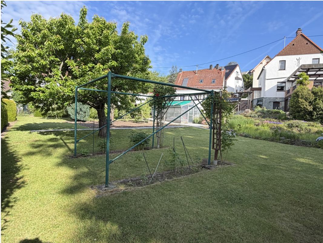
Garten mit Baumbestand