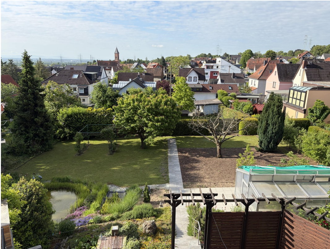
Blick aus dem Dachgeschoss