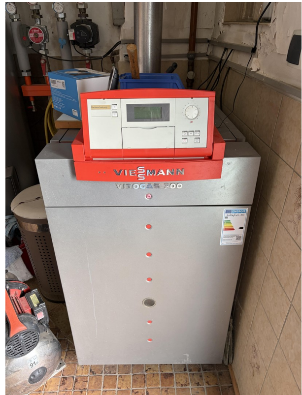
Gasheizung Baujahr 2001