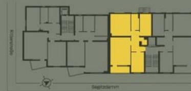
Grundriss WE 11