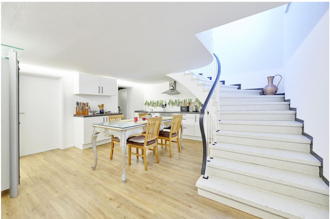
Küche mit Treppenabgang