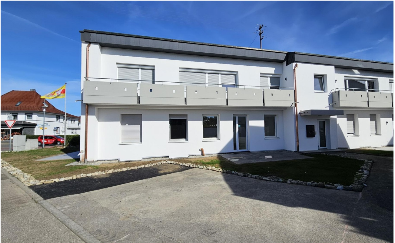
Parkplätze vor dem Haus