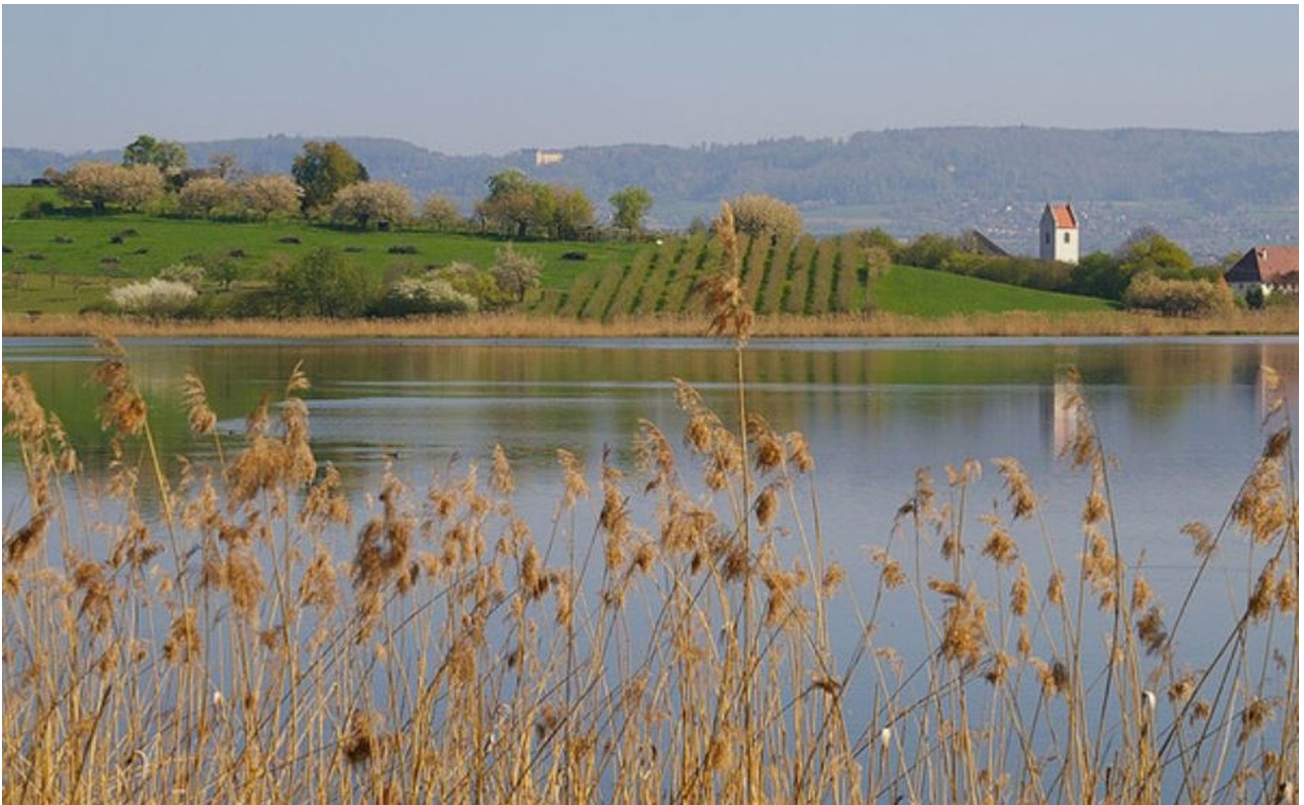
Umgebung von Salem