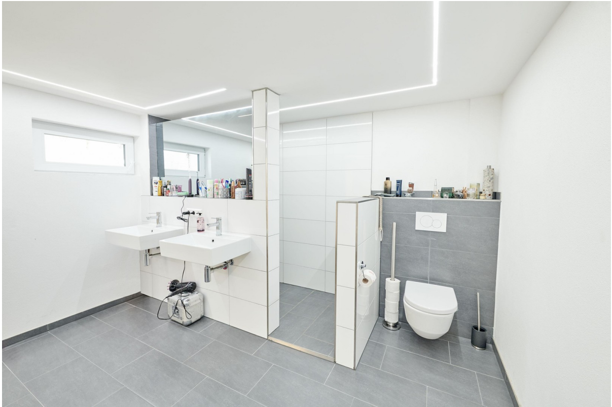
WC und Waschbecken