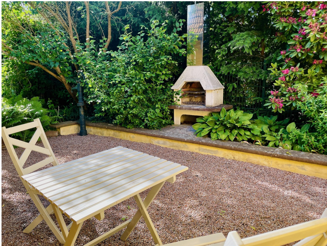
Grillecke mit Außenkamin