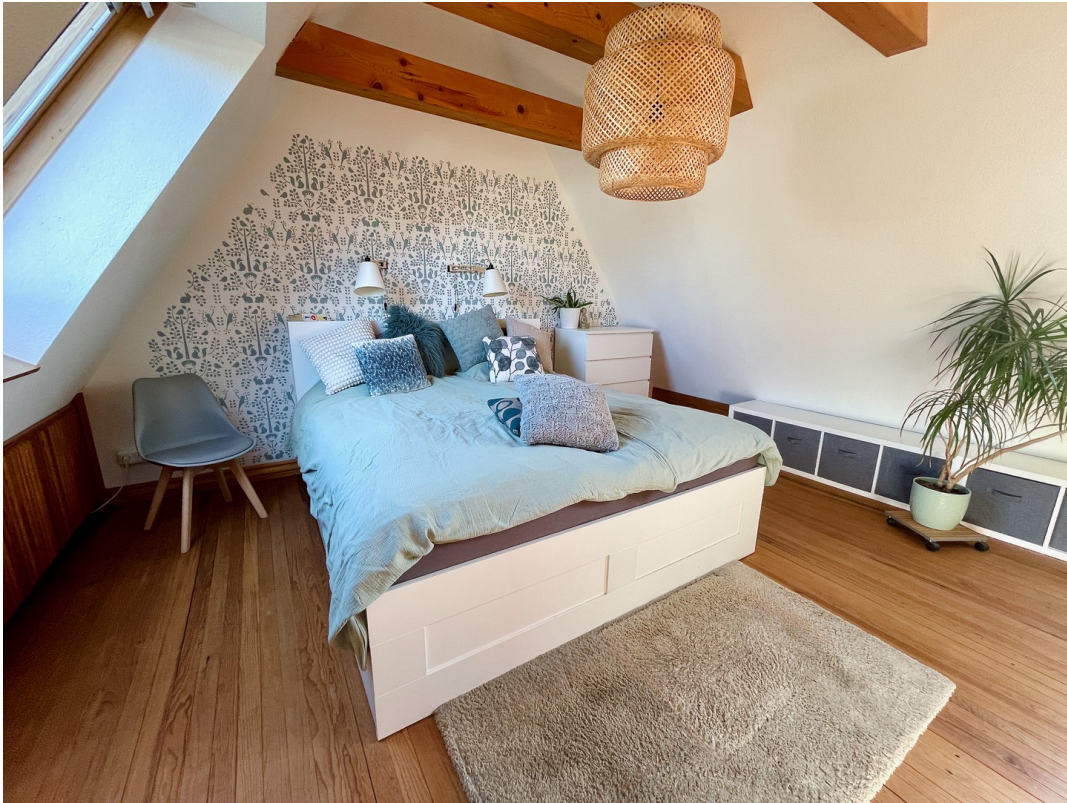
Schlafzimmer m. offenem Giebel