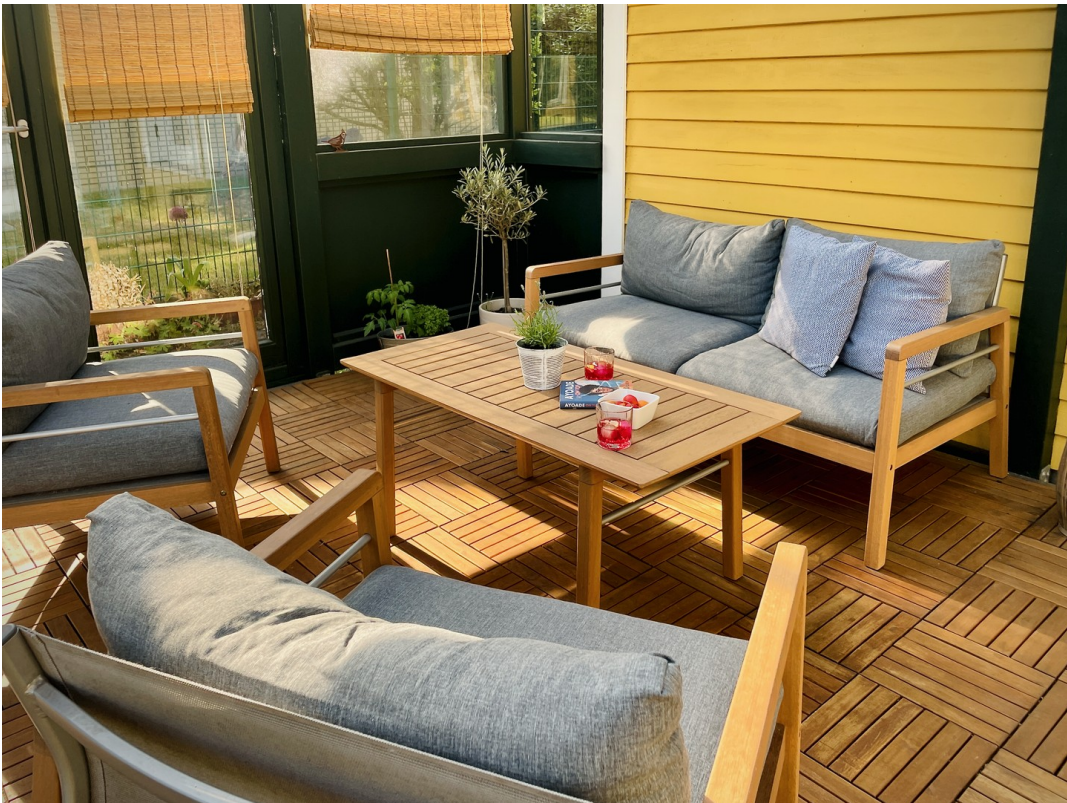
Große Süd-Terrasse (ca. 29 m 2 )