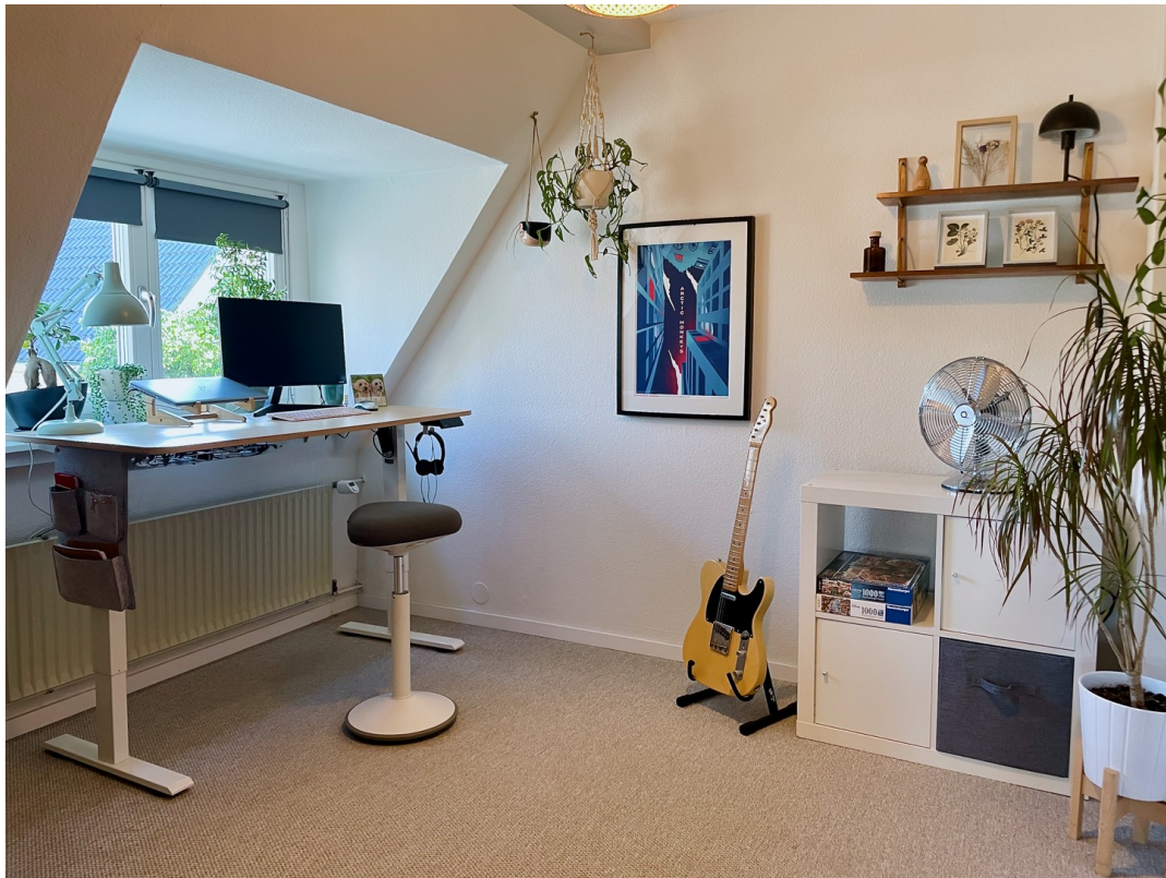
Kinderzimmer oder Büro