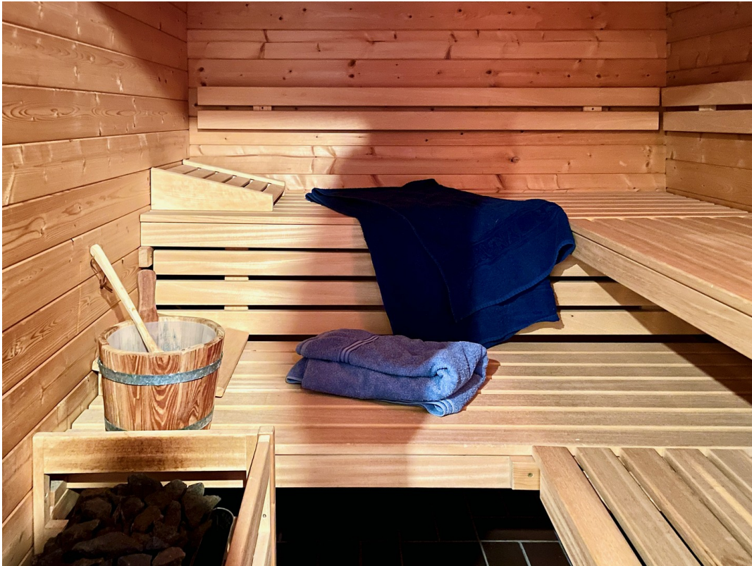
Sauna für bis zu 4 Personen