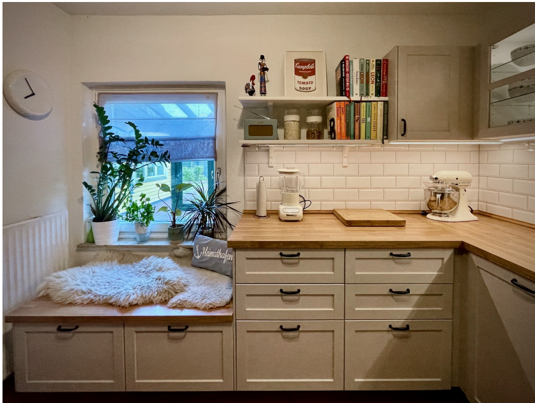
Moderne Landhausküche (2020)