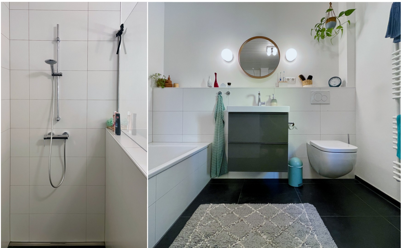
Bad mit Fußbodenheizung (2021)