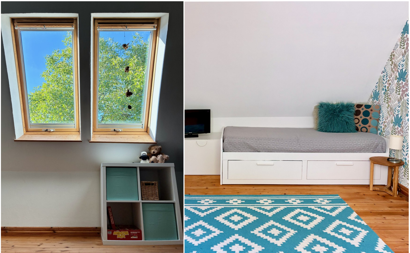
Helles Kinder- o. Gästezimmer