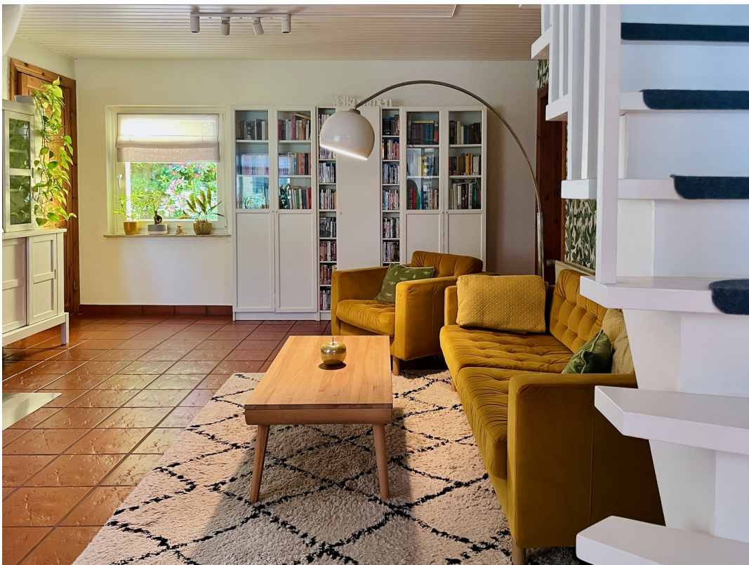
Terracotta-Boden & Holzterrasse