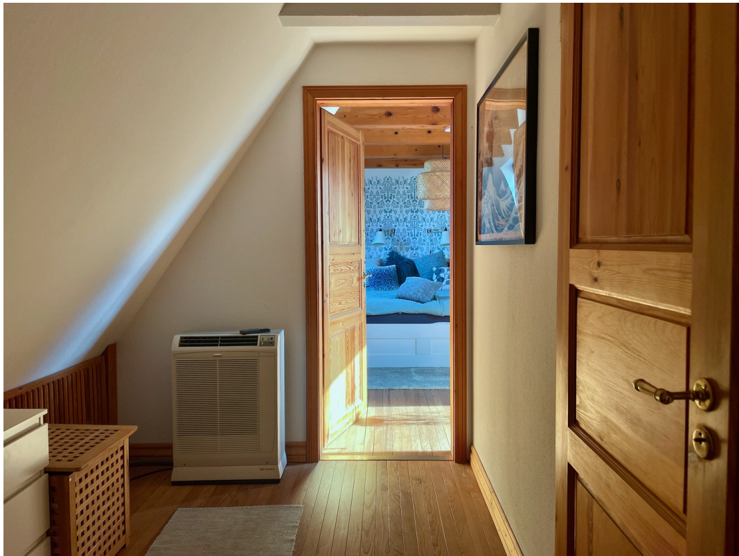
Flur mit Klimaanlage