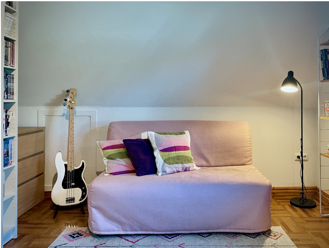
Platz für Schreibtisch & Sofa