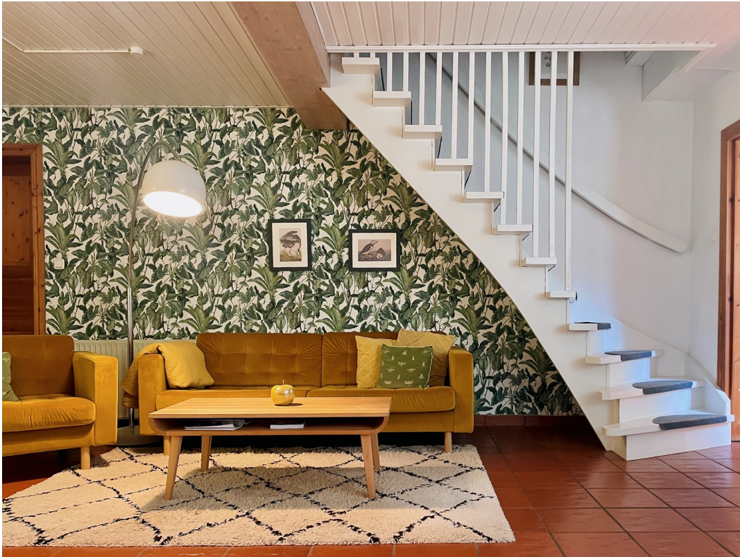
Großzügige Wohndiele, ca 23 m 2