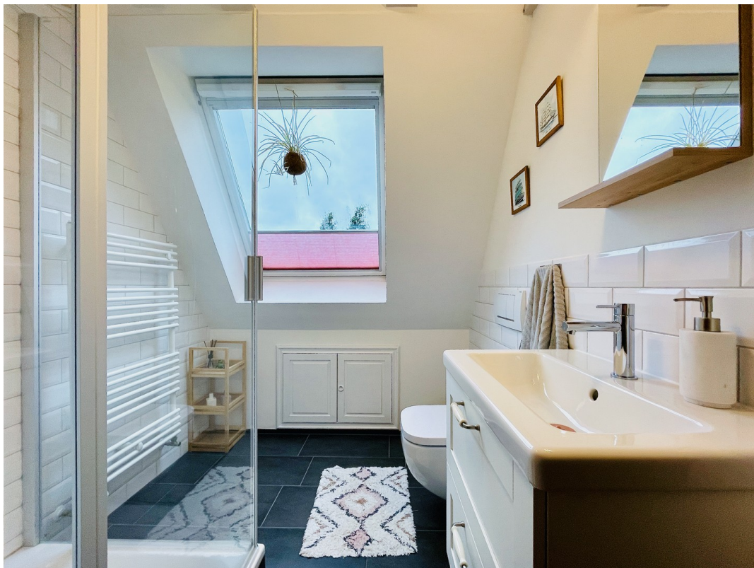
Zweites Duschbad m. viel Licht