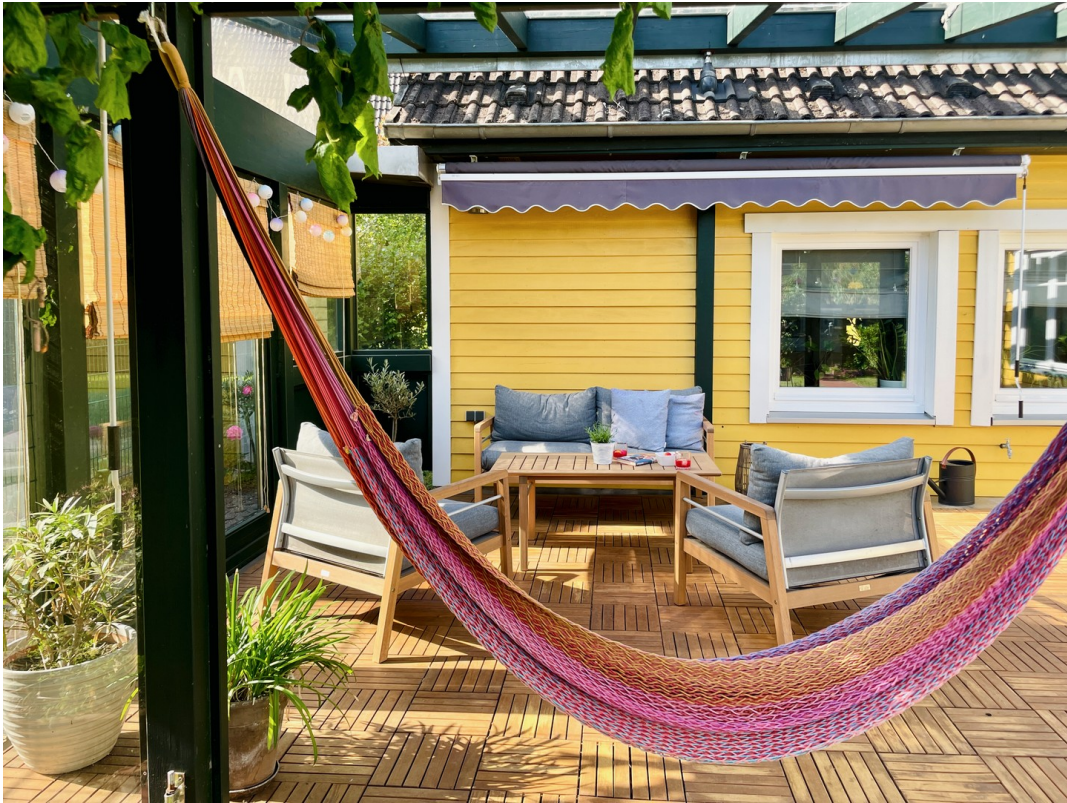
Solide, helle Glasüberdachung