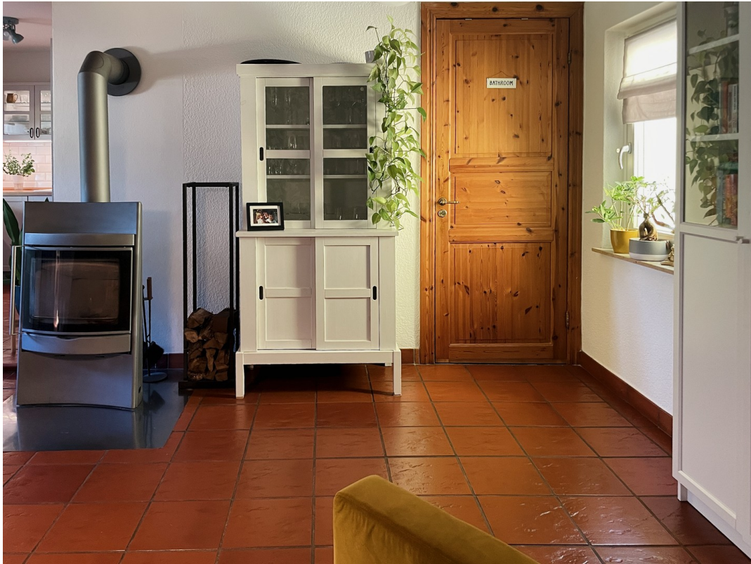
Moderner, gemütlicher Kamin