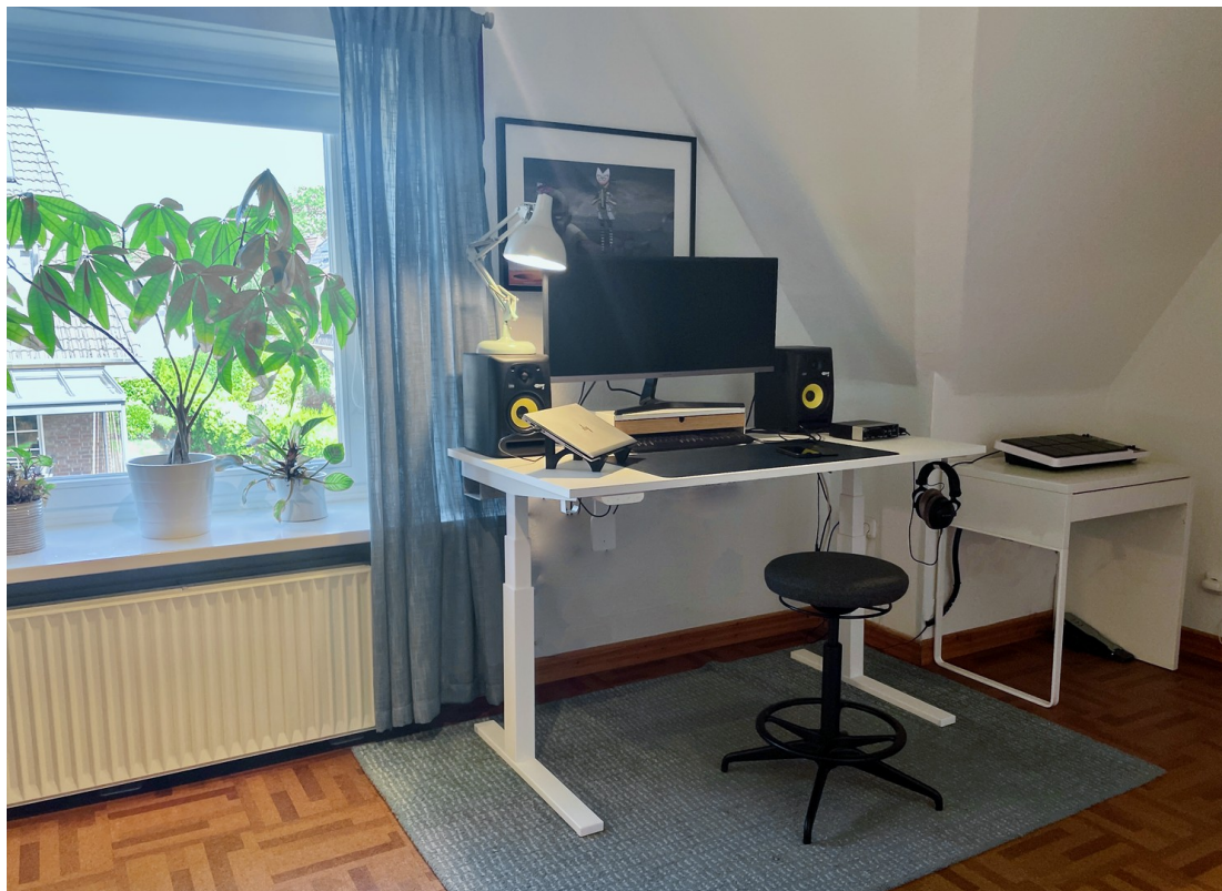
Großzügiges Arbeitszimmer 16m 2