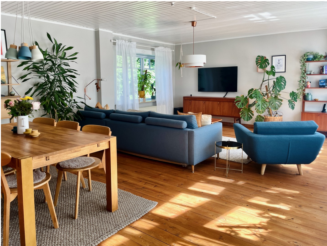
Wohnbereich, großzügig u. warm