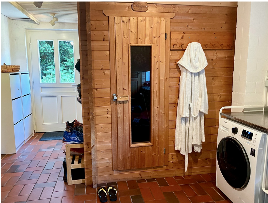
HWR & Haustechnik (ca. 19 m 2 )