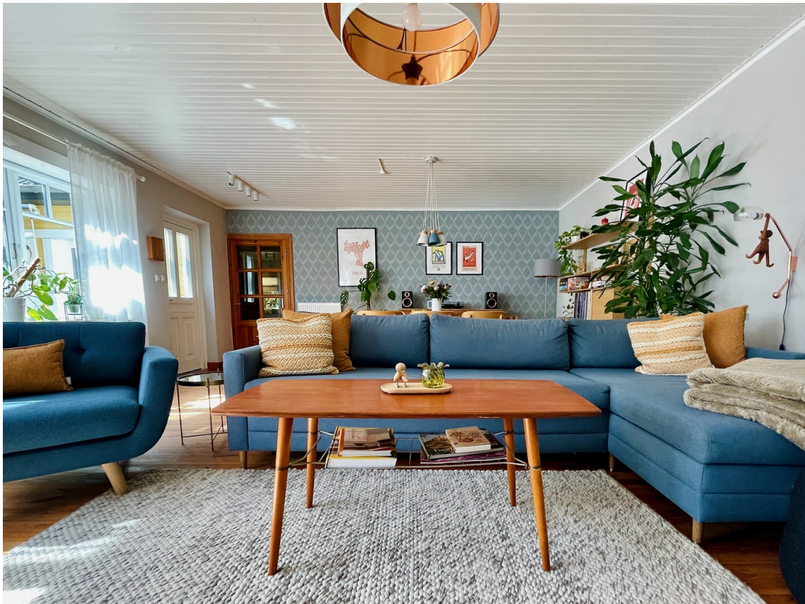
Wohn- und Esszimmer, ca. 42 m 2