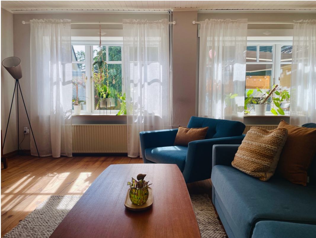
Helles Zimmer - Eichenfenster