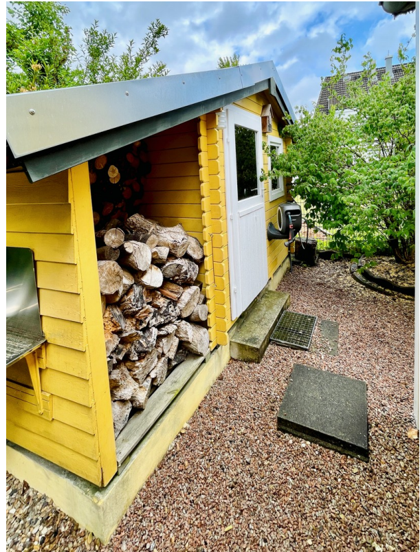
Gartenhaus mit Holzlager