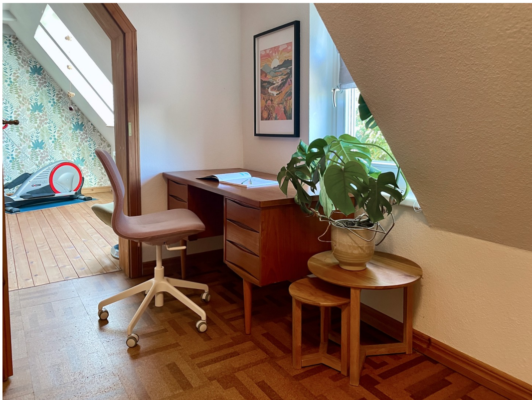
Vorflur mit Arbeitsbereich