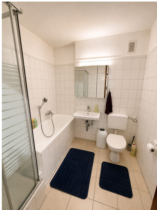
Duschbad mit Badewanne